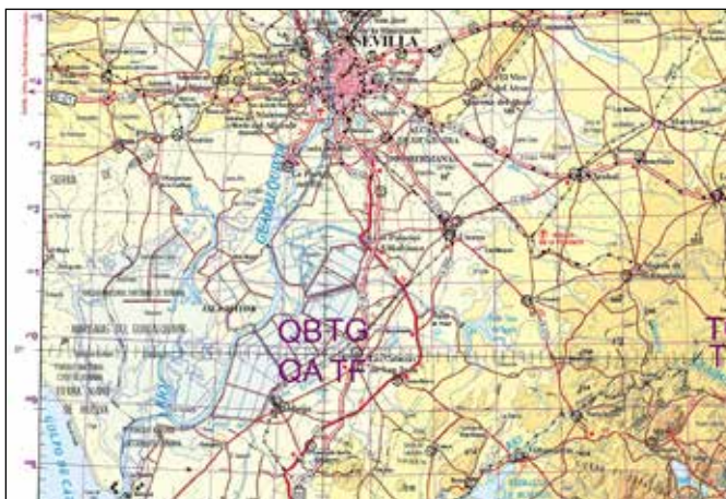
Serie 1404 (Escala 1:500.000). Detalle