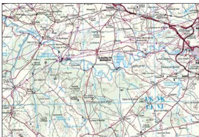
Serie 250M (Escala 1:250.000). Detalle