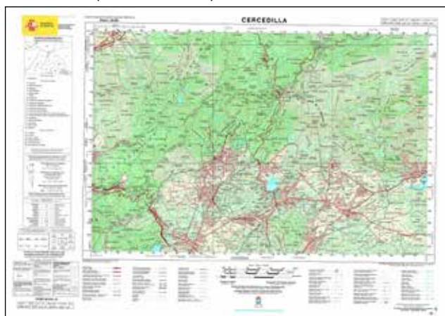
Serie M7815 (Escala 1:50.000)