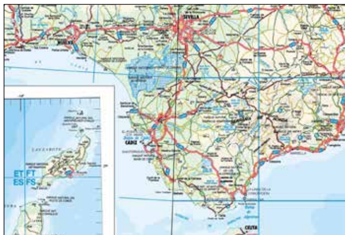
Mapa General de España (Escala 1:1.000.000). Detalle

Su sistema de referencia es ETRS89, y su proyección, cónica conforme de Lambert. La altimetría y la batimetría se representan mediante tintas hipsométricas y sombreado, que le dan sensación de relieve.