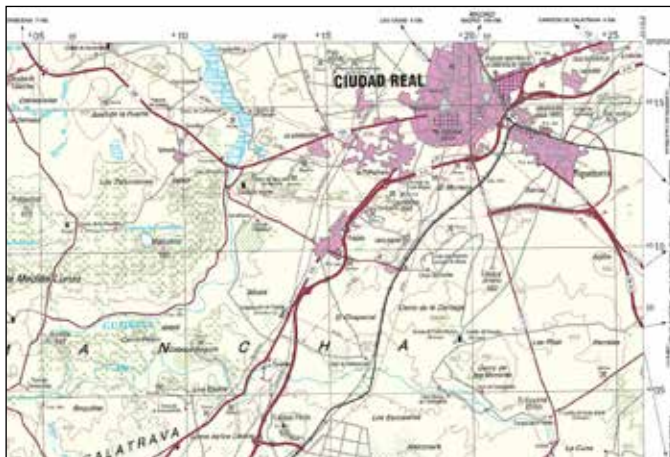
Serie M682 (Escala 1:100.000). Detalle

año 1993, en el sistema de referencia ED-50 con proyección UTM. Esta fue la primera y última vez que se ha completado.