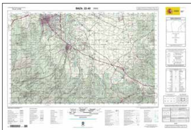
Serie M7814 (Escala 1:50.000)

Para que el usuario note inmediatamente la diferencia de una serie a la otra, se decidió trasladar la columna de marginalia: a la izquierda del mapa en la serie M7814 (ED-50), a la derecha en la serie M7815 (ETRS89). La diferencia es también notoria cuando se unen dos hojas contiguas, pues la cuadrícula de una no coincide con la de la otra. En las hojas de la serie M7815 se ha añadido el inicio de las coordenadas UTM ED-50 cada kilómetro en color azul.