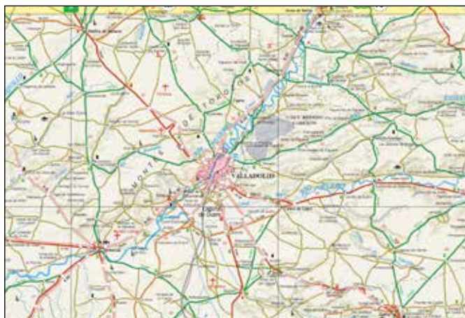
Guía Militar de Carreteras (Escala 1:400.000). Detalle

La orden de la formación de esta serie data del año 1902, por « reducción [...] de los levantamientos efectuados por el Cuerpo de Estado Mayor y por la ampliación de las hojas del Mapa Itinerario, escala 1:200.000 ». En distintas ocasiones a partir de esa fecha se acometió su producción, siendo regulada por distintas reales órdenes, decretos y reales decretos, pero sin llegar a finalizarse hasta el