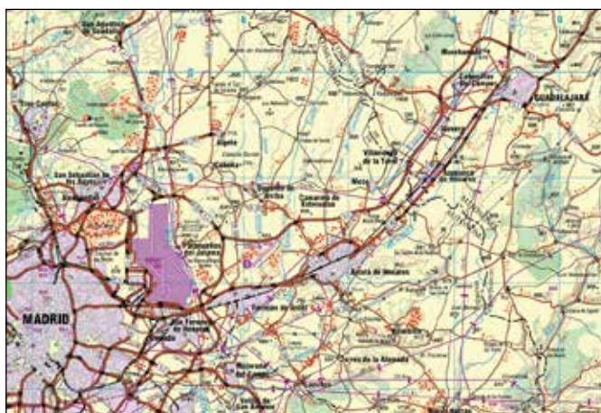
Serie 1501-G (Escala 1:250.000). Detalle