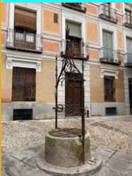
El Pozo Amargo, famoso por su leyenda, en la plaza de su mismo nombre, Toledo.

El programa de cuentacuentos del Museo del Ejército te invita, durante los domingos del mes de junio, a conocer gran cantidad de secretos de la ciudad de Toledo a través de sus leyendas. Ven con nosotros y aprende algo diferente de esta maravillosa ciudad: descubriremos qué significa pasar una noche toledana, cómo perdió el reino el último rey visigodo, leyendas de brujas, de amores imposibles, y todo ello en el Alcázar, uno de los edificios más importantes de la ciudad, el cual también cuenta con sus propias leyendas que, por supuesto, también te contaremos.