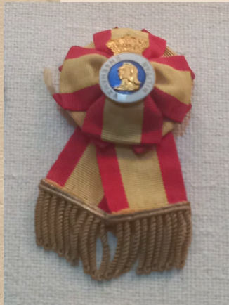
Distintivo de profesor. Sala de uniformidad. MUSEO DEL EJÉRCITO

«VISITA TALLER PARA ADULTOS: LA IMPORTANCIA DE LOS ORNAMENTOS EN LOS UNIFORMES MILITARES. INICIACIÓN A LA ELABORACIÓN DE ESCARAPELAS».