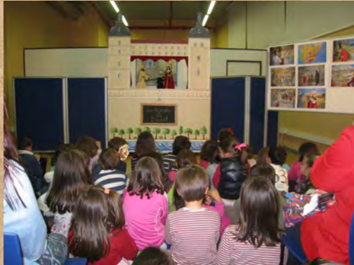
Teatro de guiñol en la sala de actividades culturales- MUSEJE

Nuestro caballero del Museo tiene un problema: se le ha roto su espada. No sabe qué hacer ahora, ya que un caballero sin espada es como un desayuno sin tostada, como una capa que no abriga nada, como un chiste sin una buena risotada, como montar a caballo sin una buena galopada... vamos, que está triste. ¿Dónde podrá encontrar otra espada que sea una monada y que no esté oxidada, digna de un caballero con armadura plateada? ¡Pues en el Museo del Ejército, vaya pregunta más chupada! Venid a ayudar a nuestro caballero a elegir una nueva espada entre todas las que tenemos en el Museo, perfectamente cuidadas.