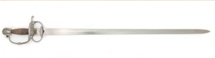
Espada de Hernán Cortés - MUSEJE

Fechas y horarios: domingo 28 (a las 12:00 y 13:00 horas). DIRIGIDO A PÚBLICO FAMILIAR CON MENORES. Duración: 30 minutos. Modo de inscripción: en las taquillas del Museo, el mismo día de la actividad. Actividad gratuita, incluida en el precio de la entrada al Museo. Esta actividad puede estar sujeta a cambios. Les rogamos consulten la web del Museo del Ejército y sus redes sociales.