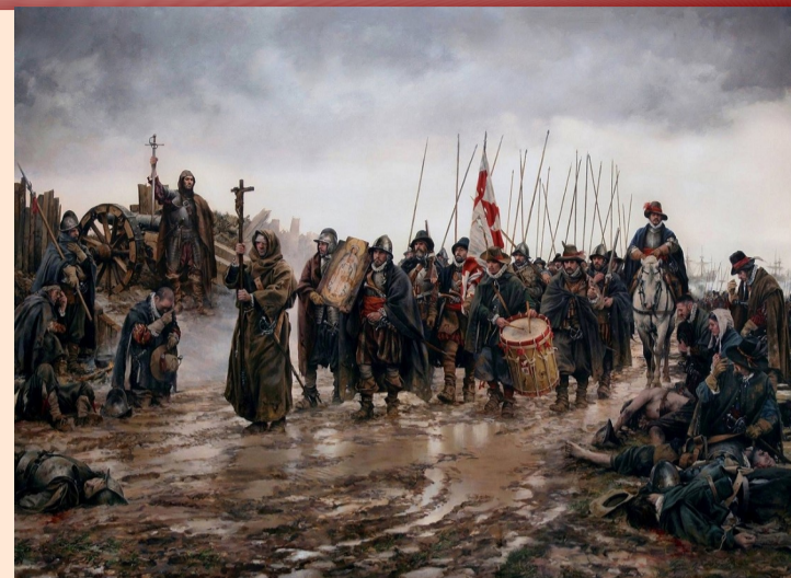
Óleo. El milagro de Empel. Autor: Augusto Ferrer Dalmau.

MODO DE INSCRIPCIÓN: En las taquillas del Museo el mismo día de la actividad. Actividad incluida en el precio de la entrada.