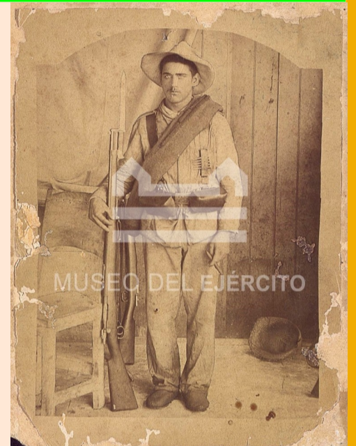
Fotografía Histórica. Soldado español en la Guerra de Cuba.- Foto: MUSEO DEL EJÉRCITO.

Actividad gratuita // El número de plazas vendrá determinado por el aforo de la sala de exposiciones temporales.