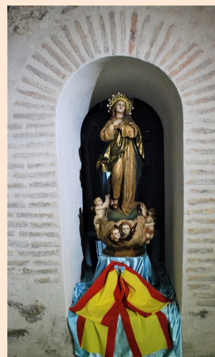
La Inmaculada Concepción, Patrona de los Tercios y del Ejército Español. Museo del Ejército.