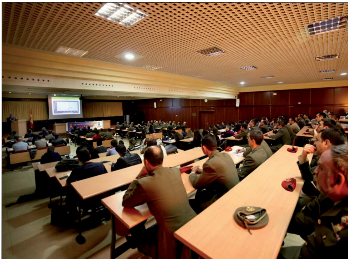
Las jornadas registraron una gran asistencia de alumnos civiles y militares.