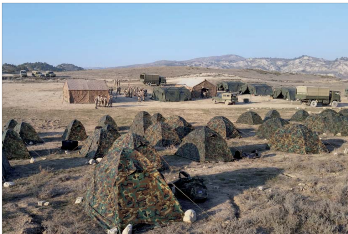
Armas y Cuerpos

Para empezar, los alféreces que realizan el plan de liderazgo están al mando de las compañías de primer y segundo curso. A estas se les imparte la asignatura de orden cerrado, donde se exige y se forja la marcialidad que todo oficial ha de poseer. Por otro lado, se realizan guardias de seguridad en la Brigada de Caballería de "Castillejos II". En éstas se ejerce de auxiliar del Teniente y se tiene la oportunidad de conocer y familiarizarse con el día a día de una unidad militar, con el trato a la tropa y suboficiales y lo más importante, ya no sólo se aprende de los manuales y libros de normas, sino de los