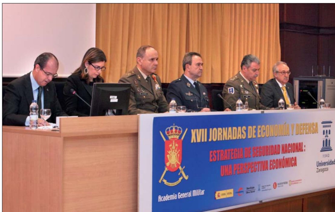
La mesa presidencial de la jornada inaugural de las Jornadas de Economía y Defensa.

"Como todos sabemos, desde finales del siglo pasado los cambios en el tipo de ame-