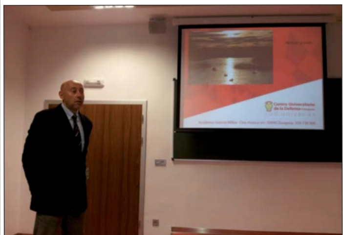
Armas y Cuerpos