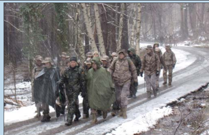
Armas y Cuerpos

La marcha estaba programada desde el sanatorio de Agramonte (1.060 metros) hasta el Santuario de la Virgen del Moncayo (1.621 m.), pero una vez más en lo que ya se convierte en una costumbre, el tiempo nos volvió a jugar una mala pasada y conseguimos llegar a la Fuente de los Frailes (1.345 m.) acompañados siempre de una persistente lluvia, y de la nieve que había caído días atrás y que la lluvia provocaba que también cayera sobre