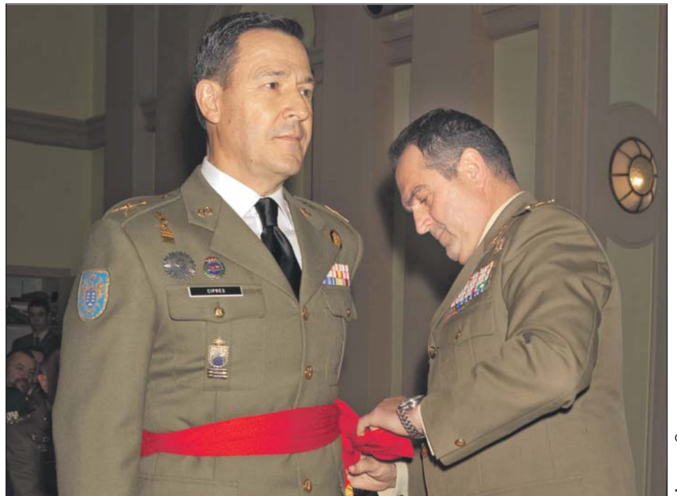
El General Gan Pampols, padrino del acto, impuso la faja al General Ciprés Palacín.

Por último, el General Ciprés recibió el bastón y el sable, símbolos de su nueva condición militar y dirigió unas palabras a los asistentes al acto. Durante su intervención recordó con cariño su etapa en la Academia General Militar como Jefe de Estudios y agradeció los apoyos recibidos en este tiempo por parte del personal civil y militar.