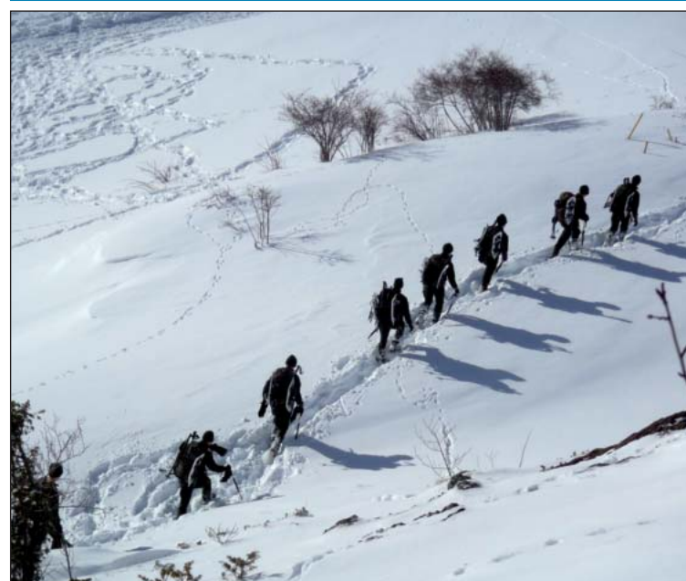
Los alféreces, durante las prácticas de montaña invernal.