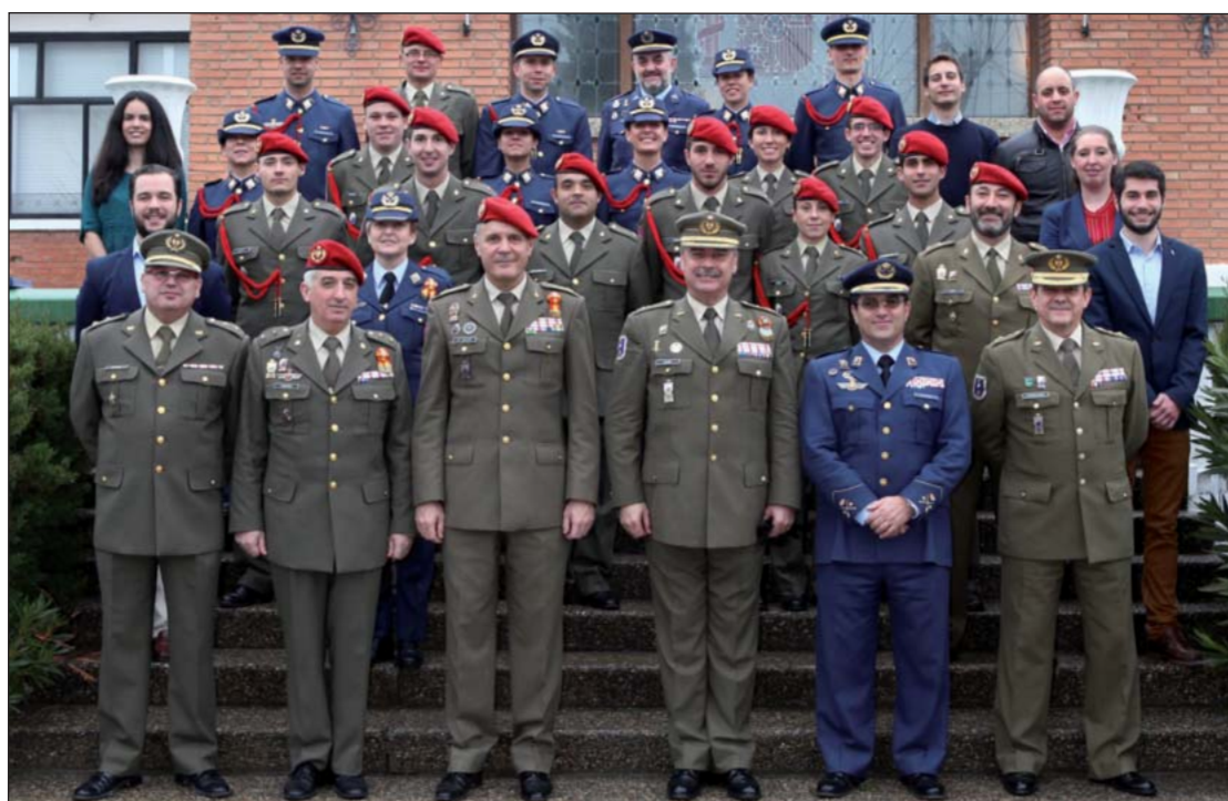
Las jornadas han contado con una gran participación de alumnos civiles y militares.

La actual Estrategia de Seguridad Nacional de 2013 pone de relevancia la inestabilidad económica y financiera como una de las principales amenazas que se cierne sobre la sociedad actual, y a lo largo de las once conferencias que se han desarrollado, se han puesto de manifiesto estos riesgos a los