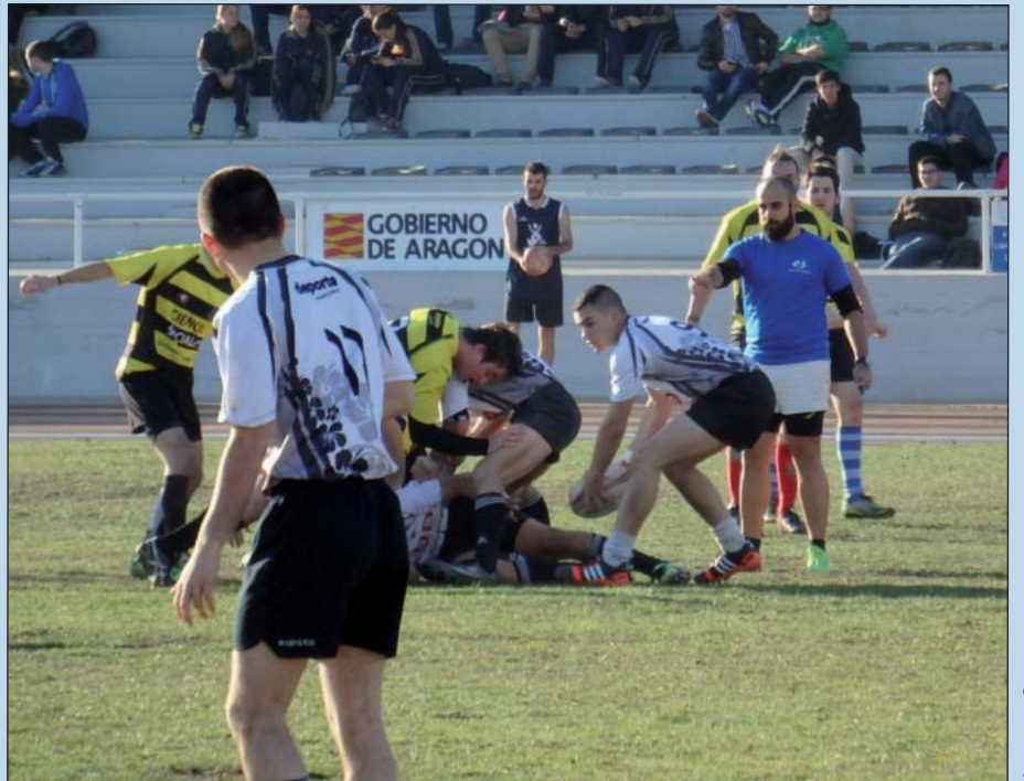
Armas y Cuerpos

Los equipos de voleibol y de rugby masculino se mantienen en lo más alto de sus respectivas clasificaciones.