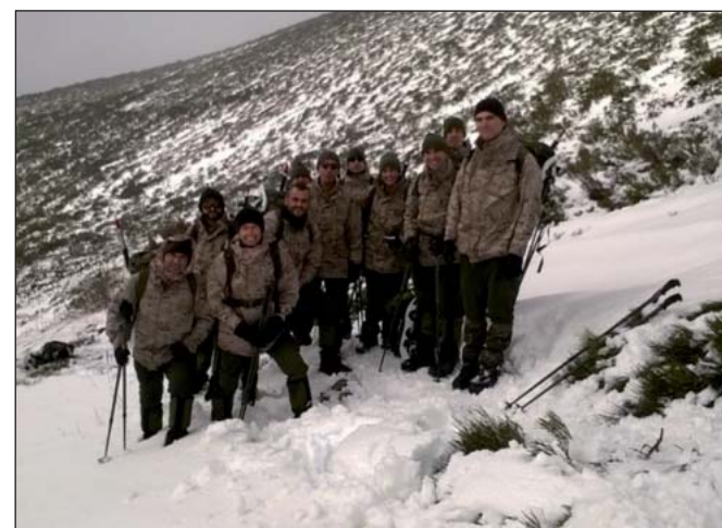
Armas y Cuerpos

La frustración de no haber podido hacer cima no hizo más que redoblar las ganas de los man-