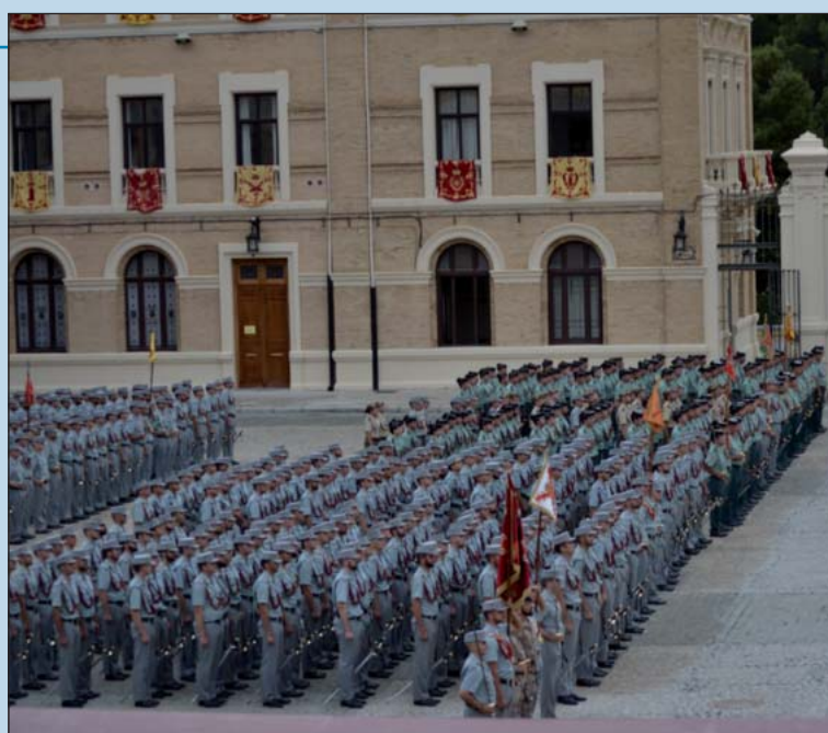
Las vacaciones suponen un paréntesis para los cadetes.

También es importante descansar, coger fuerzas y aprovechar esos placeres o detalles propios de nuestros hogares, como la comida hecha por nuestras madres o descansar en el sofá. Por último