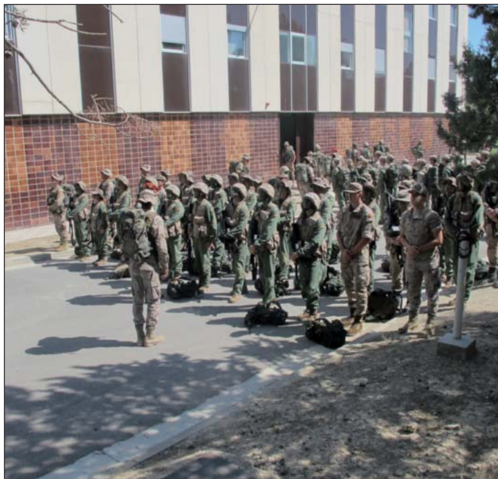
Armas y Cuerpos