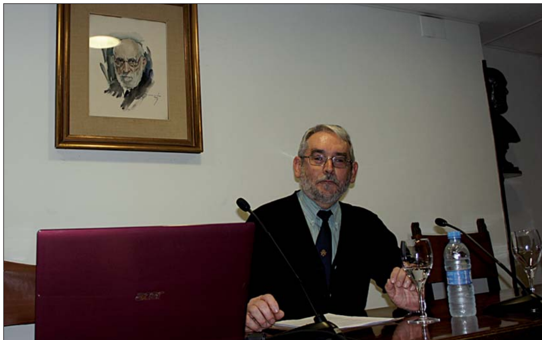
El Coronel Luis Alfonso Arcarazo pronunció la conferencia en el Colegio de Médicos de Huesca.

El primer edificio que se levantó fue cuartel de tropa, que debía de servir inicialmente para alojar a los alumnos de la 1ª promoción, ya que los edificios de la AGM, estarían en