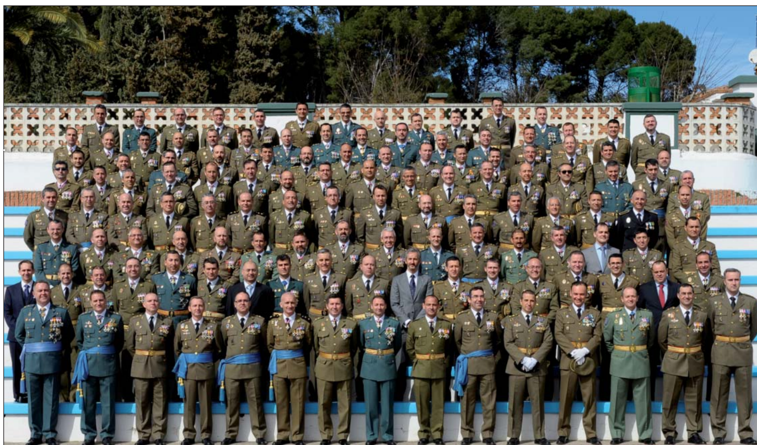
A.G.M.-promoción XLIX-bodas de plata

El Director de la Academia General Militar recordó que ha tenido el honor de tener bajo su mando a varios de los componentes de la XLIX Promoción y que ha podido trabajar con algunos de ellos en diferentes destinos y unidades. "Por ello -señaló- puedo asegurar que han demostrado ser excelentes profesionales y que siempre han dado muestras de una gran disciplina, lealtad, compañerismo y un elevado espíritu de sacrificio, virtudes esenciales para nuestra profesión en las que se forjaron en esta Academia".