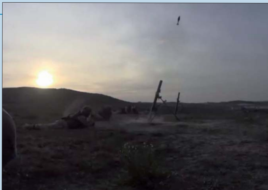
Los alféreces cadetes también se han puesto al día en el manejo de morteros.

A nuestra disposición tuvimos por primera vez medios de visión nocturna acoplables al propio fusil HK (visor holográfico) y al casco (visión nocturna). Novedosos elementos que facilitaron el tiro de combate