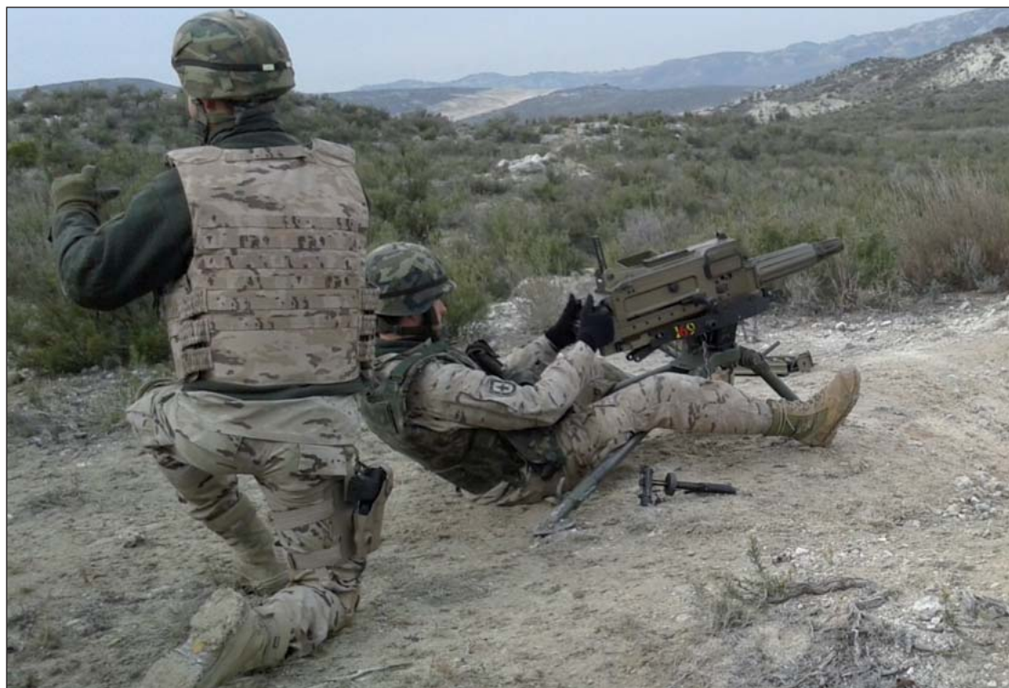
Los alféreces han practicado el asalto de brechas a posiciones defensivas.

En cuanto al tiro con morteros, se diferencian también dos núcleos. El primero es sobre el que recae la responsabilidad de realizar los distintos cálculos balísticos que permiten obtener los efectos deseados sobre el