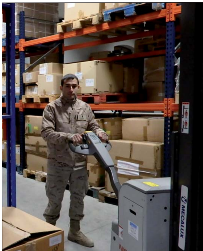
En la actualidad desempeña su trabajo en el Vestuario.

Otra opción que también se plantea es intentar entrar en la Básica para lo que necesita acabar el Bachillerato.