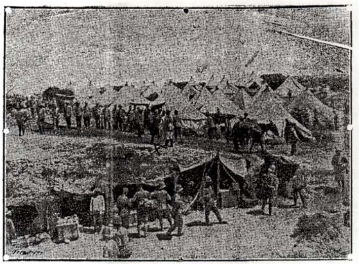
TETUAN.-Vista general del campamento de bauzien.