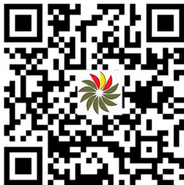
Tu DIAPER (IOS)