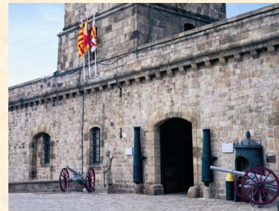
Castillo de Montjuïc

Sus fondos museísticos son la aportación del Ejército a las colecciones del Museo del Patronato del Castillo de Montjuïc.