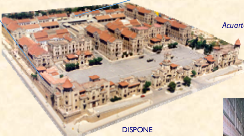
Acuartelamiento "El Bruch"