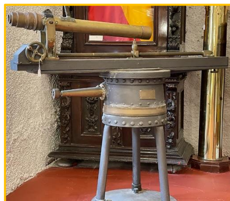
Telemetro de pieza Paesia Modelo 46, proviene del Parque de Artillería de Ceuta 1989.