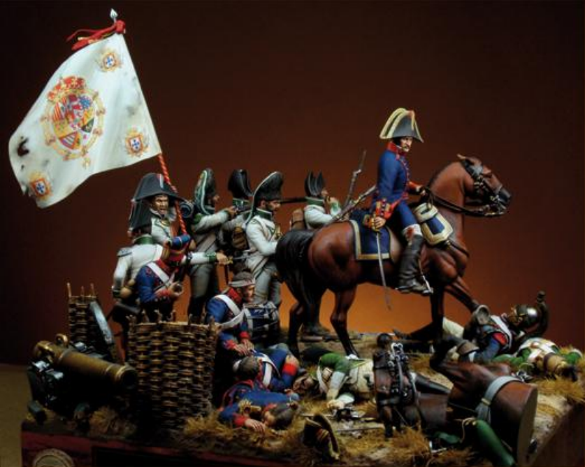
J. Gamarra, «Bailén 1808»

La obra pictórica cobra vida gracias al trabajo de un nutrido grupo de miniaturistas militares que han encontrado en los lienzos del artista fuente de inspiración para modelar sus obras.