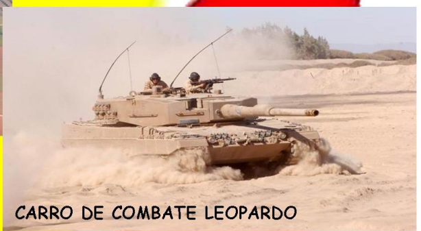
CARRO DE COMBATE LEOPARDO

EXPOSICIÓN DE MATERIALES Y EXHIBICIONES DINÁMICAS