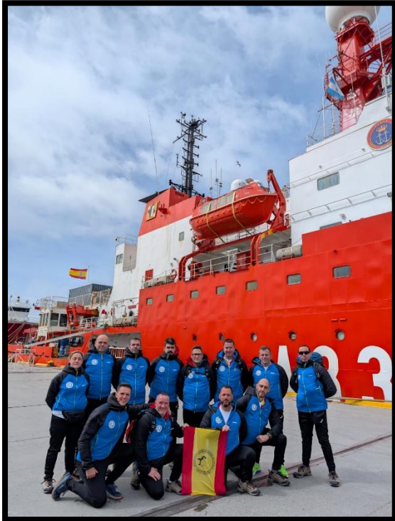
Dotación frente a BIO Hespérides

Sin embargo, en la parte final de la travesía, especialmente a la llegada a las islas Shetland del Sur, las condiciones resultaron muy benévolas, lo que permitió disfrutar de las impresionantes vistas previas a la llegada a la Base Antártica Española Juan Carlos I.