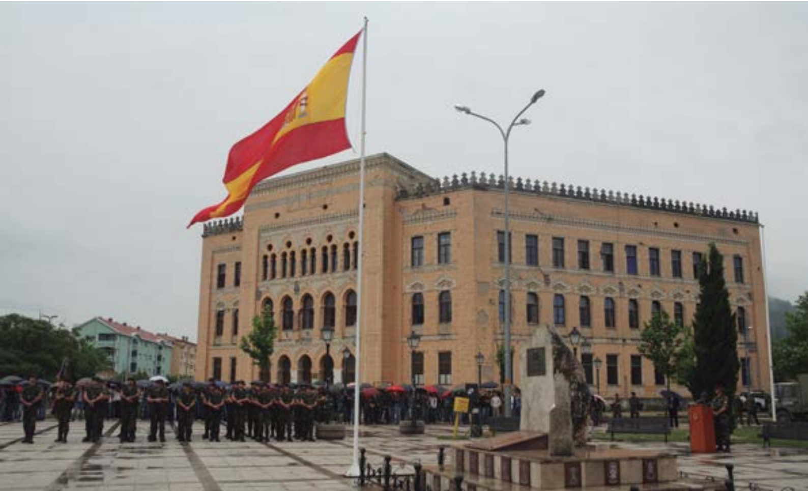
Centro de Mostar, al que se denominó plaza de España, 13 años después

tenía dos importantes destacamentos en Trebinje y Nevesinje (ambas poblaciones al sur de Mostar).