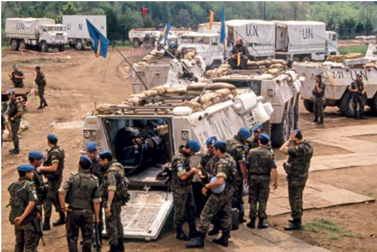
Preparativos para iniciar un convoy en el destacamento de Jablanica

de lleno en ningún conflicto internacional formando una unidad. La única misión relevante había sido, entre abril y junio de 1991, en Irak. En esa ocasión, la Brigada Paracaidista y las Fuerzas Aeromóviles del Ejército de Tierra, junto con algunos otros mandos y unidades, habían tomado parte en la operación "Provide Comfort" (de ayuda humanitaria), patrocinada por la ONU y ejecutada por la OTAN, en el Kurdistán iraquí. También había participado en diferentes misiones enviando militares como observadores de paz... pero nada como esto.