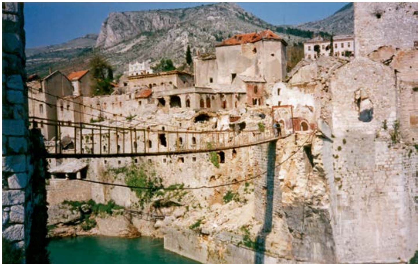
Puente provisional que se hizo para facilitar a la población cruzar

Otra novedad fueron los Grupos Tácticos hispano franceses XIX y XX, que desplegaron en noviembre de 2002 y en mayo de 2003; en el primero de ellos también hubo una baja española. Más de la mitad de la siguiente agrupación (la XXI) la componían militares del Mando de Artillería de Campaña (MACA), pero también había casi 370 franceses en ella. El Mando de Canarias formó el grueso de las dos siguientes Agrupaciones (XXII y XXIII). Los cambios de denominación y composición de los contingentes no hicieron que cambiara la actitud de nuestros militares. En los años que han estado allí desplegados se han gestionado diferentes tipos de