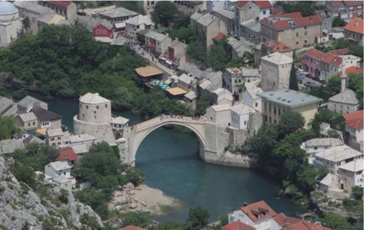
En la imagen, el nuevo puente

pañía para realizar intervenciones en las que necesitaban medios de los que allí no disponían.