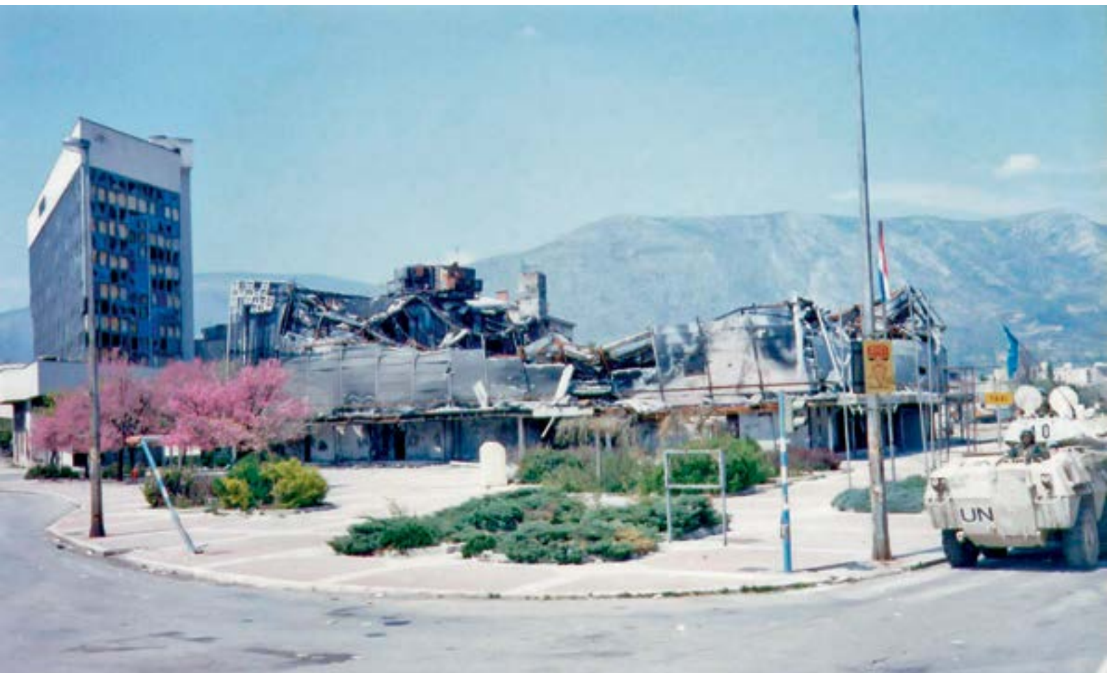
En la imagen, el centro de la ciudad de Mostar en el año 1994

diciembre de 1995. Entre otros asuntos, se determinaron las fronteras del país, que se determinó que fuera un estado unificado, que mantenía sus fronteras internacionales con dos entidades diferentes (Federación de B-H y República Srpska) sin fronteras internas (ver mapa en parte superior).