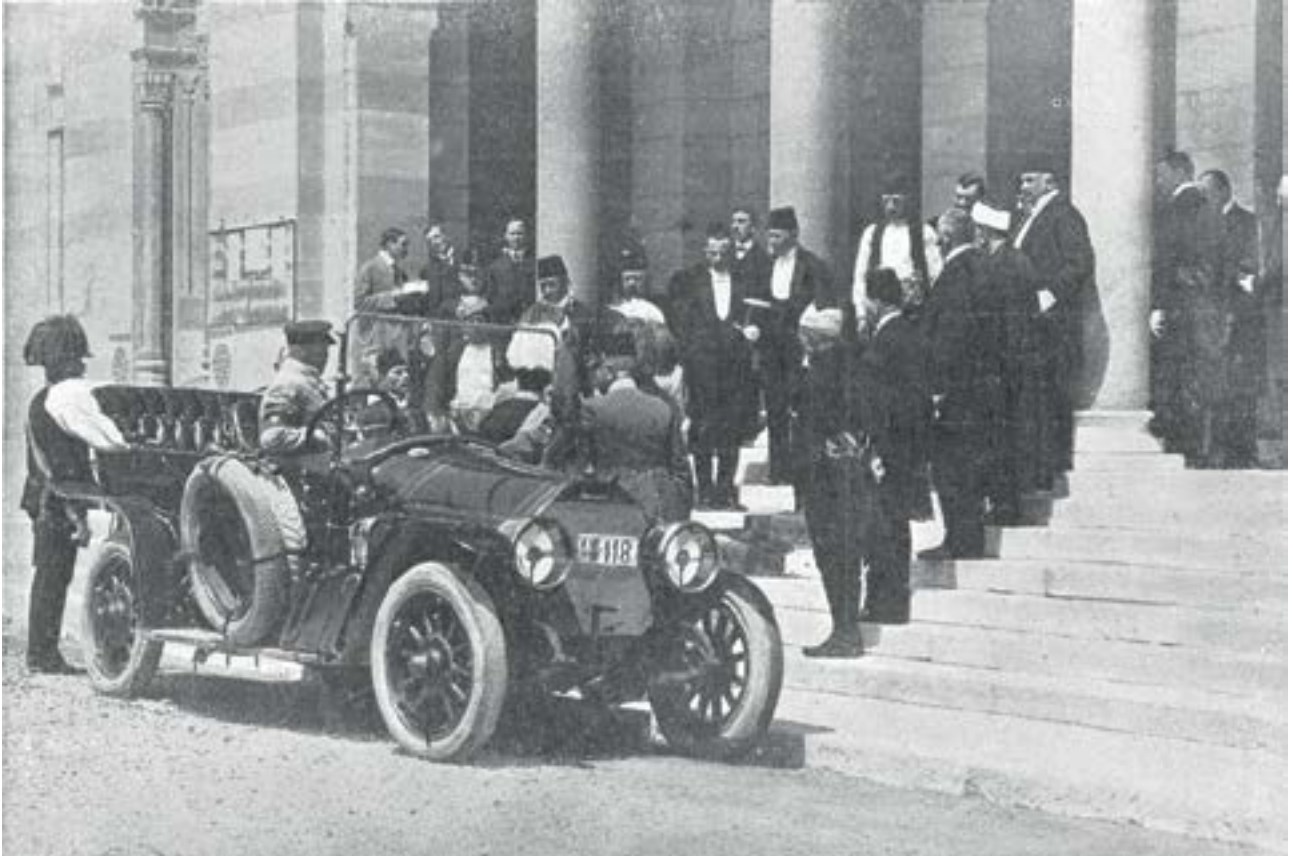
Momentos previos al atentado que terminó con la vida del archiduque Francisco Fernando

da al sur y conocida entonces como Hum, cayó bajo dominio otomano en 1483, compartiendo desde entonces ocupación y vicisitudes con Bosnia.