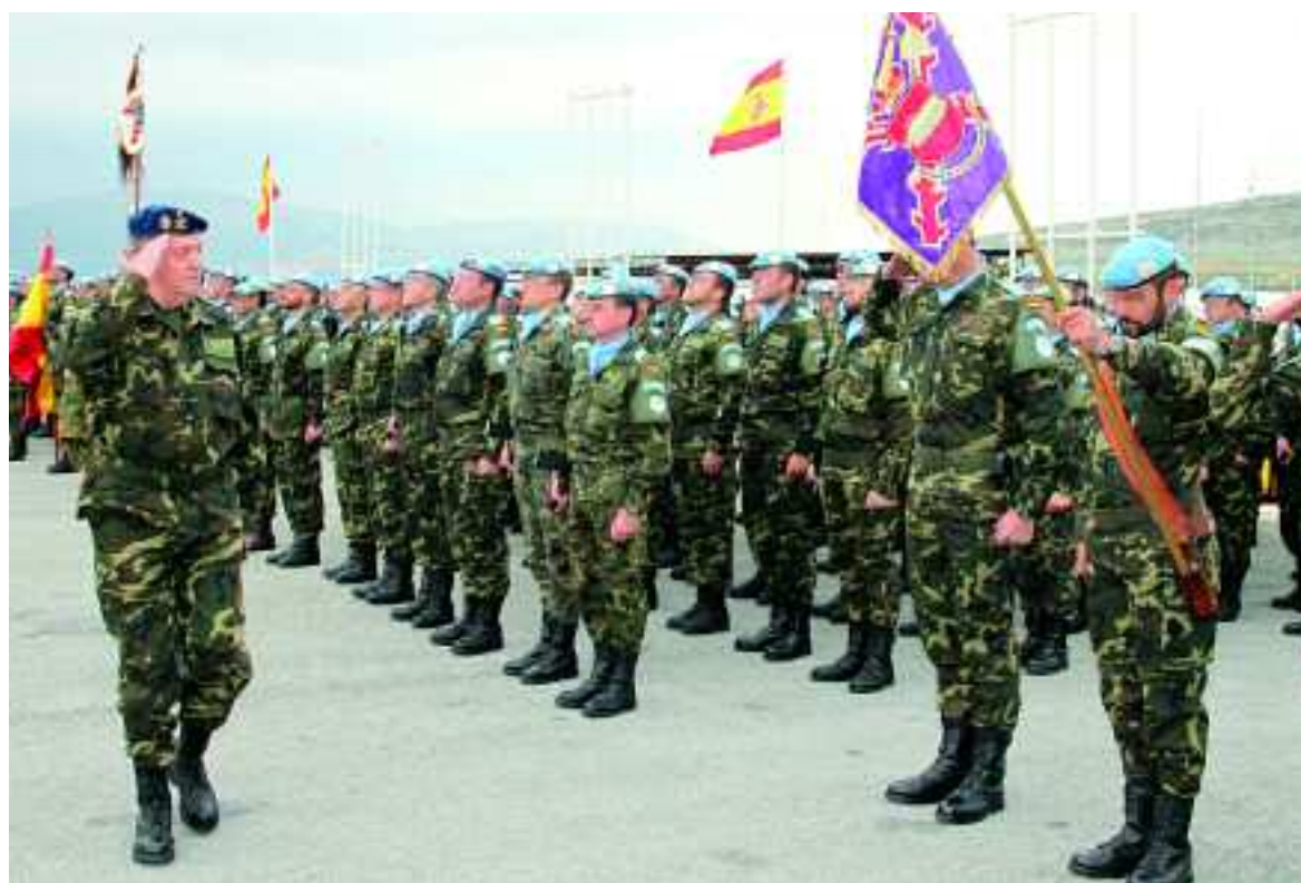
Es la primera vez que el Rey visita la base española "Miguel de Cervantes"

impresiones con ellos. Además tuvo ocasión de felicitar personalmente por su nombramiento al general Asarta, elegido para liderar la Fuerza Interina de Naciones Unidas en el Líbano (FINUL).