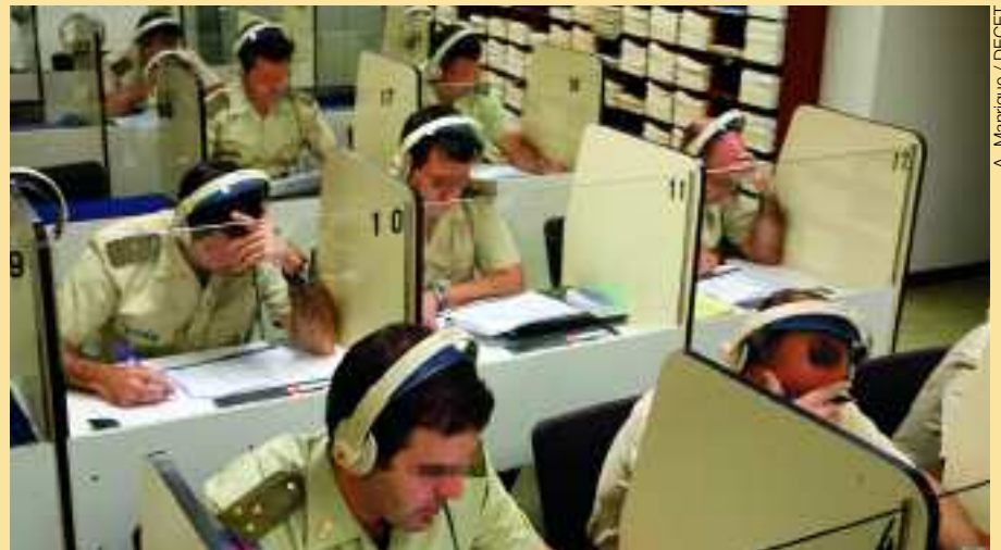
En muchas unidades se imparten clases de inglés

Dada la apuesta realizada en materia de idiomas, se han puesto en marcha distintos planes para favorecer la mejora del nivel de los miembros de las FAS. Por ejemplo, en diciembre se realizaron unos cursos intensivos de dos semanas de este idioma y otros de inmersión lingüística con un mes de estancia en Irlanda y Reino Unido. Por otro lado, y coincidiendo con la presidencia espa-