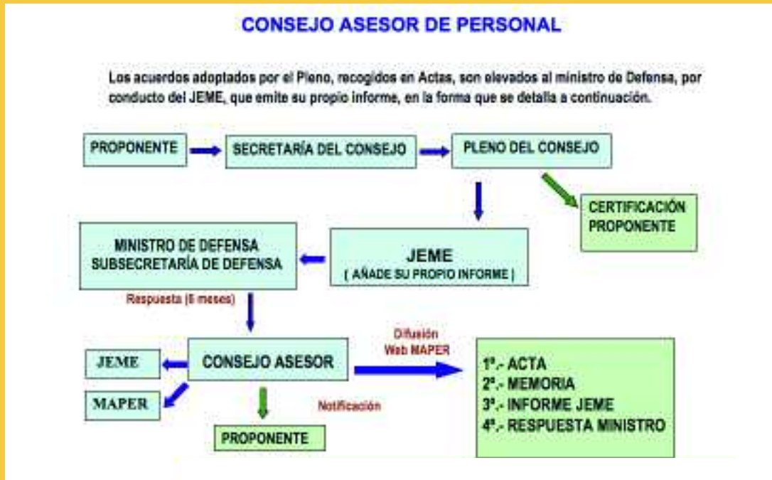
Organigrama de funcionamiento del Consejo Asesor de Personal

En cuanto a evaluaciones se ha pedido la creación de mecanismos para lograr mayor transparencia, seguridad normativa e irretroactividad de disposiciones no favorables, en las valoraciones de mérito.