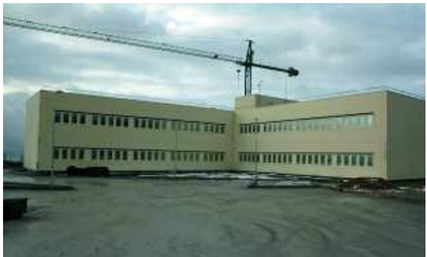
Las instalaciones del centro de excelencia contra IED están casi terminadas

La madrileña localidad de Hoyo de Manzanares acogerá unas nuevas instalaciones militares, las del Centro de Excelencia contra Artefactos Explosivos Improvisados (IED), que están ultimándose. Este centro se enmarcará dentro de la estructura de la OTAN y tendrá carácter multinacional. Su objetivo es convertirse en el punto de referencia aliado para la formación de especialistas frente a este tipo de explosivos.