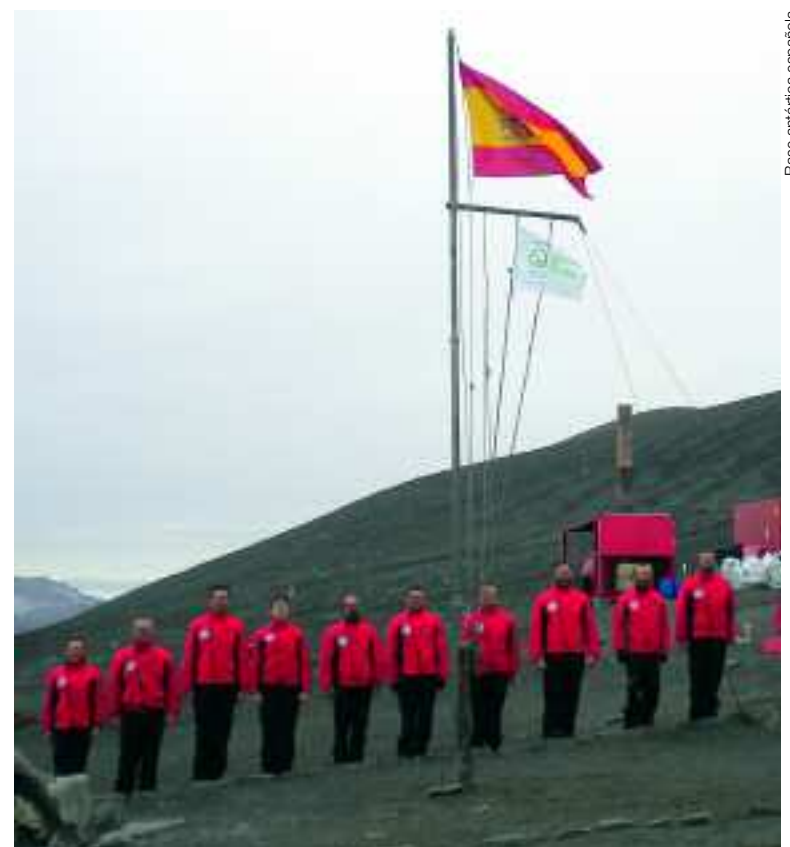
La bandera de AENOR ondeó junto a la de España