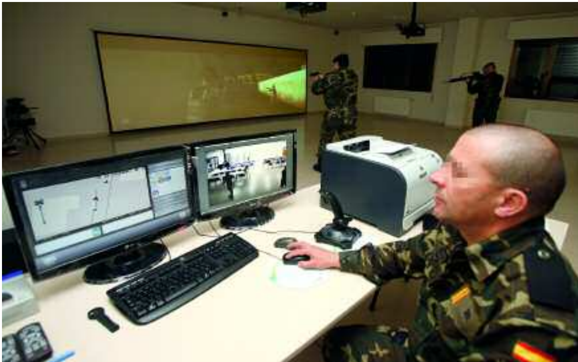
Marco A. Romero / DECET

El brigada Zapata de la BRIPAC maneja el simulador en la base "Príncipe"