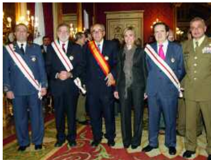
Los cuatro condecorados junto a la ministra y el JEME

En un acto celebrado el 26 de enero en el Palacio de Buenavista, sede del Cuartel General del Ejército, la ministra de Defensa, Carme Chacón, impuso la Gran Cruz del Mérito Naval al ex presidente del Congreso, Gregorio Peces-Barba. Además, la ministra entregó la Gran Cruz del Mérito Militar con distintivo blanco al teniente general del Ejército del Aire y ex director de la Guardia Civil, Carlos Gómez Arruche, al