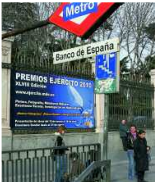
Cartel promocional de la convocatoria