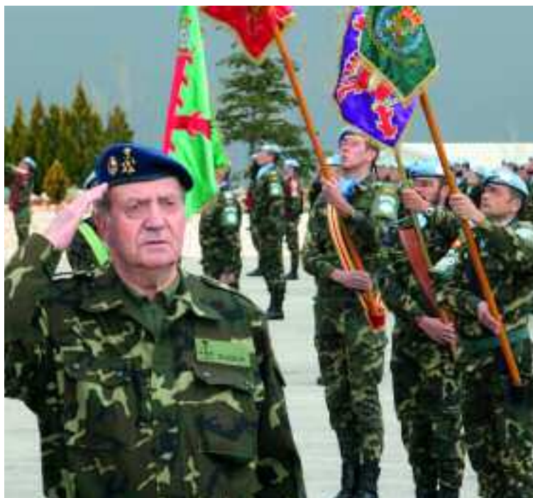
El Rey pasó revista a las tropas españolas de misión en el Líbano

El Monarca quiso llevarles un mensaje de agradecimiento y de reconocimiento ante la importante labor que desempeñan, de parte de la Familia Real al completo y de toda sociedad española. El momento elegido para este viaje no podía ser más