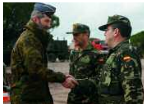
El JEMAD saluda al general Bonal

La práctica finalizó con la entrada en escena de las baterías Mistral, montadas sobre Vehículos de Alta Movilidad Táctica, que realizaron dos lanzamientos. Además, el JEMAD también visitó un puesto de mando del Nasams,