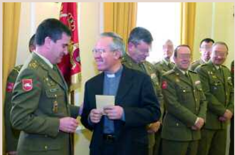
Miguel Alonso / OCFUP

El general Guerra, jefe de las Fuerzas Pesadas, entregó los donativos