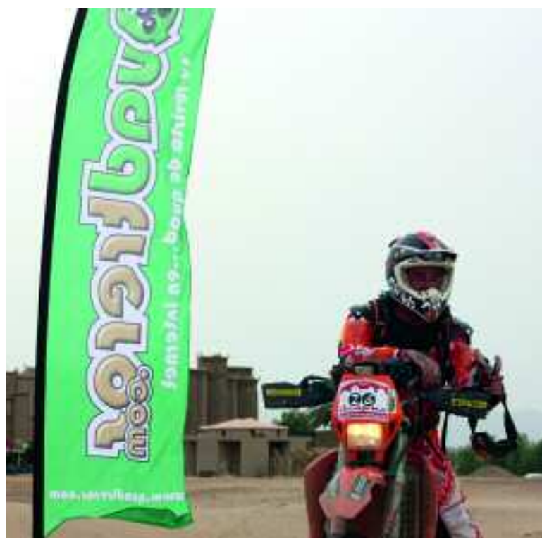
Los rallies son para los pilotos un ejercicio de soledad

que se adapta mucho a mis capacidades. Luego también influye la suerte, como en todo, pero sin una avería importante o un accidente grave, esperaba ganar», y así fue. Recorrió 2.000 kilómetros por el desierto de Marruecos en seis etapas sin un itinerario marcado y fue el más rápido de todos. «Ir solo por el desierto, no