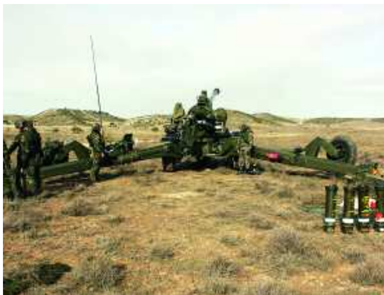
Un obús de 155/52 mm preparado para ser disparado

Todas las unidades del Mando de Artillería de Campaña, incluido por primera vez el Regimiento de Artillería de Costa nº 4, participaron en el ejercicio de adiestramiento "Apoyo Preciso I", desarrollado entre el 17 y el 27 de enero en el Centro de Adiestramiento "San Gregorio", y que incluyó ejercicios de tiro con fuego real. Con esta práctica las unidades alcanzaron el objetivo previsto, contar con la preparación necesaria para ponerse a disposición de organizaciones operativas de nivel cuerpo de ejército y división.