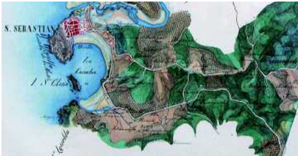
Detalle de uno de los mapas que se exhibirá en la muestra

El concurso para elegir el cartel de la XXII Falla de las Fuerzas Armadas ha finalizado. El jurado, presidido por el comandante militar de Valencia y Castellón, general Acuña, ha otorgado el primer premio —remunerado con 600 euros— al cartel titulado Unidos por la Fiesta . La entrega de premios tendrá lugar el 11 de marzo en el acuartelamiento “San Juan de Ribera”.