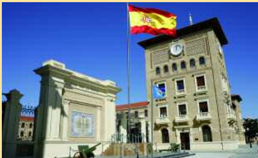
La Academia General Militar es uno de los centros de formación del Ejército

minados requisitos, tenían la posibilidad de suscribir un compromiso de larga duración hasta los 45 años, con el régimen establecido para la tropa en la Ley 8/2006. Esta disposición queda ampliada y se beneficiarán los que hayan adquirido la condición de militar de complemento con más de 31 años, quienes podrán prorrogar su compromiso hasta alcanzar los 18 años de tiempo de servicios, siempre que tengan la posibilidad de