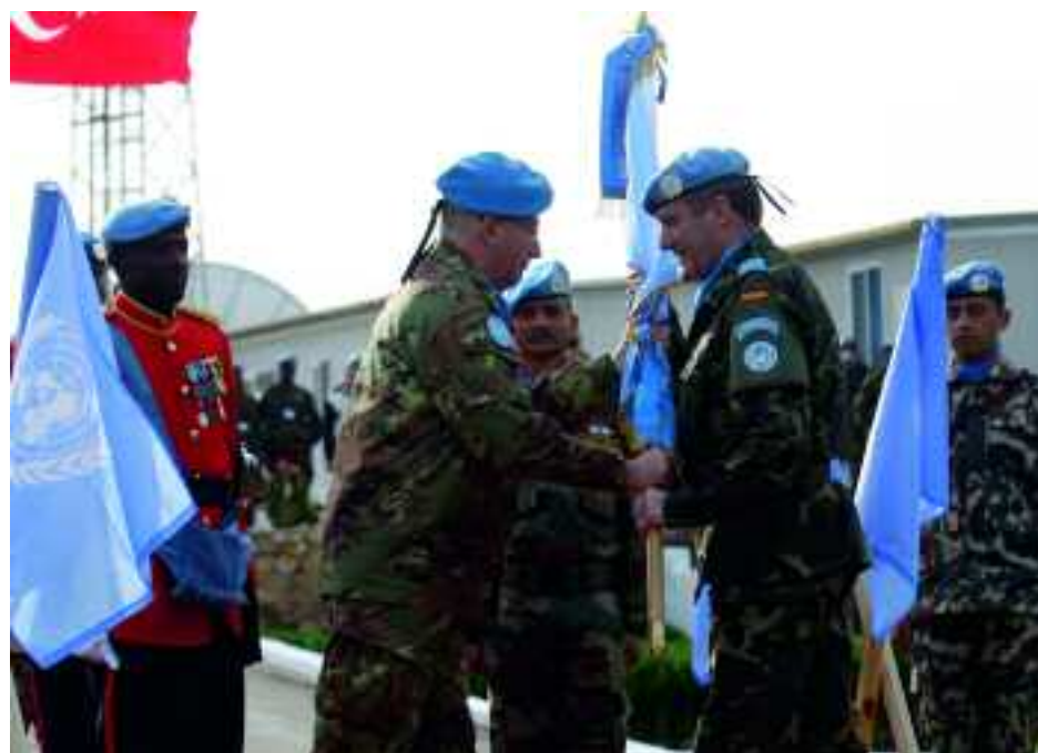
Relevo de mando en la misión de la Organización de Naciones Unidas en el Líbano

Por su parte, las tropas militares españolas desplegadas en el Líbano recibieron en enero la visita del presidente libanés Michel Suleiman. El político fue a la base "Miguel de