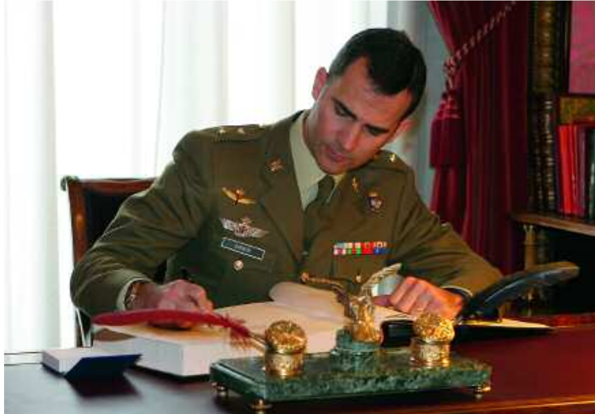
El Príncipe firmó en el Libro de Honor del Cuartel General del Ejército