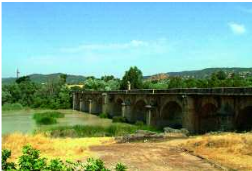
Vista actual del puente de Alcolea

El general Prim se dirigió con sus tropas hacia la costa levantina para recabar apoyos para la sublevación, y el general Serrano, que concentró el grueso del ejército sublevado, puso rumbo a Madrid con el objetivo de derrocar a la reina. Serrano logró reunir para su causa un ejército formado por once batallones de Infantería, tres de Cazadores, uno de Marina, otro de Guardia Civil, dos de Guardia Rural, los regimientos de Caballería "Santiago" y "Villaviciosa", dos escuadrones de Carabineros, y un batallón de Artillería con 28 piezas, doce de ellas cañones Krupp, los más avanzados de la época. El Gobierno de Madrid conoció por telégrafo las intenciones de Serrano, en lo que constituyó la