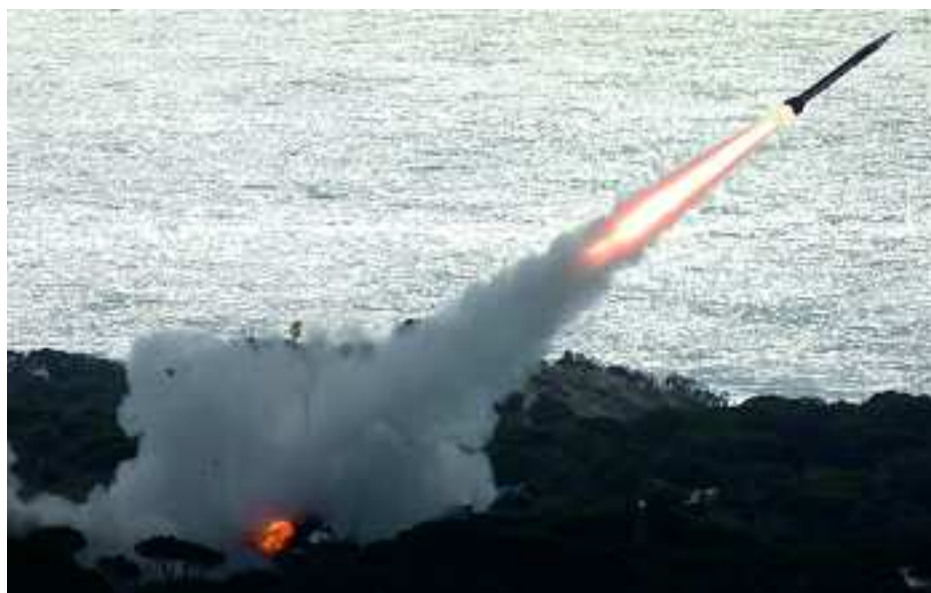
El misil Patriot es el de mayor alcance de los que posee el MAAA