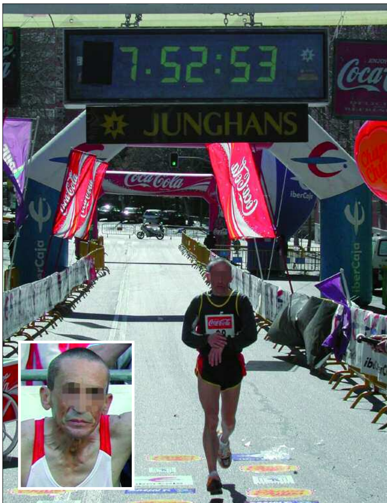
La mejor marca del comandante en 100 km está en un tiempo de 7h 52m y 53s

«Tradicionalmente, la III Bandera participaba en el Maratón Popular de Madrid e íbamos a la carrera formando unidad», asegura. Y ahí fue donde empezó toda su trayectoria deportiva militar. «Me propusieron