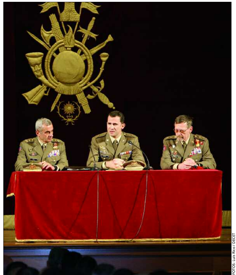
En el salón de actos, el Príncipe habló con los alumnos de los nuevos planes

Una vez en el salón de actos, el JEME quiso reconocer al Príncipe de Asturias, frente a todos los alumnos y profesores, el orgullo que le produce su visita «porque sabemos el interés que tiene por la enseñan-