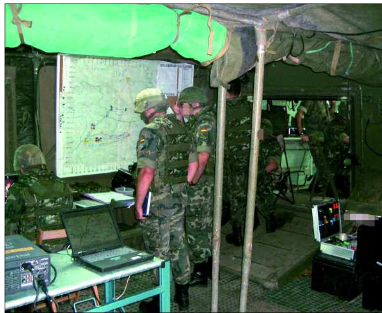
Se llevó a cabo un ejercicio de todos los puestos de mando de la Brigada

En las maniobras tomaron parte los puestos de mando de la BRIMZ XI y de sus unidades subordinadas, así como los puestos de mando de las baterías del Grupo de Artillería de Campaña XI y las secciones de morteros pesados de los batallones de Infantería.