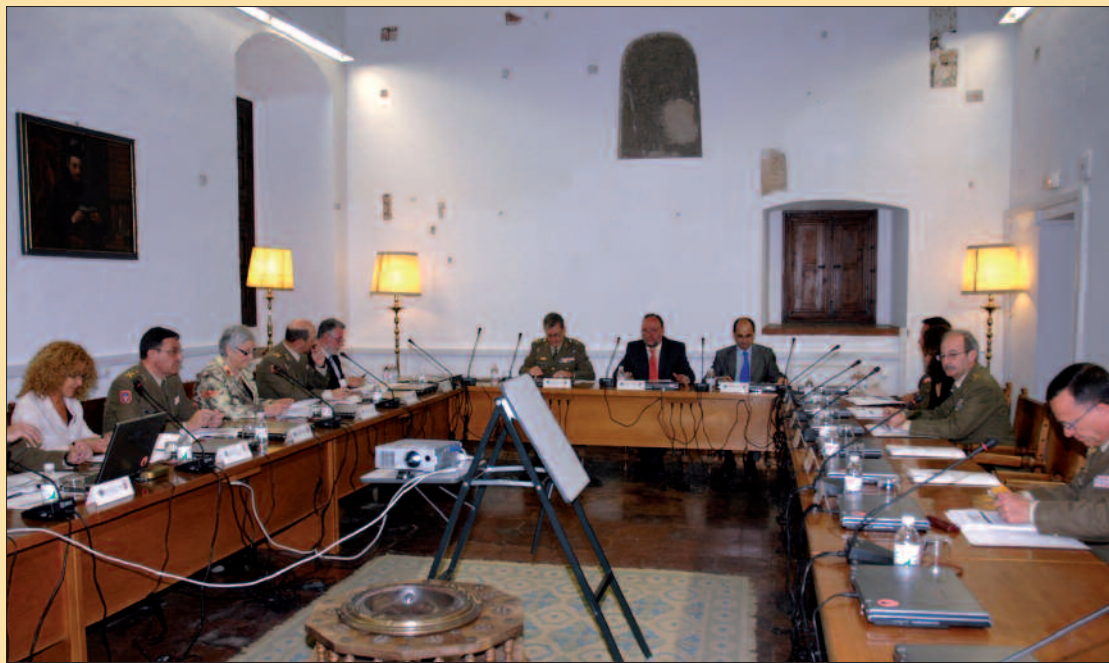
Los miembros de la Comisión Mixta Universidad de Granada-MADOC se reúnen anualmente

Ya en el ámbito interno del Ejército de Tierra, el Consejo del Ciclo de Análisis a Largo Plazo del