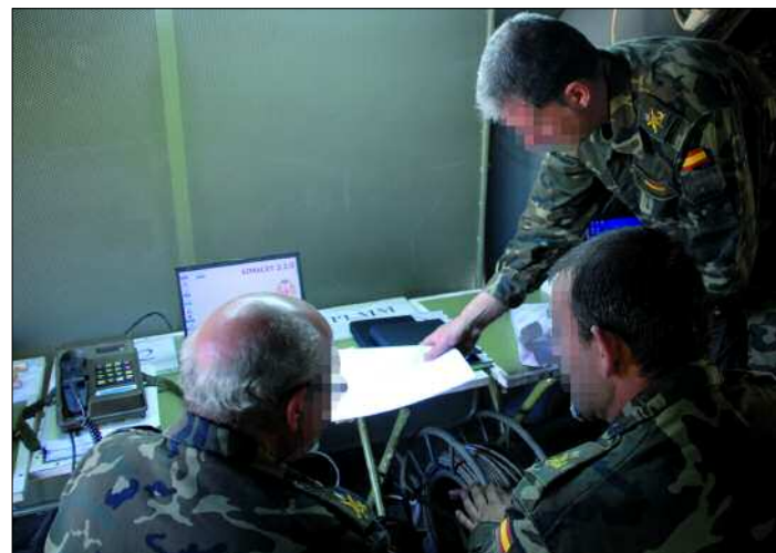
El objetivo del ejercicio era elevar el adiestramiento de la Plana Mayor