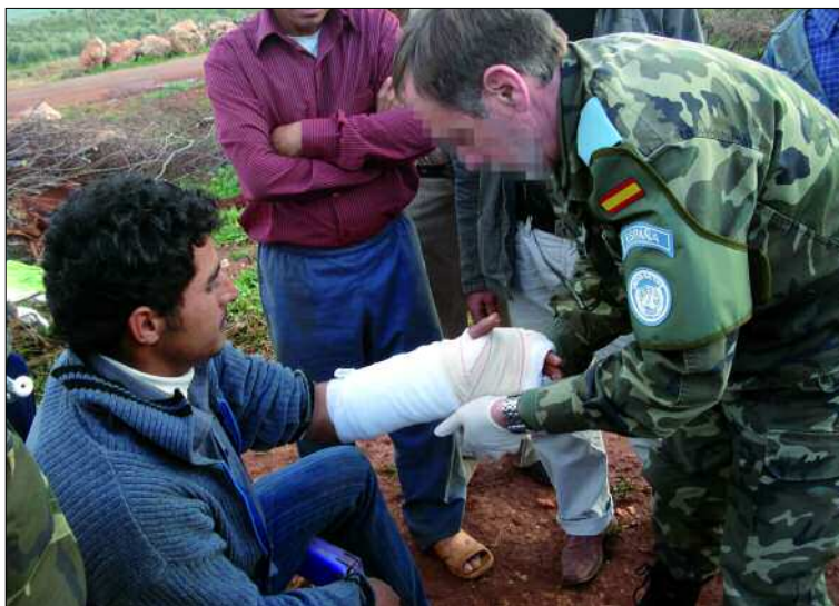
Los médicos de la Brigada han atendido a cerca de 400 libaneses en el último mes

Durante el último mes, los médicos españoles y salvadoreños han prestado atención sanitaria a más de 400 personas de las poblaciones cercanas a la base "Miguel de Cervantes". Destaca, por su especial sensibilidad, una asistencia realizada en un poblado provisional en el que vive un grupo de jornaleros sirios. Se trataba de un niño con parálisis cerebral que tenía que permanecer tumbado continuamente y que padecía una neumonía causada por la