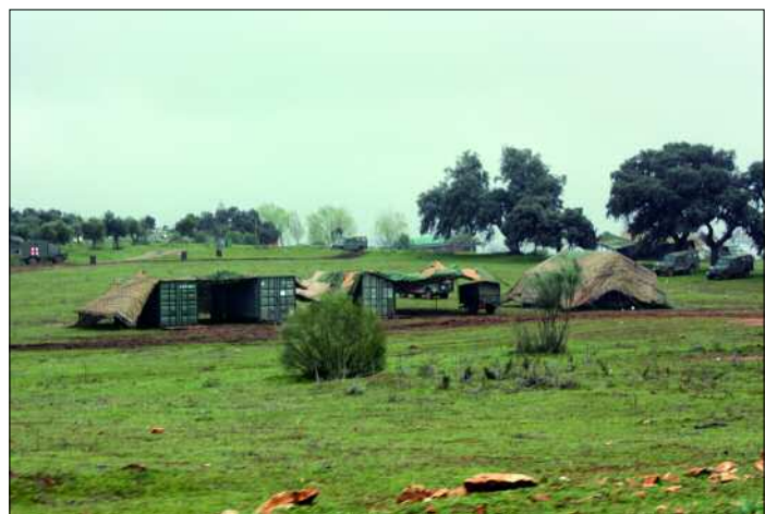
La Unidad de Apoyo Logístico desplegó en "Las Navetas", en Ronda

El ejercicio se ha enmarcado en un escenario imaginario fuera del territorio nacional, en el que se debe desarrollar una operación de apoyo a la evacuación de nacionales en ambiente semi-permisivo y potencialmente hostil. Además de la Plana Mayor y las células de respuesta de las unidades subordinadas, han participado una unidad de apoyo y otra de Transmisiones.