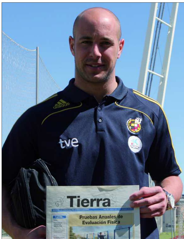
«Hay que seguir con la misma línea de humildad, de respetar al rival»

¡Si tiene que pesar, que me pese toda la vida! ¡Ojalá sigamos ganando competiciones y sigamos teniendo presión! Lógicamente ahora nos toman como un equipo que ha ganado un campeonato importante y nos respetan mucho más. Para nosotros tiene que ser un halago y no un motivo de presión. Sería estúpido por nuestra parte ponernos más presión. Lógicamente tienes