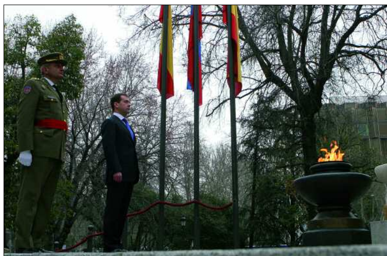
Su Majestad el Rey inauguró, en 1985, la llama eterna bajo el monumento

solicitudes de Estados Unidos, Italia y Rumanía de adherirse al Estado Mayor de la unidad. Igualmente, destacan la intervención en el Parlamento Europeo del teniente general Pitarch, jefe del Eurocuerpo, y la posterior resolución, de 5 de junio de 2008, del propio Parlamento en la que propone la constitución de la unidad como fuerza permanente bajo mando de la Unión Europea.