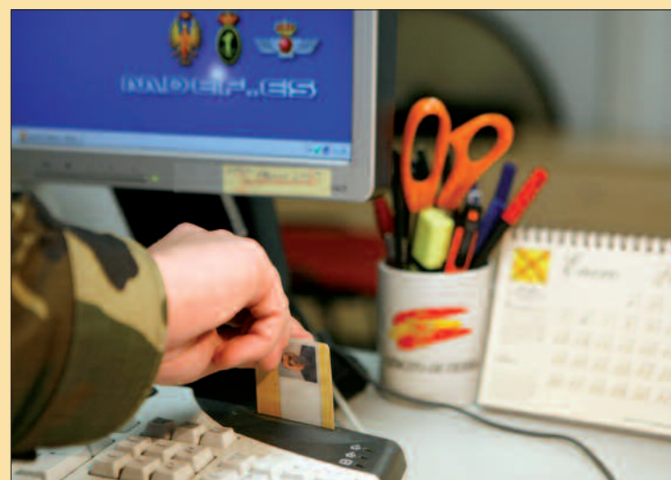
La TEMD permite autenticar la identidad del usuario

La vida útil de la Tarjeta Electrónica del Ministerio de Defensa es de seis años. Dos meses antes del vencimiento de la tarjeta el usuario será informado de la próxima caducidad de la TEMD, y podrá renovarla en cualquier Puesto de Gestión de Tarjetas Electrónicas del Ministerio de Defensa.