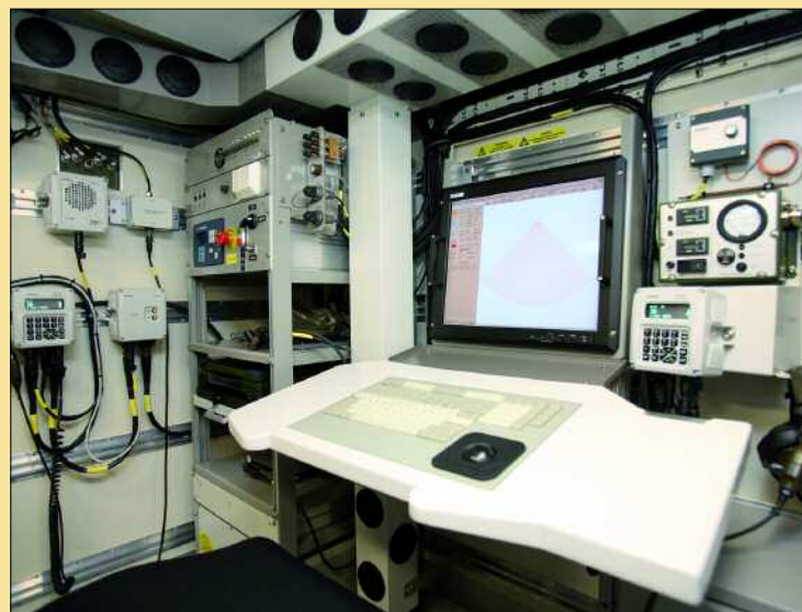
El Arthur se caracteriza por su fácil manejo y la integración de elementos

En cuanto a la integración de elementos, el radar incorpora un