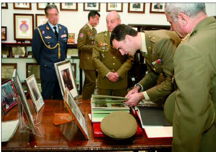
Su Alteza Real pudo ver sus fotos de cadete en la Academia

ro trabajo que aquí se lleva a cabo». Añadió que a partir de 2010 convivirán con el nuevo plan y, sobre todo los de 1º y 2º, van a tener una participación importante a la hora de recibir a los futuros alumnos. Asimismo, les habló de la importancia de los valores y virtudes militares, como el compañerismo, algo muy importante en su día a día. Antes de despedirse, y en un ambiente distendido, don Felipe animó a los presentes a plantearle las cuestiones que tuvieran. En el turno de preguntas, el interés surgió por los cambios que había podido apreciar en la Academia y sus recuerdos de cadete.