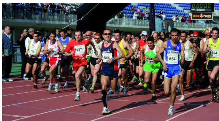
Salida de los corredores en el Centro Aragonés del Deporte de Zaragoza