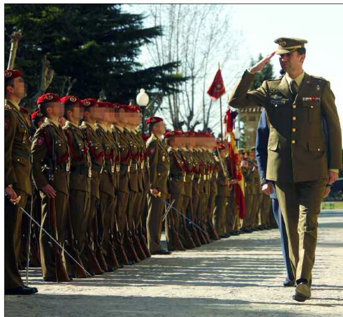
Don Felipe pasa revista a la Compañía de 2º curso