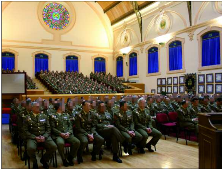
Inauguración del año escolar en la Escuela de Guerra del Ejército de Tierra

La sede principal de la Escuela está ubicada en Madrid, aunque mantiene una Sección Delegada en Zaragoza, y el Departamento de Geodesia y Topografía de la EGET, en el Centro Geográfico del Ejército, en Madrid. Hablar de las actividades formativas del centro es hacerlo de un importante número de cursos de formación, capacitación y especialización, así como de otras actividades informativas, de investigación y de cooperación con otros centros militares de enseñanza y con