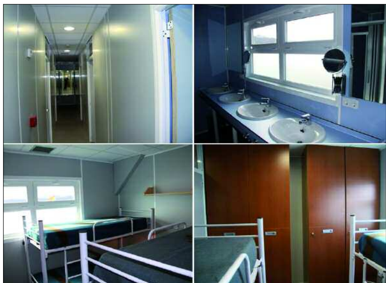
Interior del módulo construido durante la presente Campaña Antártica