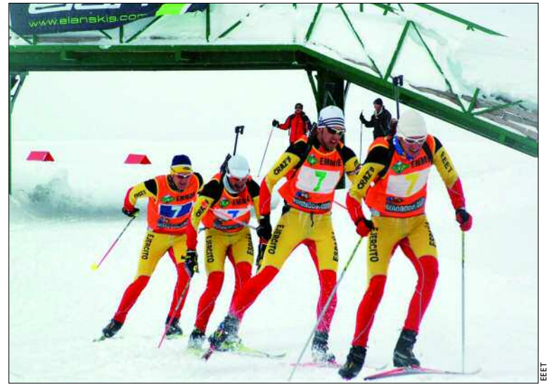
El EEET consiguió el primer puesto en la Carrera de Patrullas

El segundo día, la nieve y el viento dificultaron las carreras, pero el personal de la EMMOE se en-