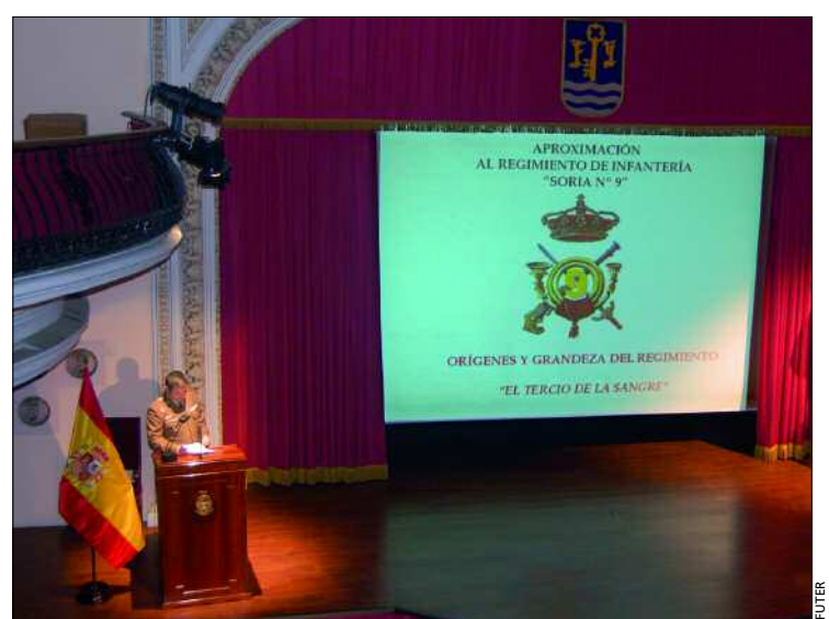
Las conferencias desarrolladas en Sevilla tuvieron una gran afluencia de público

El acto central en la capital hispalense se llevará a cabo el 28 de marzo, y consistirá en una parada militar en la que tomarán parte Escuadra de Gastadores, Banda de Guerra, Bandera y una compañía del RIL, así como una compañía mixta —formada por una sección del Regimiento de Artillería Antiaérea nº 74, una sección del Batallón de Helicópteros de Maniobra IV y otra sección de la Agrupación de Apoyo Logístico nº 21— y la Música de la Segunda SUIGE. En la parada militar podrán formar y volver a besar la Bandera todos los civiles y mi-