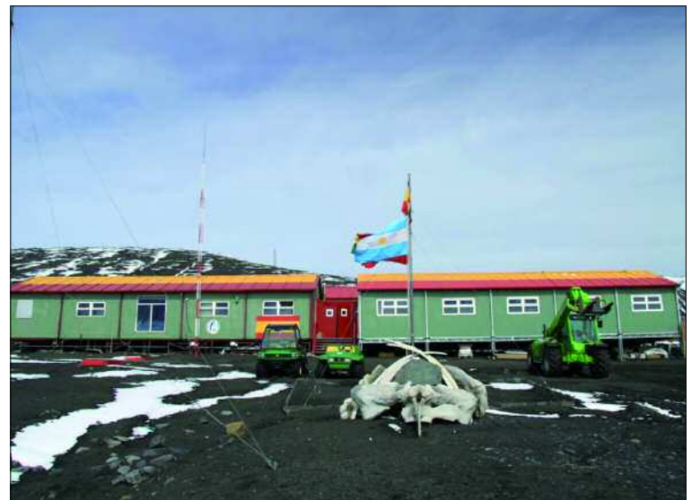
El nuevo módulo (a la derecha) una vez finalizadas las obras de rehabilitación

La remodelación de la base “Gabriel de Castilla” ha sido el proyecto más importante acometido durante la presente campaña. Este trabajo —dirigido por la Coman-