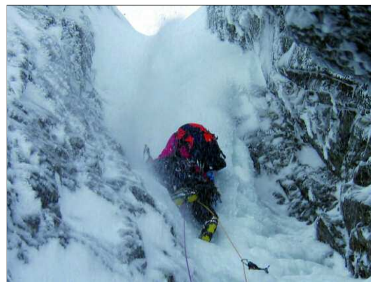
Escalada en hielo del Grupo Militar de Alta Montaña

Durante la expedición van a llevar a cabo diferentes pruebas divididas en tres grupos: comunicaciones externas, internas y pruebas de equipos y accesorios. Para probar las comunicaciones externas a la expedición, y la distribución de la información hacia canales públicos y del Ministerio de Defensa, deberán integrar el campamento base con la Red Privada Virtual de Defensa; establecer conexiones con la intranet de Defensa y configurar una red WIFI de voz y datos para la zona de la expedición; crear una página web para el seguimiento de la expedi-