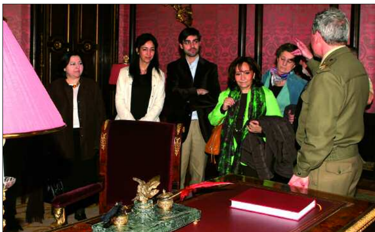
Los visitantes disfrutaron de los bienes históricos y culturales del Palacio