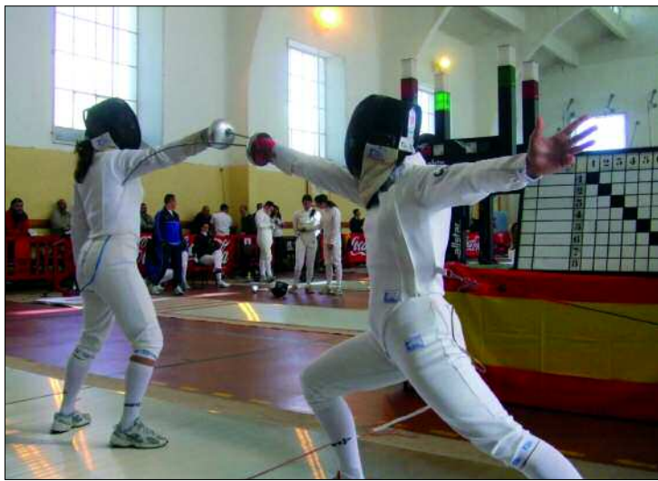
El Ejército de Tierra ha sido el vencedor absoluto de esta competición