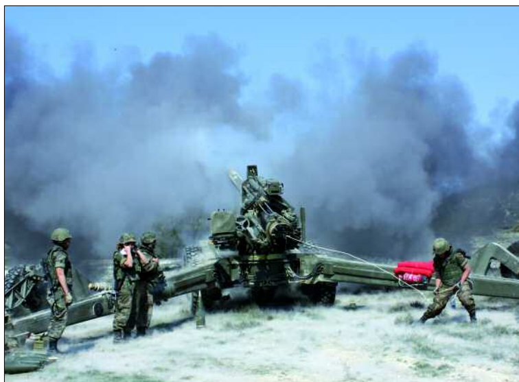
Durante el ejercicio se evaluó la eficacia del SIAC II en el tiro con fuego real

Finalizado el ejercicio, comenzó la fase de post-ejecución —que se extendió hasta el día 27—, en la que se procedió a elaborar el FER (Informe Final del Ejercicio, en inglés) y el informe de lecciones aprendidas.