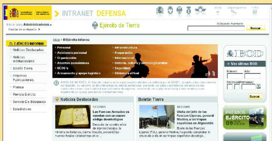
Esta es la nueva imagen de la página del Ejército

de mantenimiento orgánico, el uso de simuladores, y todas aquellas que no requieran el uso de vehículos. Todas estas medidas permitirán al Ejército obtener el máximo rendimiento de los recursos disponibles con el fin de garantizar un adecuado nivel de operatividad de sus unidades.