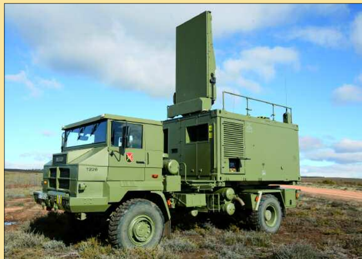
El radar puede clasificar el origen del fuego y el punto de impacto

En definitiva, y en palabras del capitán Cambor, «con este nuevo radar nos ponemos a la misma altura, e incluso a un nivel superior, del resto de países del entorno de la OTAN».