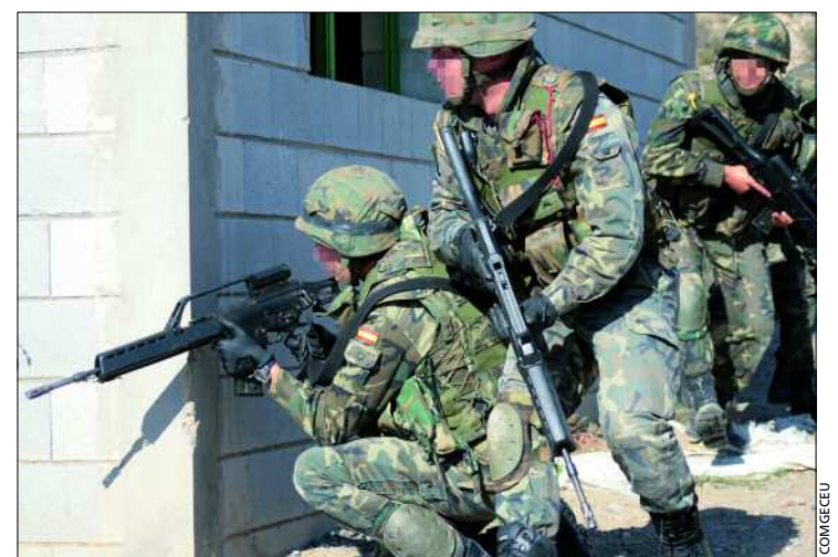
Se llevaron a cabo ejercicios de combate en población

El 15 de marzo a las 10 de la mañana un cañón del Regimiento de Artillería de Campaña nº 20 dio la señal de salida en el Centro Aragonés del Deporte de Zaragoza. Parte del recorrido se llevó a cabo por el Centro de Adiestramiento "San Gregorio", donde los corredores pudieron ver materiales de la Brigada "Castillejos".