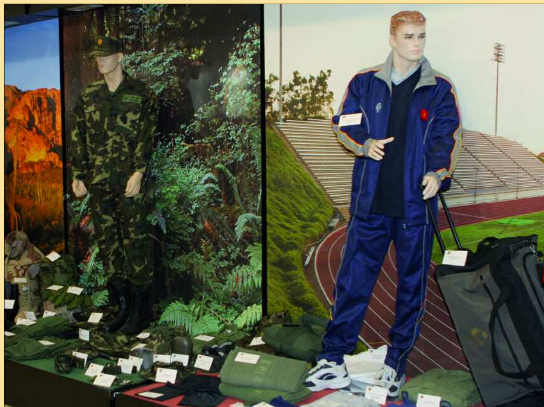
El equipo básico se ha completado y mejorado con nuevas prendas

AÑO XIV • número 170 • 25 de marzo de 2009