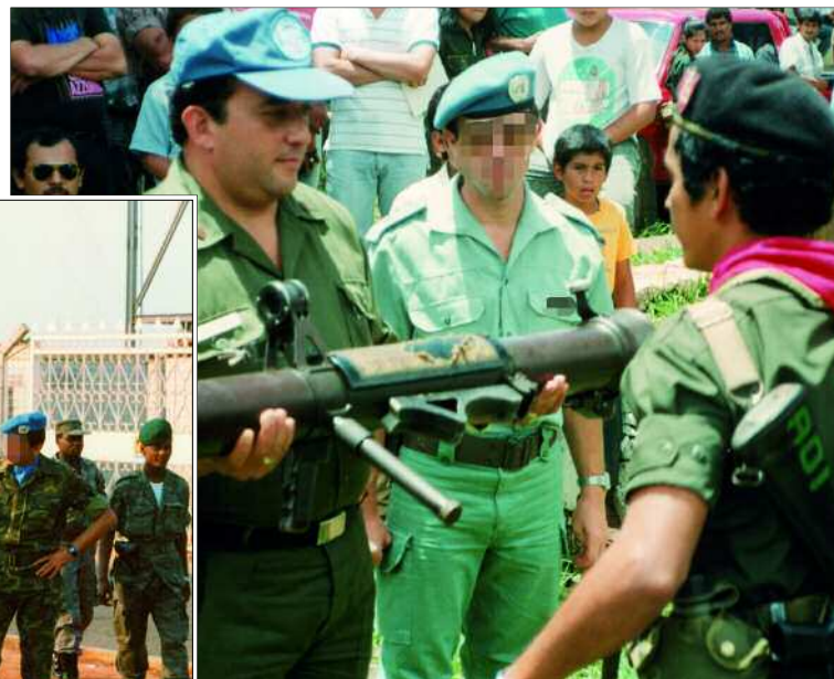
De izda a dcha: miembros de UNAVEM, la primera misión del Ejército en el exterior; entrega de armamento de la guerrilla en ONUSAL; un observador español en la misión de la OSCE en Chechenia