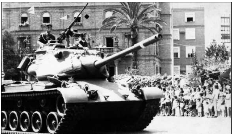
Desfile del RIL "Soria" por las calles de Sevilla en el año 1972

Sevilla, Soria, Toledo y la localidad de Puerto del Rosario, ubicada en la isla de Fuerteventura, son las cuatro ciudades españolas en las que se van a desarrollar los actos