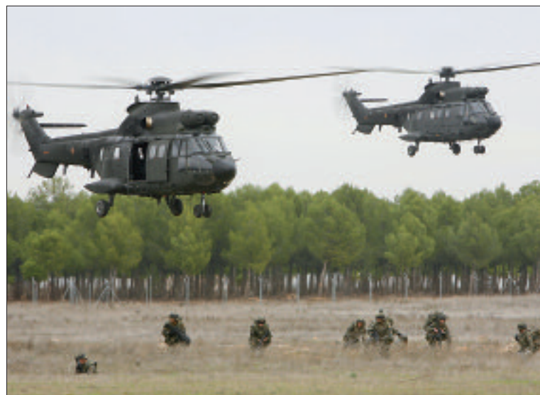
El ejercicio se desarrolló en dos escenarios distintos: Almagro y Toledo

una Unidad de Defensa Antiaérea con baterías de misiles antiaéreos NASAMS y un Centro de Operaciones de Artillería Antiaérea Semiautomático (COAAS) Medio, del Regimiento de Artillería Antiaérea (RAAA) nº 73, y un pelotón Mistral con un COAAS Ligero del RAAA nº 71; un Batallón de Transmisiones, sobre la base del Batallón de Transmisiones de las