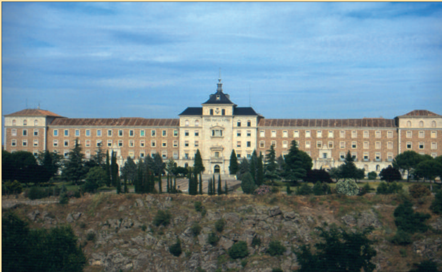
En la Academia de Infantería de Toledo se celebrarán los cursos de esa especialidad fundamental

consecuencias legales de dar positivo en una analítica de droga; y se incluye una reseña de las actividades realizadas en el Laboratorio de Referencia de Drogas de las Fuerzas Armadas, dirigido por un comandante farmacéutico de los Cuerpos Comunes. Págs. 7 a 10