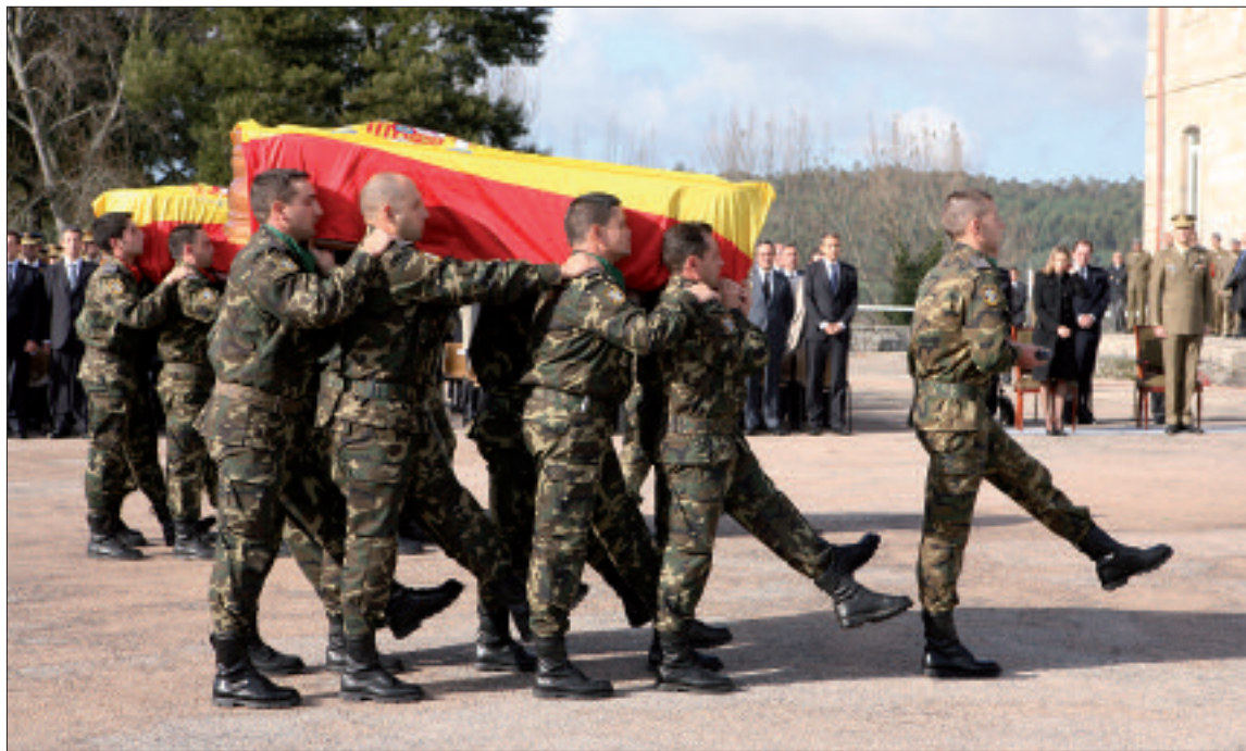
El funeral por los dos militares tuvo lugar en la base "General Morillo", en Figueirido (Pontevedra)

y 2 vehículos estadounidenses — se encontraba a 80 kilómetros de Herat. Una furgoneta cargada de explosivos, conducida por un terrorista suicida, impactó contra el último BMR, en el que viajaban los españoles.