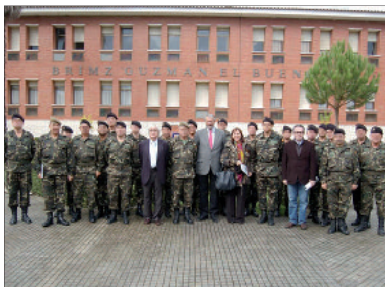
Cuatro miembros de la comisión de Defensa del Senado visitaron la BRIMZ X

por el teniente coronel Blasco, ofrecieron un concierto en el Teatro Juan Bravo de Segovia, junto con la Coral San Agustín y el Coro Municipal de Pinto (Madrid). El concierto, organizado por la asociación cultural Biblioteca de Ciencia y Artillería, sirvió también para conmemorar el bicentenario de la Guerra de la Independencia. En él se interpretaron composiciones musicales de la época, tales como himnos, canciones patrióticas, marchas, coplas, sinfonías y canciones populares.