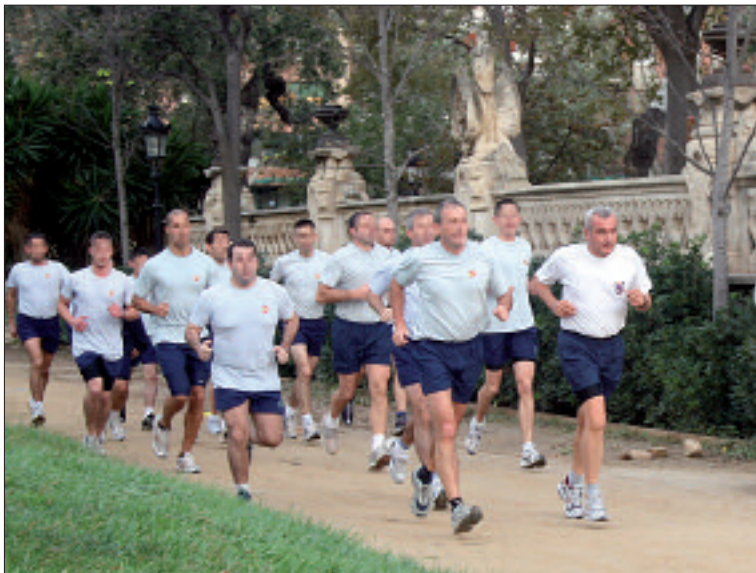
El general de ejército Coll hizo deporte con algunos miembros de la IGE

Días más tarde, el 10, el JEME visitó las dependencias del Mando de Apoyo Logístico del Ejército (MALE), emplazadas en el Palacio de Buenavista, sede del Cuartel General del Ejército, en Madrid. La vi-