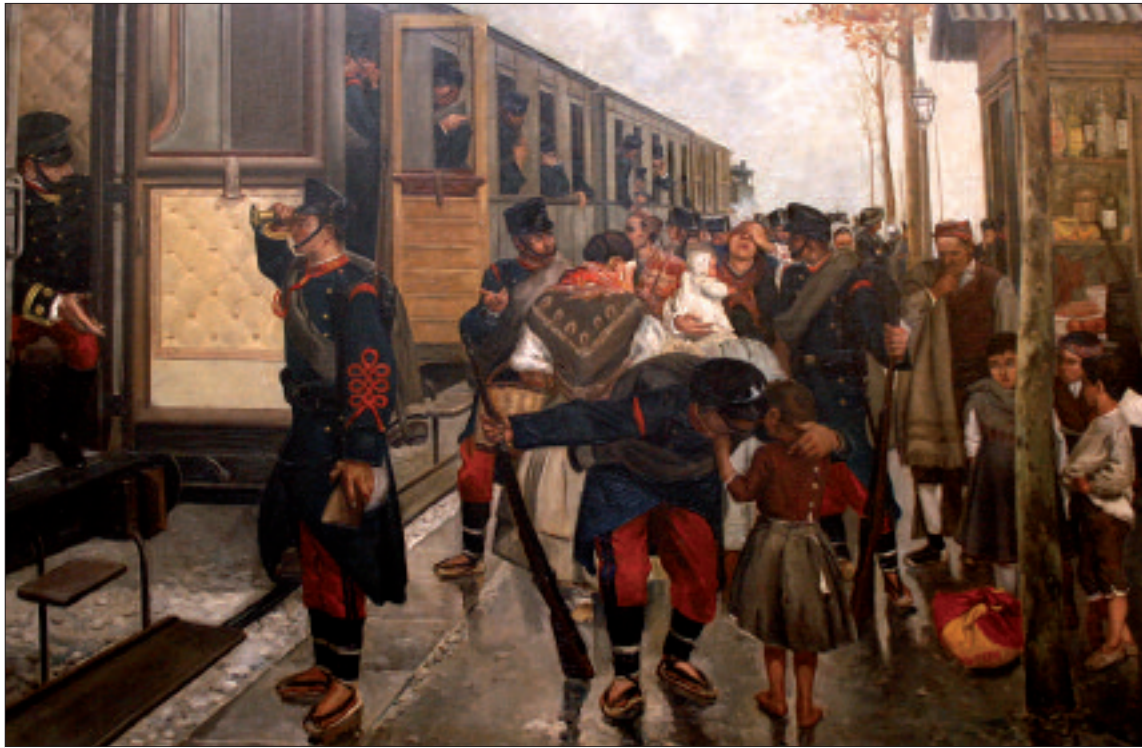
La bandera de mochila, en la parte inferior derecha del cuadro, se utilizaba para proteger las pertenencias del soldado

Esta enseña tan particular, conocida como bandera de mochila o de percha, o pañuelo cubre-percha, tenía distintos usos. En primer lugar, le servía al soldado para cubrir sus pertenencias, protegiéndolas del polvo, en una época en la que aún no existían las taquillas. De este modo, se tapaban los objetos personales colgados en una percha o situados sobre alguna repisa. En segundo lugar, el militar la podía llevar por fuera de la mochila, atada con unos cordones, para señalar su posición en campaña e indicar a sus compañeros que se trataba de un amigo y no de un enemigo.