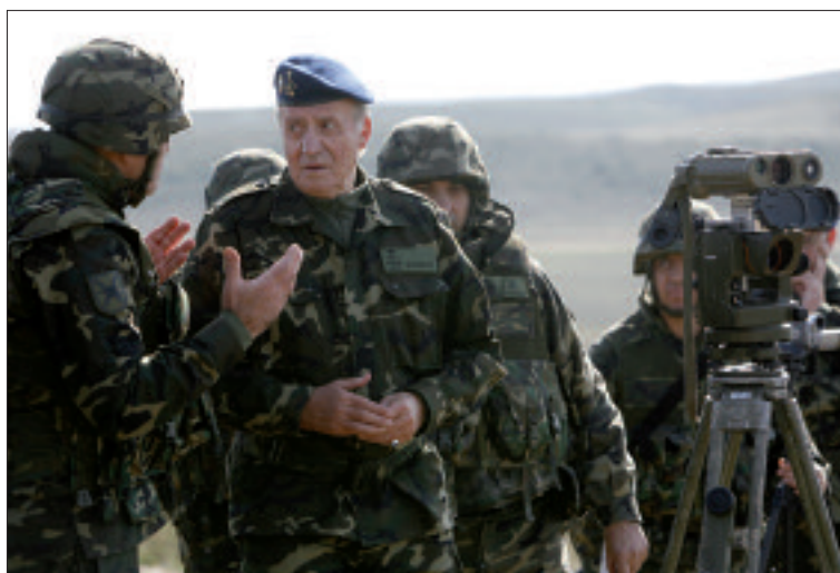
El Monarca presenció en el campo seis ejercicios con fuego real

Don Juan Carlos de Borbón se trasladó, el día 4 de noviembre, al Centro de Adiestramiento “San Gregorio”, en Zaragoza, para presenciar un ejercicio del Mando de Artillería de Campaña. Acompañado por el Jefe de Estado Mayor del Ejército y el jefe de la Fuerza Terrestre. El Monarca asistió, en primer lugar, a una breve exposición sobre la estructura y las misiones del Mando, a continuación, comprobó las capacidades de las unidades en seis ejercicios con fuego real y, por último, fue informado, en una exposición estática, de las características del Sistema Integrado de Vigilancia Aérea y del prototipo del Sistema Integrado de Artillería de Campaña II. Pág. 3