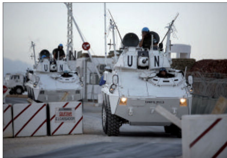
Los escuadrones del Grupo Táctico realizan patrullas diurnas y nocturnas