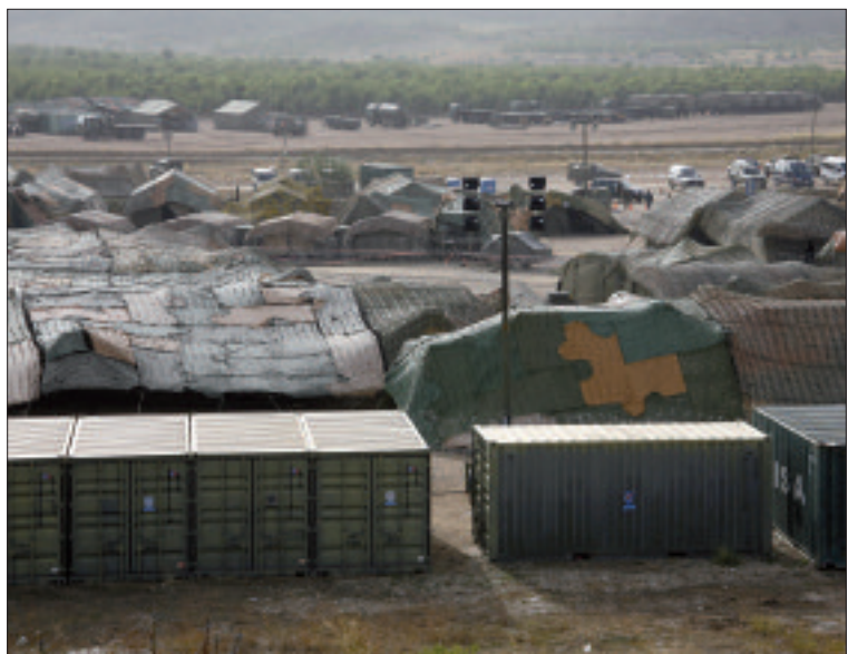
Marco A. Romero / DECT

En definitiva, «este cuartel general ha demostrado la plena interoperabilidad de sus capacidades y procedimientos con los de OTAN, destacando su flexibilidad para acomodarse rápidamente a los nuevos sistemas de última generación de la OTAN, lo que conlleva el prestigio de España en los sistemas de mando y control en el mundo», concluye el general Cardona.