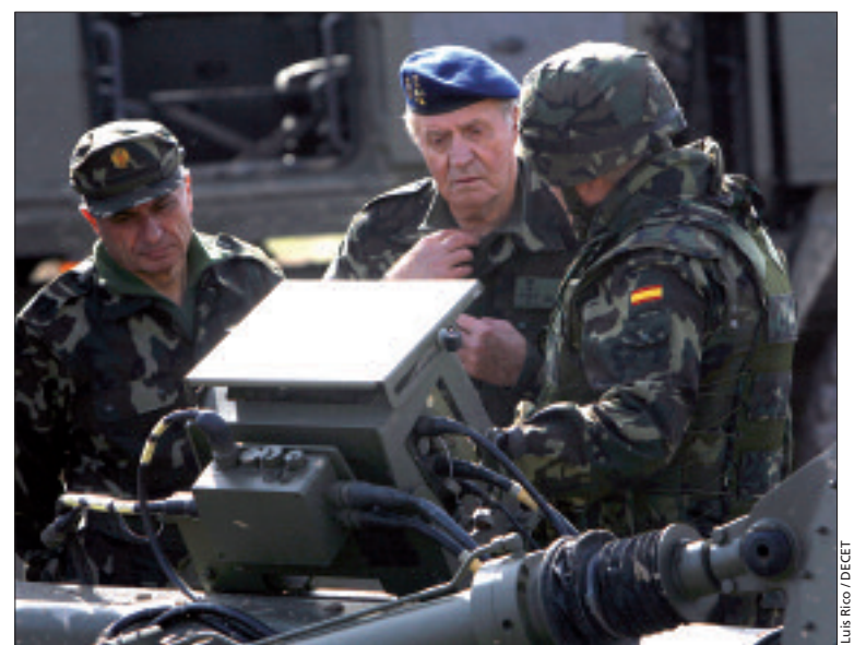
Don Juan Carlos se interesó por las características del SIAC II

En el quinto ejercicio quedó patente la potencia de fuego del lanzacohetes Teruel y en el sexto se mostraron las capacidades de las unidades de Artillería de Cam-