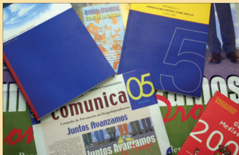
En las unidades se ofrece información clara y eficaz sobre los efectos negativos de las drogas

Las acciones que se contemplan en el Plan se dividen en coordinación, prevención, intervención, cooperación —colaboraciones con las administraciones públicas, a través de las Con-