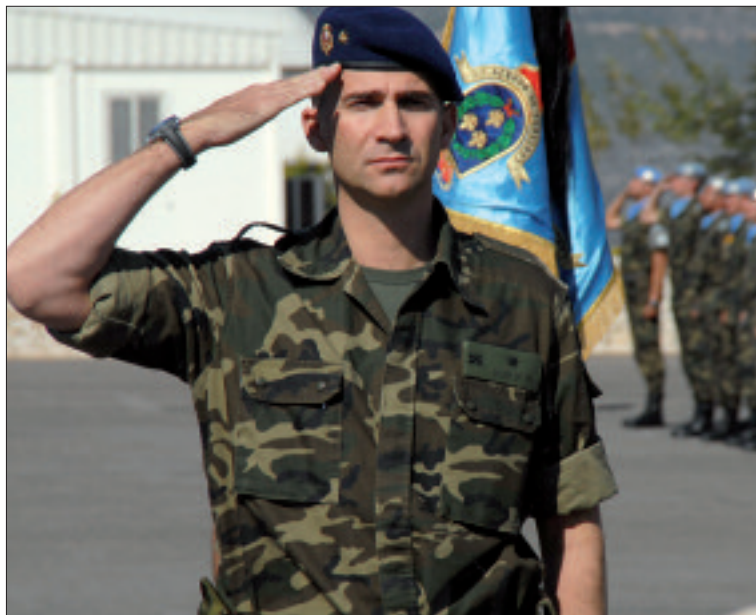
Durante su primera visita a las tropas destacadas en el Líbano, el Príncipe comprobó la excelente labor desarrollada en la zona por el contingente español