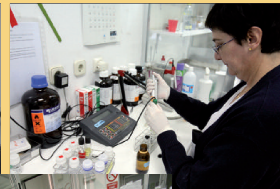
En el Laboratorio de Referencia de Drogas trabajan a diario siete técnicos