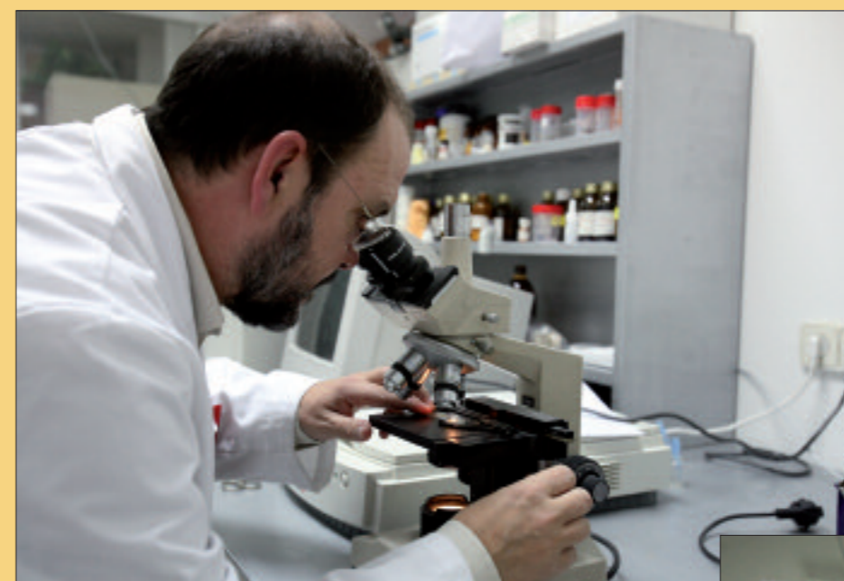
Una muestra microscópica puede determinar la presencia de estupefacientes

ran acreditaciones especiales de seguridad. Igualmente, puede significar la exclusión para la realización de determinados cursos para los que se requiere la superación de este tipo de pruebas (conductores, seguridad, etc).