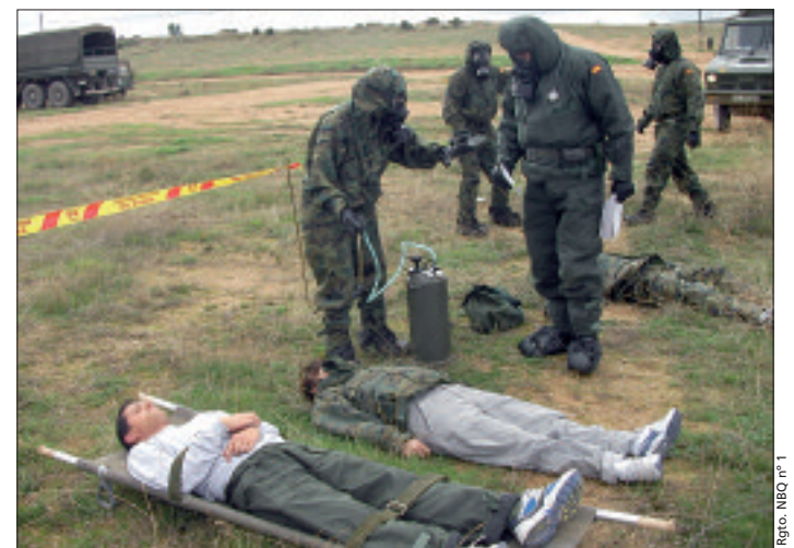
Las unidades NBQ atienden a supuestos heridos contaminados

sonal. Un retraso por fallo mecánico en el Galicia hizo que los horarios variasen y fuera imposible hacer el transporte por vía férrea. De este tipo de imprevistos se encarga la Sección de Movimientos de la Dirección de Transportes, que lo organizó todo para ir hasta Zaragoza en autobuses. A esto hay que añadir la labor del Regimiento de Ferrocarriles nº13, que se encargó del transporte de vehículos y materiales desde Tarragona hasta el CENAD "San Gregorio".