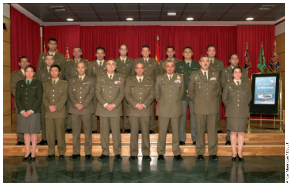
Foto de familia con los componentes de la Campaña Antártica 2008-09

Asimismo, el jefe de la División de Operaciones afirmó que se trata de la misión más antigua de todas en las que está presente nuestro país, ya que se remonta al año 1988, y que cada año los resultados son más satisfactorios. «Ahora se deben finalizar los trabajos de remodelación de la base —proyecto cofinanciado con el Ministerio de Ciencia e Innovación— que comenzaron