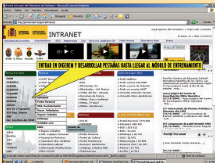
El acceso al Módulo se realiza desde el portal de la intranet de Defensa

Se asigna aleatoriamente un modelo de examen con las cinco pruebas a realizar: gramática y vo-