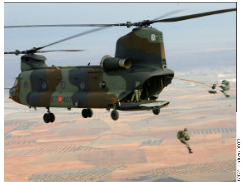
Paracaidistas de la II Bandera se lanzan desde un Chinook de las FAMET

El jefe de las FAMET fue el director del ejercicio, desarrollado en Almagro y Toledo