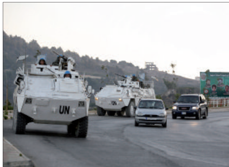
Las patrullas realizadas por los militares españoles se acercan ya a las 4.000

Esta valoración la hace extensiva a la experiencia vivida dentro de la propia unidad: «Son muchísimas horas de trabajo, codo con codo, que terminan por hacer que cada sección funcione como una maquinaria de relojería. Aquí se hace piña y todo el mundo sabe perfectamente las tareas que tiene que desempeñar. El compañerismo ha estado al máximo nivel desde el primer día».