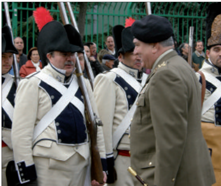
El general Mollá saludó al grupo de recreadores del Regimiento "Jaén"

miento de unidades, desde entidad pelotón hasta batería, y otra en colaboración con el Ejército del Aire. La primera se desarrolló en el destacamento de Cabo Pinar, e incluyó un reconocimiento topográfico nocturno y una marcha al pico del Atalaya. Para la colaboración aérea, la batería se trasladó al acuartelamiento del Escuadrón de Vigilancia Aérea 7. Sin embargo, tras realizar el reconocimiento y desplegar los puestos de tiro, no se pudo efectuar el ejercicio por escasa visibilidad.