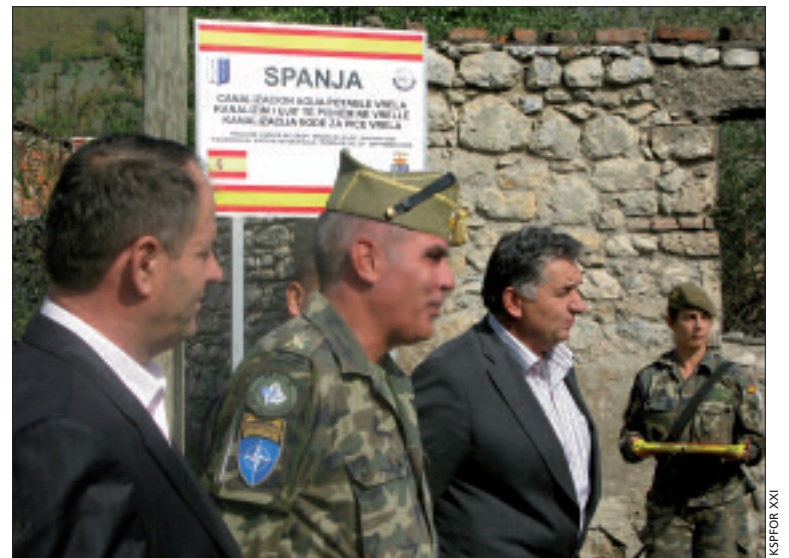
Inauguración de las canalizaciones de agua en Kosovo

turno del PRT español de la Fuerza Española XXI, que continuará con los trabajos de reconstrucción, ayuda humanitaria y colaboración con la acción del Gobierno afgano — mediante el apoyo a las autoridades, Policía y Ejército del país —. Los agradecimientos a la labor que España desarrolla son continuos por parte de las autoridades y organizaciones, así como de la población civil.