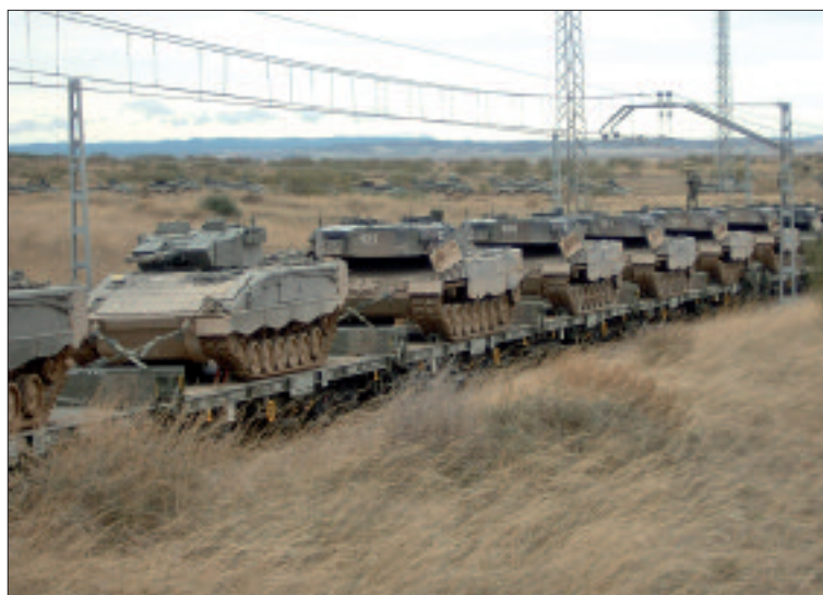
Los Leopard, recientemente incorporados a la COMGECEU, también participaron

El 17 de octubre, cerca de 1.550 militares iniciaron el viaje desde Ceuta hasta Zaragoza. Para ello, desde la Dirección de Transportes planea-