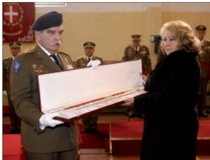
La viuda del teniente general Álvarez del Manzano recibió el premio

La propuesta de otorgar el premio al teniente general Álvarez del Manzano —jefe del Mando de Operaciones del Estado Mayor de la Defensa entre febrero de 2006 y febrero de 2008— se realizó meses antes de su fallecimiento, aca-