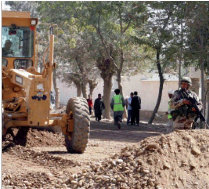
Ya se han iniciado las obras de asfaltado de las calles de Qala-I-Naw

Los trabajos de asfaltado se iniciaron a finales del mes de oc-