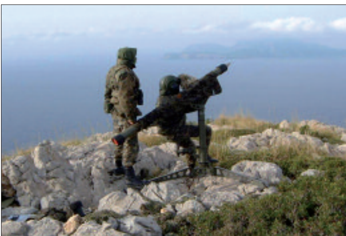
En el ejercicio se evaluó la operatividad del misil antiaéreo Mistral