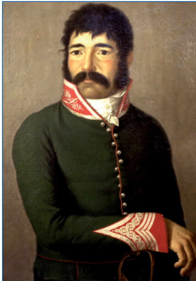
Juan Martín Díez, El Empecinado , se distinguió por su lucha contra los franceses, convirtiéndose en uno de los mayores héroes de la Guerra de la Independencia.

Pero el mayor logro de las partidas consistió en su capacidad pa-