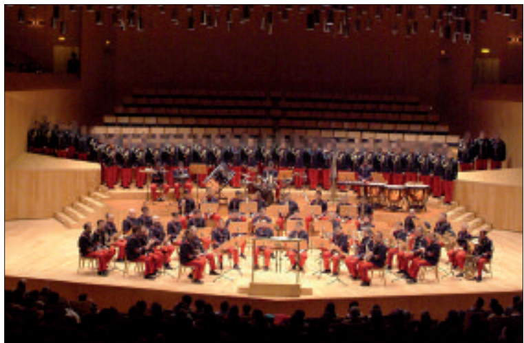
La Unidad de Música de la AGM participa en numerosos actos cívico-militares

El acto concluyó con la inauguración de una placa conmemorativa con los nombres de los premiados de anteriores ediciones.