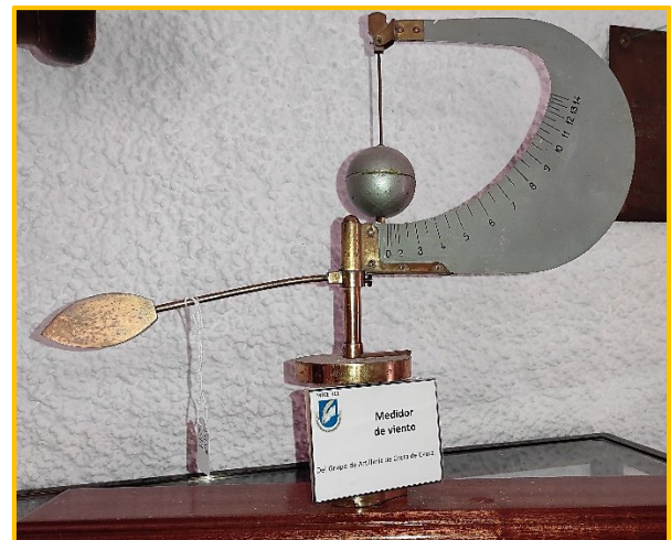
Anemómetro, actualmente ubicado en el Museo del Desnarigado.