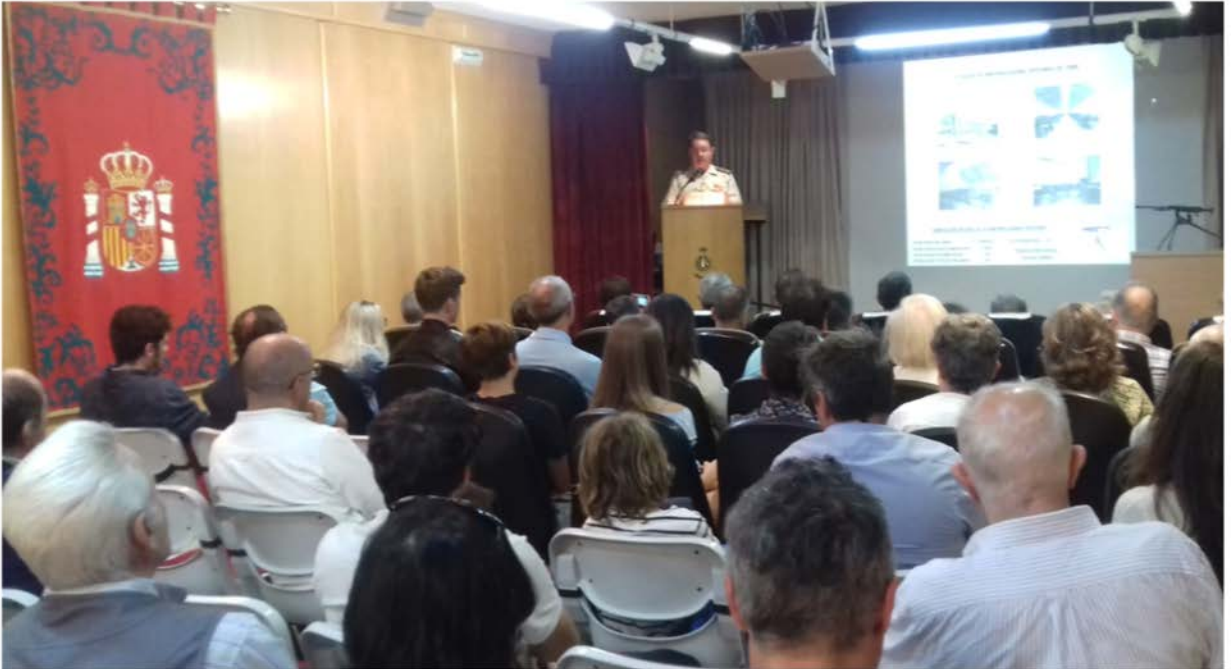
Conferencia impartida por el General Freire, familiar de Dacio Trapote