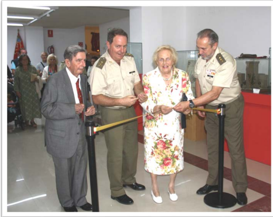
Corte de la cinta inaugural