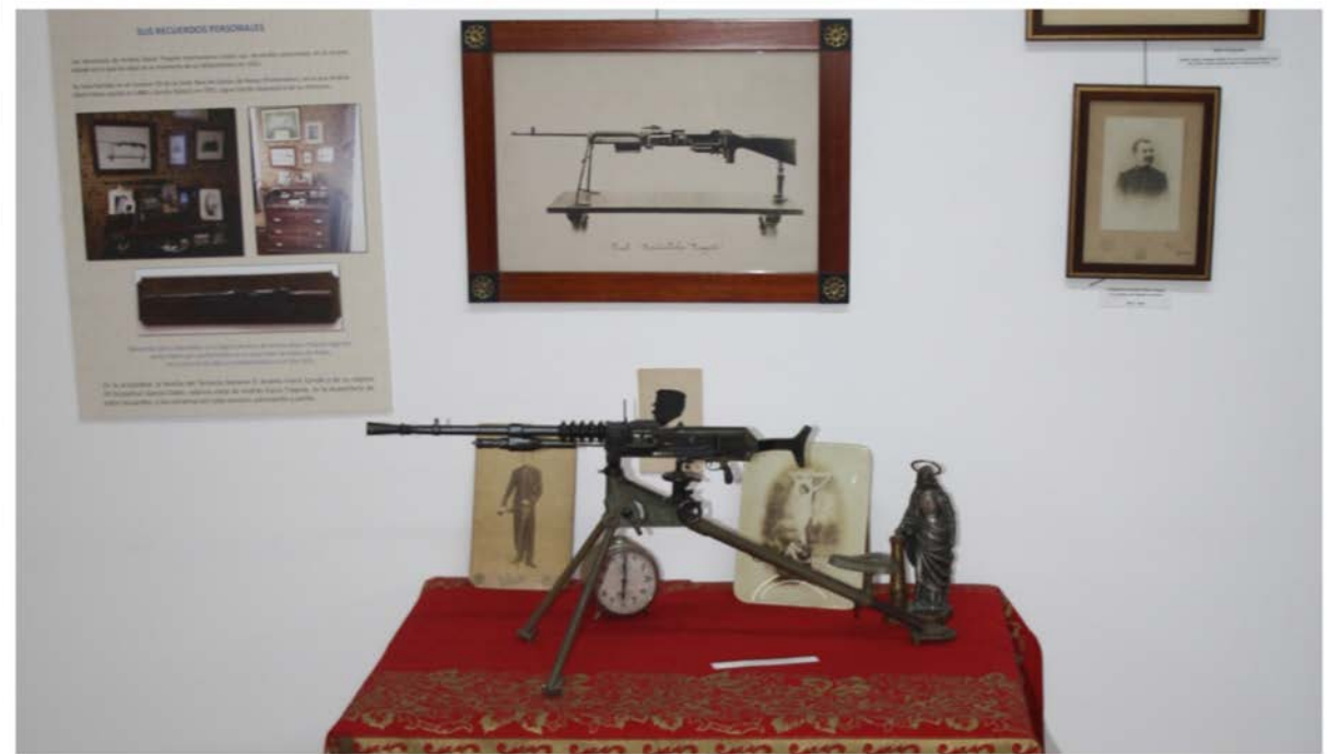
Maqueta de arma diseñada por Dacio Trapote