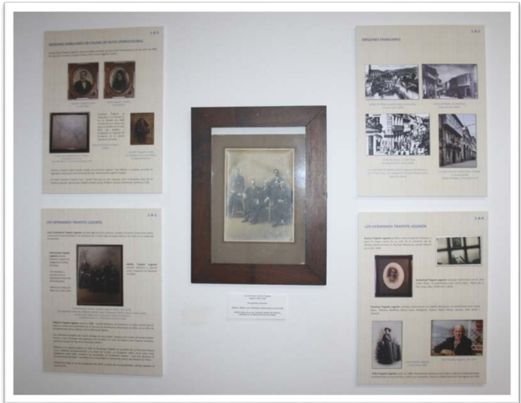
Vista parcial de los fondos de la exposición