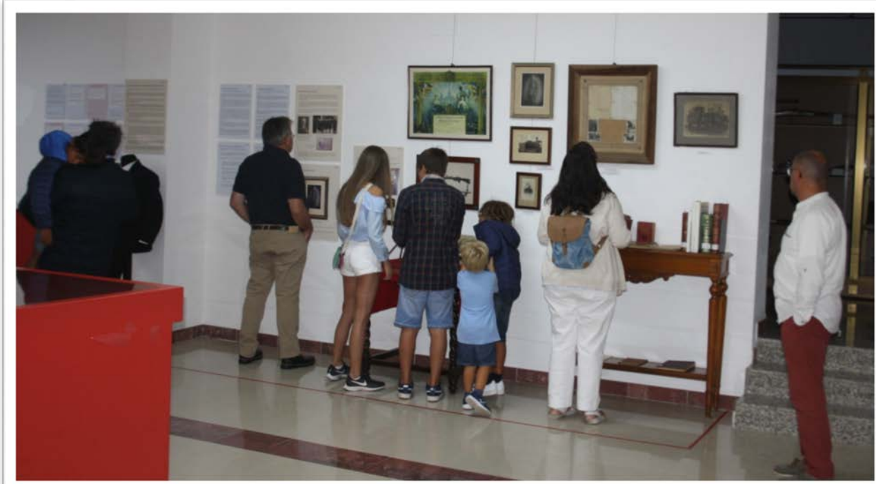
Vista parcial de la exposición y público asistente