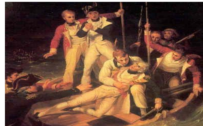
Copia de “Horacio Nelson herido” de Richard Westall (Museo Histórico Militar de Almeyda)