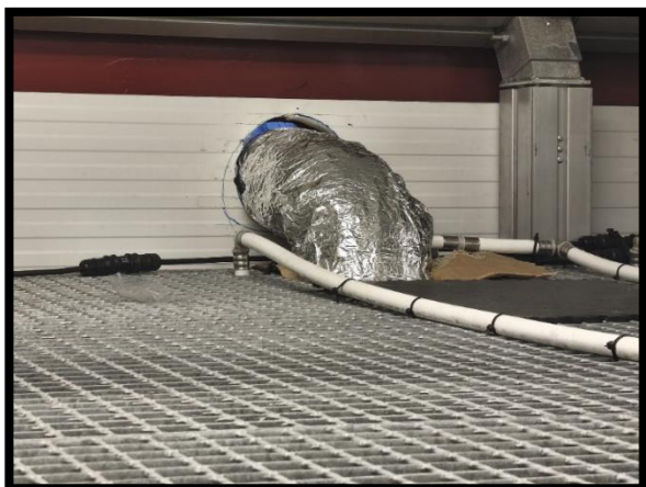
Salida del nuevo módulo científico de la chimenea provisional

El personal del MING continuó con la instalación de los pulsadores del sistema contra incendios. Prosiguieron los trabajos de climatización mediante el sellado de plenum de rejillas y difusores. Se instaló una chimenea provisional para la caldera del sistema de climatización y en caso de no poder adquirirse e instalarse la definitiva durante la presente campaña, la provisional podrá emplearse de forma supervisada hasta su sustitución en la siguiente anualidad.