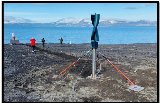
Estado final del aerogenerador