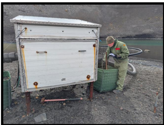
Fidel estudiando cómo hacer una mejora a la caseta de la bomba del Lago Zapatilla

Fidel y Antonio prestaron apoyo durante la mañana al proyecto PERMATHERMAL y, por la tarde, al proyecto VIVO – IGN. Realizaron la limpieza de los filtros, procedieron al llenado de los depósitos y efectuaron el almacenamiento, debidamente embalado y protegido, de un aerogenerador de 3000 W. Fabricaron una caja de protección aislante para el grifo de la manguera utilizada en el enjuague con agua dulce de los trajes de supervivencia en frío extremo tipo Viking. Se desplazaron a la caseta de la bomba del Lago Zapatilla para efectuar un reconocimiento y llevar a cabo trabajos de mejora.