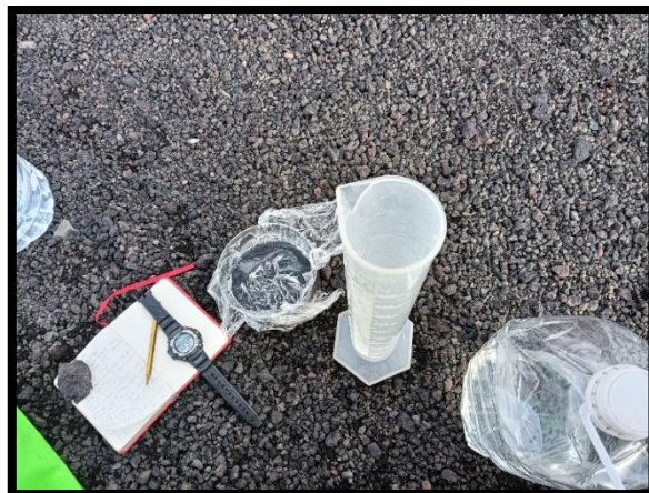
Medida de la infiltración de agua en las distintas estaciones PT en la zona de estudio en isla Decepción