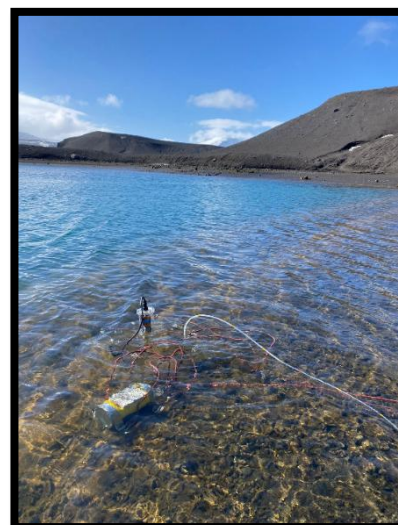
Camara en Bahía Teléfono con marea baja