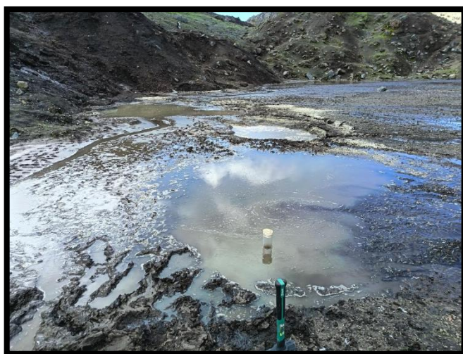
Trabajos para la toma de muestra con un core en una zona de sedimento ornitogénico

Yuesong Gao y Luis visitaron Morro Baily, la mayor colonia reproductiva de pingüino barbijo en la isla Decepción. Se extrajeron tres núcleos de sedimento ornitogénico a lo largo de un gradiente altitudinal en el canal de deshielo del flanco occidental de la colonia. El núcleo (core) de mayor longitud alcanzó aproximadamente 40 cm y el menor unos 8 cm. Estos testigos permitirán estudiar la historia de ocupación del enclave y su posible relación con la dinámica glaciar y la actividad volcánica.