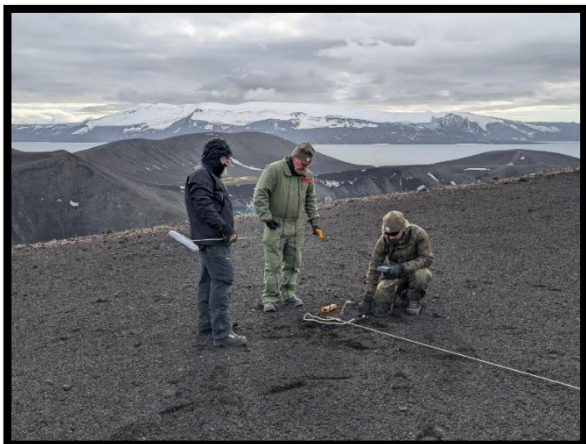
Toma de datos de espesor de la capa activa en el CALM-S "Crater Lake", y otros datos auxiliares en cada uno de los 121 nodos de la malla gracias a la colaboración de la dotación de la BAE "GdC"

Con estas actividades se completan los objetivos más importantes de la serie temporal PERMATHERMAL en la isla Decepción. En los próximos días se realizarán tareas secundarias y complementarias.