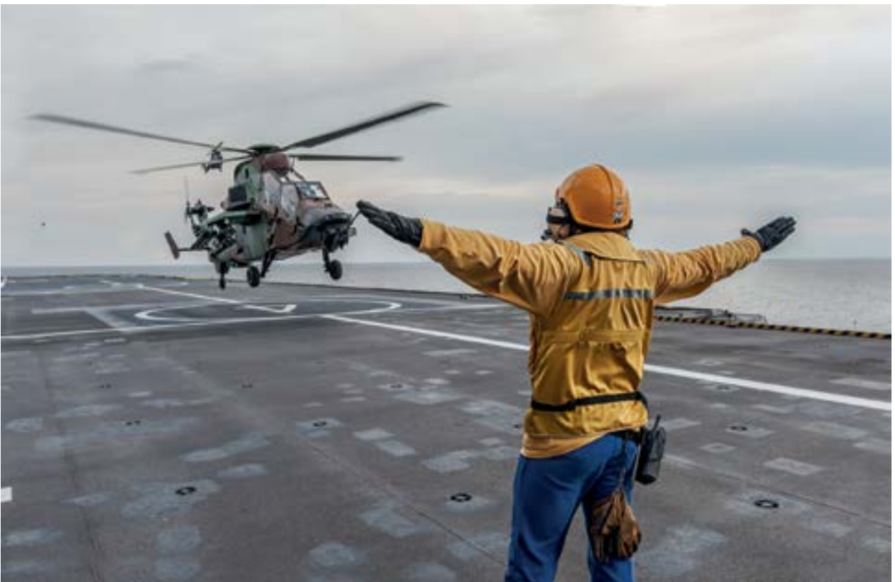
Las interoperabilidad de los helicópteros españoles con barcos franceses de la serie Dixmude