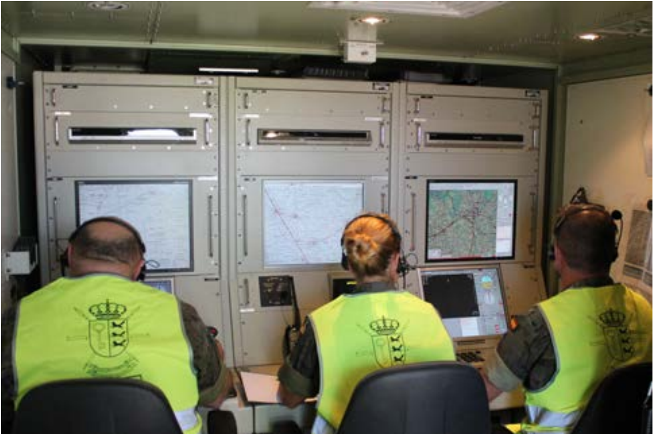
El personal de la Unidad de Vuelo, en plena actividad

—es decir, los pilotos— y operadores de carga útil, que son los que manejaban la cámara de la aeronave y analizaban las imágenes obtenidas. Por otro lado, se ha contado también con una Unidad de Tierra, formada por especialistas en mecánica y electrónica que mantenían el sistema en buen estado y perfectamente operativo. Por último, un reducido grupo de personas se encargaba de las Operaciones. Estas componían el equivalente a un puesto de mando —ubicado en el aeródromo civil de Pajares de los Oteros—, desde el cual se dirigía la misión y se coordinaban las acciones con el CAM. La aeronave, un RPAS Searcher MK III J, detectaba posibles pun-