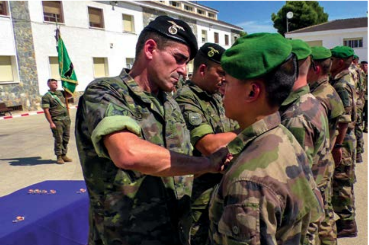
El último día se llevó a cabo la entrega de rokiskis

Comandante Bellat Jefe del contingente francés