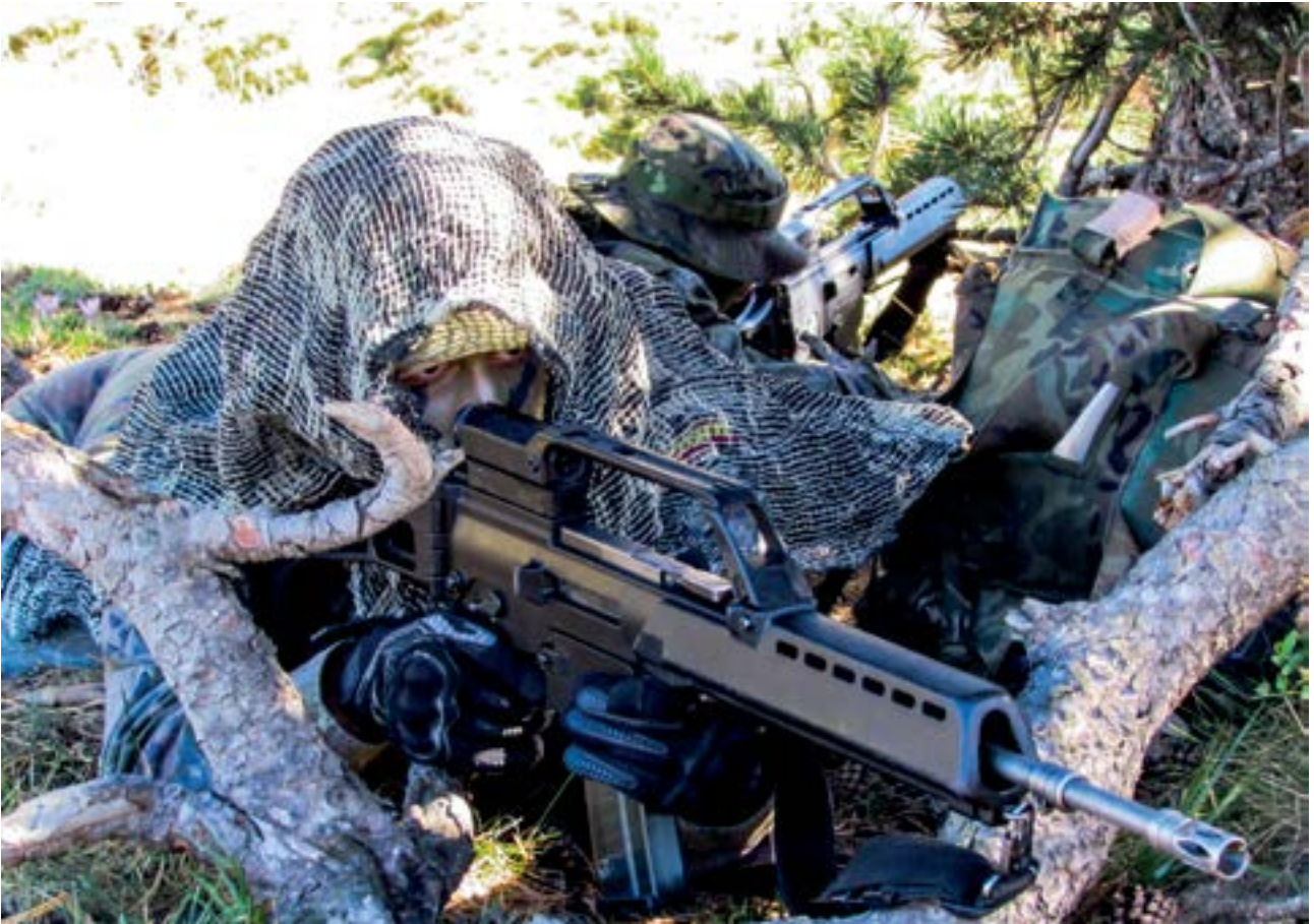
Las damas y caballeros alumnos practicaron técnicas de enmascaramiento y ocultación

ferentes localizaciones de los alrededores de la Academia.