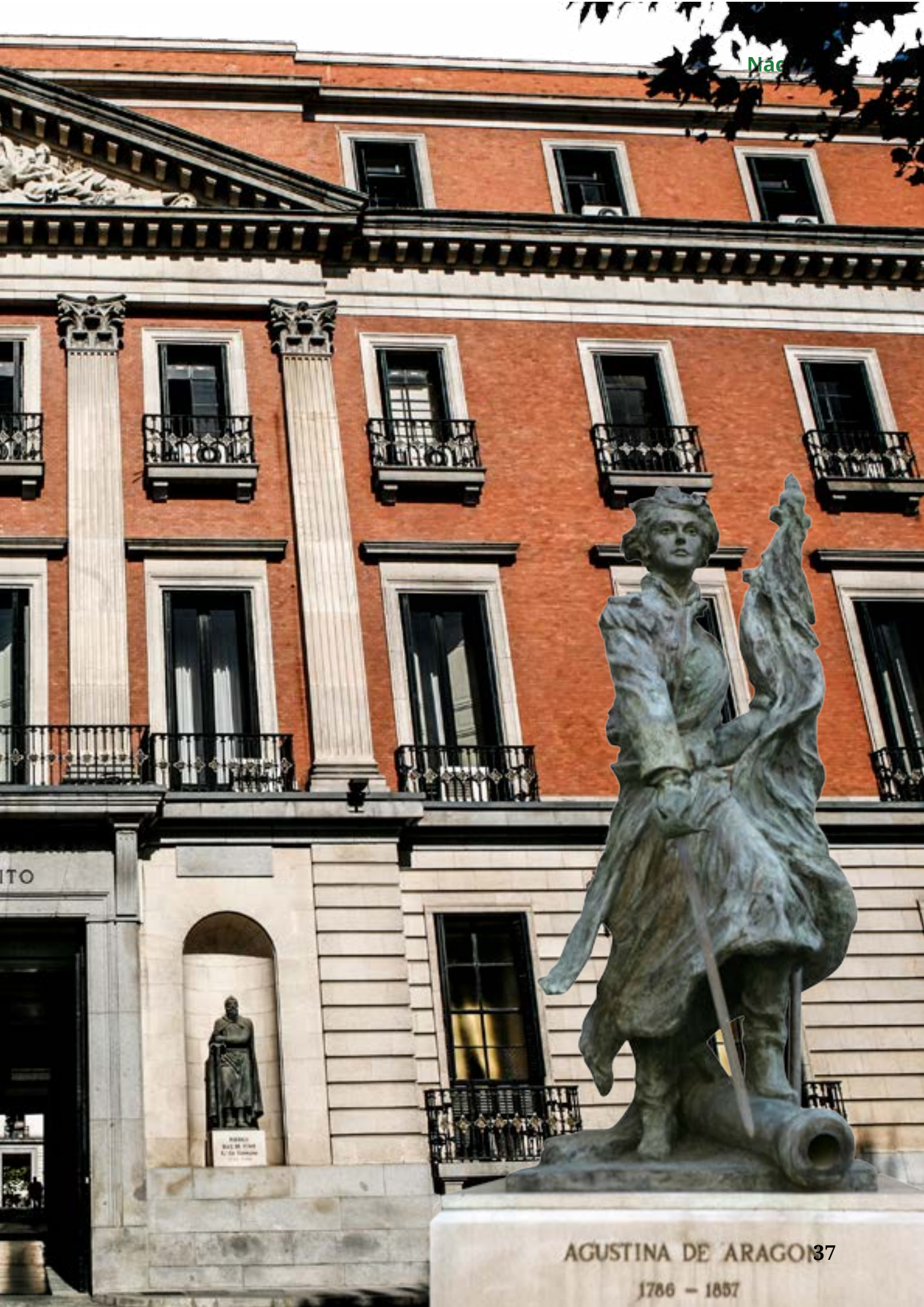
AGUSTINA DE ARAGON 37