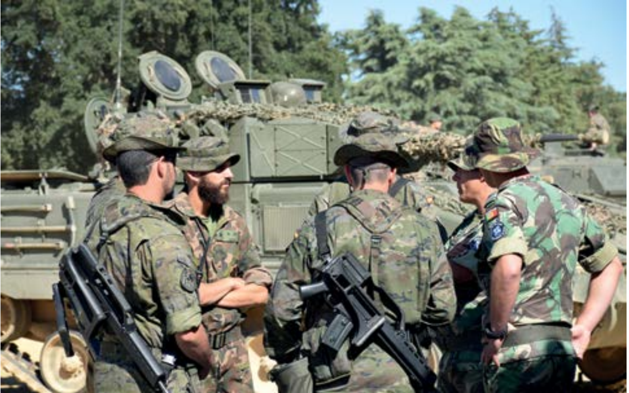
Oficiales portugueses y españoles intercambian impresiones en el ejercicio "Orión"