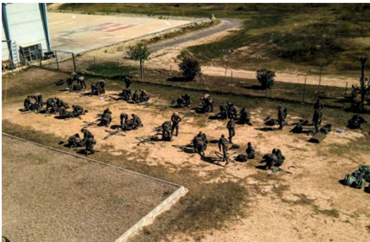
Espanoles y franceses compartieron técnicas y procedimientos en el ejercicio

En la segunda fase, a partir del 18 de septiembre, llevaron a cabo una operación de inserción paracaidista en una zona próxima a la localidad almeriense de María. En ella participaron unos 470 militares de ambos países. Primero fue el turno de los miembros de la Compañía de Reconocimiento Avanzado (CRAV), especializada en saltos de apertura manual a gran altura, y que, posteriormente, monitorizó la zona de operaciones y señaló las áreas de despliegue de la fuerza principal. Esta, formada por más de 300 paracaidistas y cargas de acompañamiento, entró en ac-