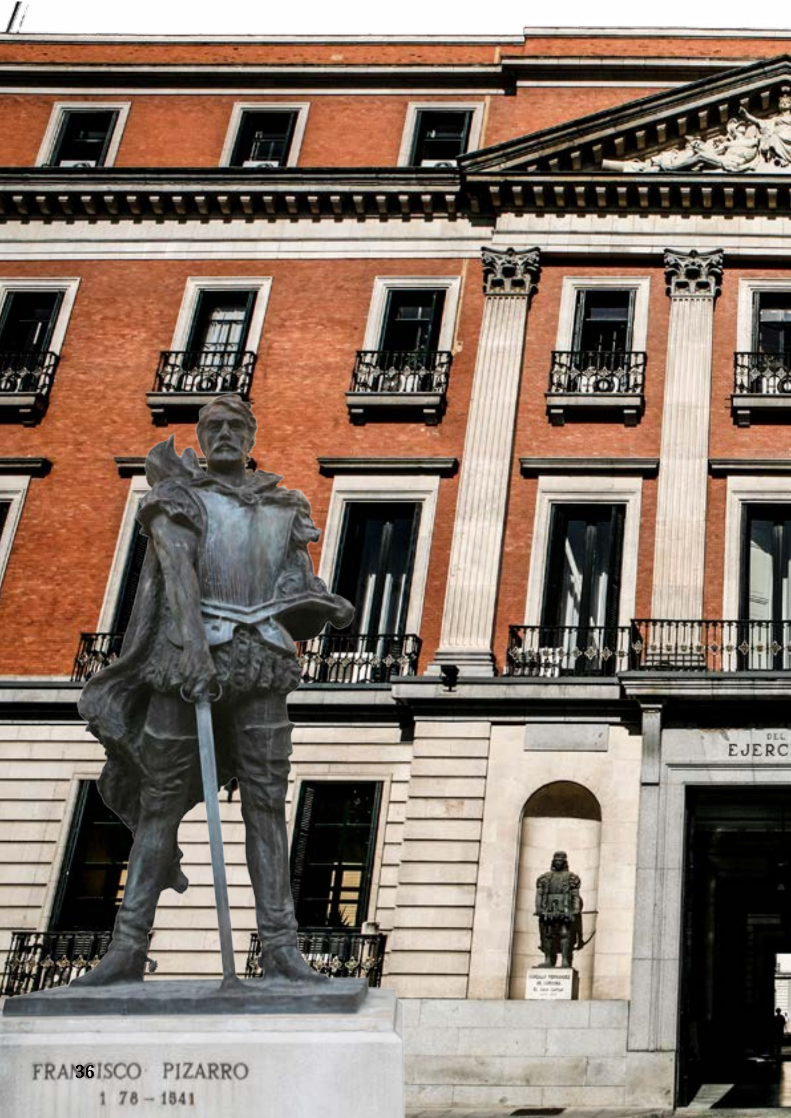
FRANCISCO PIZARRO 178 - 1541