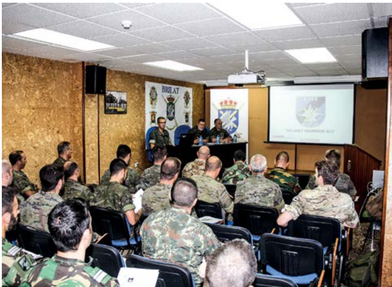
Asistentes al "Valiant Warrior" II/17 en una de las sesiones de puesta en común

Además, este tipo de ejercicios sirven para incrementar el conocimiento mutuo de las unidades que conforman la Brigada VJTF. De hecho, esta fue una de las lecciones identificadas durante los periodos de stand-by y stand-down . T