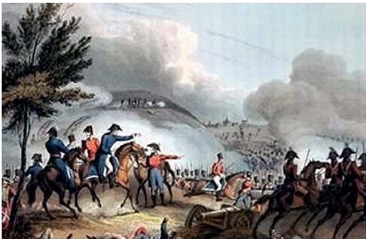
El Regimiento "Arapiles" nº 62 toma su nombre de la batalla de "Los Arapiles", de 1812

En 1996, la reorganización del Ejército de Tierra lo transforma en Regimiento de In-