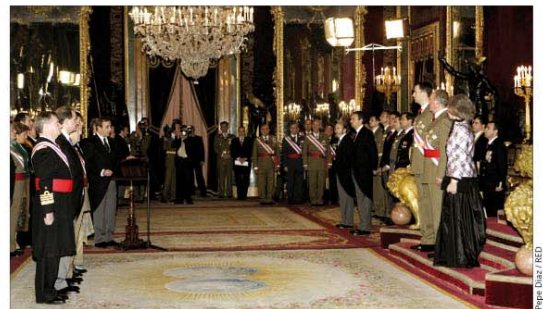
El acto central de la Pascua Militar tuvo lugar en el Palacio Real de Madrid

Durante el Día de la Fiesta Nacional, el 12 de octubre, la Familia Real al completo quiso arropar a las Fuerzas Armadas (nº 152). En esta ocasión desfilaron por primera vez reservistas voluntarios y veteranos de las Fuerzas Armadas y la Guardia Civil.