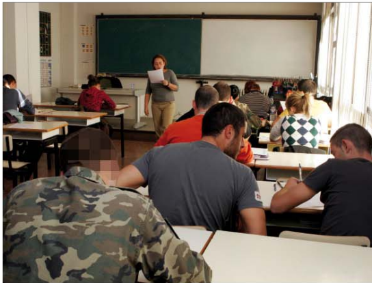
Facilitar la promoción profesional es uno de los objetivos del Ejército

Este año también se ha contemplado la necesidad de actualizar y adecuar el Plan de Calidad de Vida a la realidad del Ejército, ya