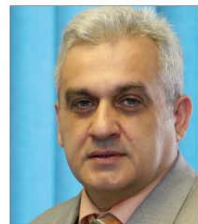
LJUBO BESLIC ALCALDE DE MOSTAR

«Creo que es un gran logro que el Ejército haya sabido asumir y adaptarse a los cambios del país».