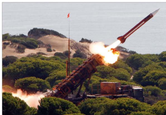
El lanzamiento del misil Patriot, en "Médano del Loro", fue todo un éxito

El primer tiro con misil Patriot realizado por militares españoles se efectuó, el 18 de abril, en las instalaciones militares del campo de maniobras y tiro de misiles "McGregor Range", en Nuevo México (EEUU). Los 14 militares —pertencientes a la 9ª Batería Patriot del Regimiento de Artillería Antiaérea nº 74— pusieron en práctica los conocimientos adquiridos durante más de dos años de dedicación y estudio de este materia (nº 147). En nuestro país, el primer lanzamien-