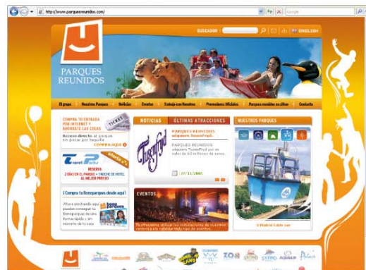
En las OFAP informan de todas las novedades y actividades

En el extranjero también ofrecen ventajas como cuatro entradas gratis para el Sea World de Orlando (Estados Unidos) —es un parque acuático y uno de los acuarios más grandes del mundo—. En la gran mayoría de estos centros el militar sólo tendrá que presentar la TIM en las taquillas, y de esta forma obtener un descuento en su entrada y en la de, al menos, tres acompañantes.