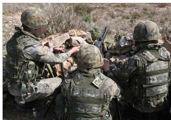
La COMGEBAL realizó el ejercicio "Siurell", en el mes de marzo, en "Chinchilla"

La Brigada de Caballería "Castillejos" II llevó a cabo, en junio, un ejercicio de los grupos que componen la Agrupación Táctica "Pegaso" (nº 149).