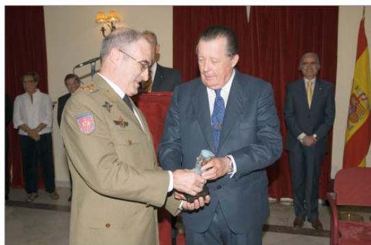
El JEME recibió el Máster de Oro del Fórum de Alta Dirección