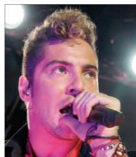
DAVID BISBAL CANTANTE

Tierra estuvo con los dos jugadores de la Selección seis días antes de la final del Eurobasket.