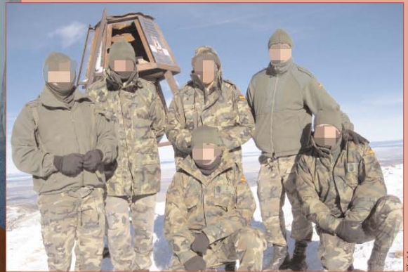
La nieve es el motivo principal de los dos Nacimientos escogidos para nuestra felicitación: el de la Campaña Antártica 2007-08 y el colocado por el Regimiento de Transmisiones nº 1 en el Pico San Millán (Burgos)