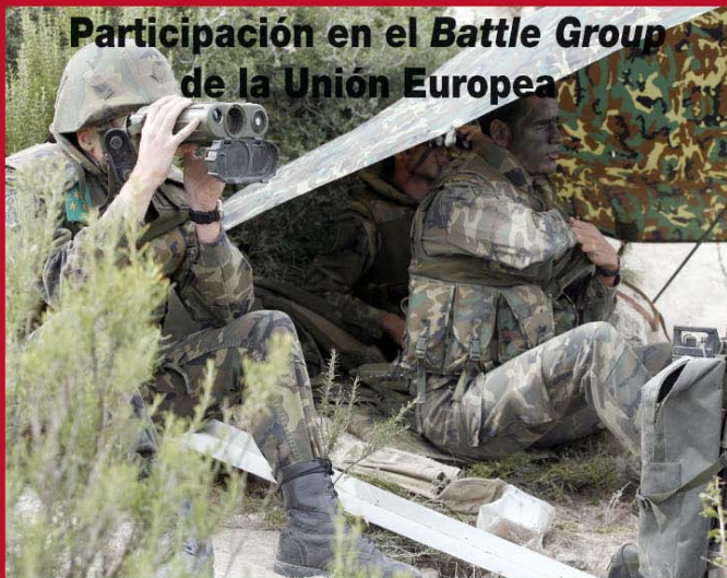
Participación en el Battle Group de la Unión Europea