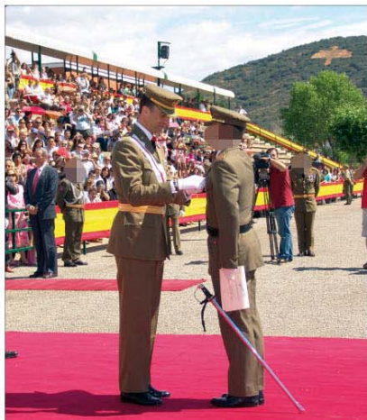
Don Felipe presidió la entrega de despachos en Talarn

Brigada de Infantería Ligera "Alfonso XIII", II de la Legión (nº 152). Dichas maniobras consistieron en una demostración de las capacidades operativas de la Agrupación Táctica Ligera de Alta Disponibilidad (AGTLAD) "Don Juan de Austria", formada sobre la base del Tercio del mismo nombre, 3º de la Legión. Durante el ejercicio, el Príncipe presenció un tema táctico —que consistió en una operación aeromóvil— y una acción ofensiva con fuego real. En ellas participaron prácticamente todos los componentes de la Agrupación, más de 1.100 militares. Tras el ejercicio, intercambió algunas impresiones con los miembros de las unidades.