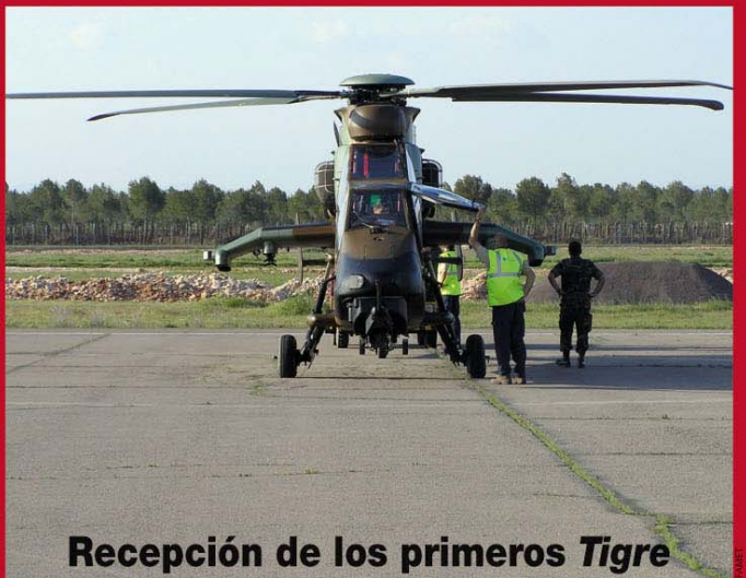
Recepción de los primeros Tigre