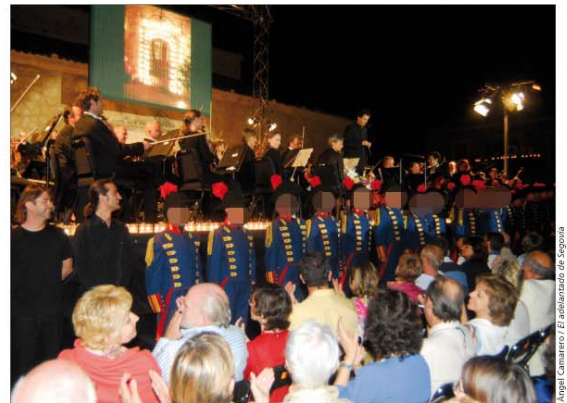
La Batería de Honores de la ACART participó en el Concierto de las Velas de Pedraza

El Regimiento de Especialidades de Ingenieros nº 11 instaló un puente Bailey sobre el río Girona ya que el que existía se desplomó por las inundaciones ocurridas en Beniarbeig, en Alicante (nº 152).