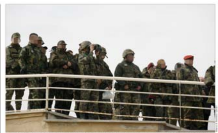
El Ejército Group ha sido un ejemplo más del trabajo que realizan las Fuerzas Armadas españolas en el ámbito multicultural