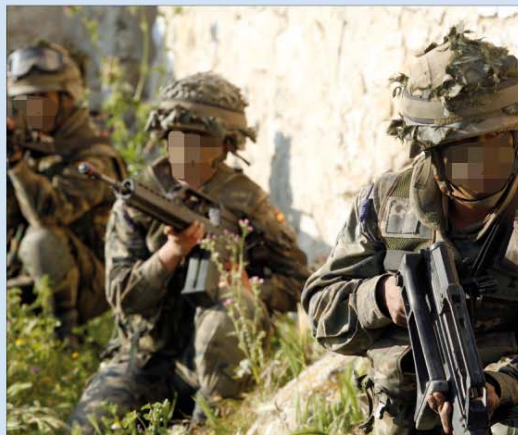
Los zapadores también participaron en el ejercicio "Furex"

La principal novedad de las Escuelas Prácticas de Ingenieros, que realizan todas las unidades de esta Especialidad Fundamental una vez al año —en esta ocasión en el mes de mayo— es que se han desarrollado en cinco escenarios distintos: Burgos, Huesca, Salamanca y Zaragoza (en los acuartelamientos "San-genis" y "General Bahamonde").