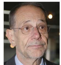
JAVIER SOLANA POLÍTICO

«Me gustaría retirarme con un solo, por lo que puede que espere al Mundial de Roma».