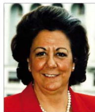
RITA BARBERÁ ALCALDESA DE VALENCIA

Además de la información sobre temas militares, a la que, como es lógico, dedicamos la mayor parte de nuestro periódico, también hemos incluido en nuestras páginas entrevistas a personas destacadas del mundo de la Cultura, el Deporte, el Periodismo o la Política, entre otros. Todos ellos nos han dedicado amablemente un pedacito de su tiempo para transmitirnos sus vivencias, sus conocimientos, filosofía de vida o si han mantenido algún tipo de relación con el Ejército en algún momento.