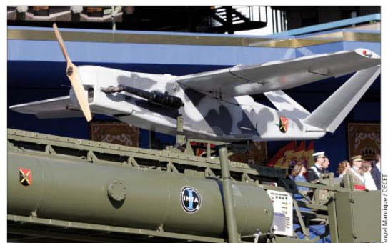
El SIVA fue uno de los protagonistas del Día de la Fiesta Nacional