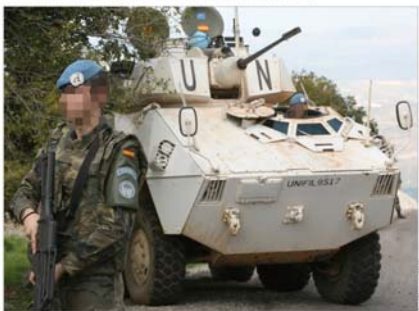
Los militares españoles desplegados en el Líbano han continuado este año prestando seguridad a la población

Nuria Fernández Madrid El Ejército español ha continuado, en 2007, sus misiones internacionales, ya iniciadas en años anteriores. En Libano, Afganistán, Kosovo y Bosnia-Herzegovina. Pero la novedad se ha dado en esta última, ya que este año se ha producido el final del despliegue de las Fuerzas del Ejército de Tierra, quedando sólo una unidad de reserva de Infantería de Marina en Sarajevo y cuatro Equipos de Observación y Entace (ELOT) en distintos puntos del país (nº 150).