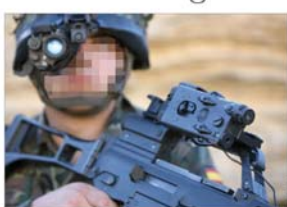
Los mejorados en los equipos de visión nocturna y los Vehículos Aéreos no Tripulados han sido algunos de las novedades del año 2007 en el ámbito del material

Además, se han incluido en nuestros páginas diversos reportajes monográficos de otros materiales. Por ejemplo, en febrero (nº 143) se escribió sobre los prototipos de los Vehículos Aéreos no Tripulados (UAV) que estaba probando la recién creada Base de Ataque I. Estos aparatos, según explicaban miembros de la unidad, incorporan una importante innovación en el área informática: un nuevo sistema controla íntegramente la mecánica, la electricidad y la parte antidrática.