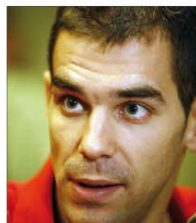
CALDERÓN Y NAVARRO JUGADORES DE BALONCESTO

«El interiorismo no es un problema de presupuesto. Por ejemplo, soy un defensor de Ikea».