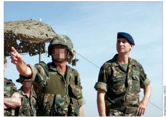
El Príncipe acudió, en "Chinchilla", a un ejercicio de la Brigada de la Legión

El 20 de noviembre, don Juan Carlos asistió al ejercicio "Desembarco Paracaidista", desarrollado por la Brigada de Infantería Ligera Paracaidista "Almogávares" VI en "San Gregorio". El Rey destacó la labor de los componentes de la BRIPAC, elogiando su preparación, profesionalidad y espíritu de sacrificio (nº 153).