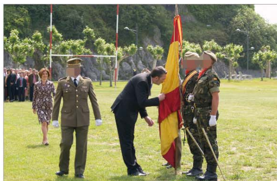
La ciudad cántabra de Santoña acogió una de las juras de Bandera de civiles

El anterior JEME, general de ejército García González, recibió, el 11 de diciembre, la Legión de Honor francesa. «Al distinguirme a mí, se distingue implícitamente al Ejército español», aseguró (nº 154).