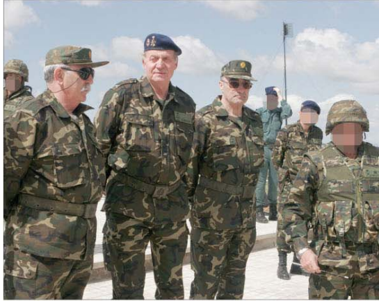
El Rey comprobó en el "Furex" la potencia de fuego de la BRIMZ XI

Cinco días más tarde, el 28 de mayo, don Juan Carlos comprobó sobre el terreno, en el ejercicio "Furex" —desarrollado en el Centro de Adiestramiento "San Gregorio" (Zaragoza)— las capacidades de la Brigada de Infantería Mecanizada "Extremadura" XI, ubicada en Bótoa (Badajoz). En estas maniobras —en las que participaron más de 1.200 militares y un centenar de vehículos, entre ruedas y cadenas— quedó demostrada la potencia de fuego, movilidad y flexibilidad de