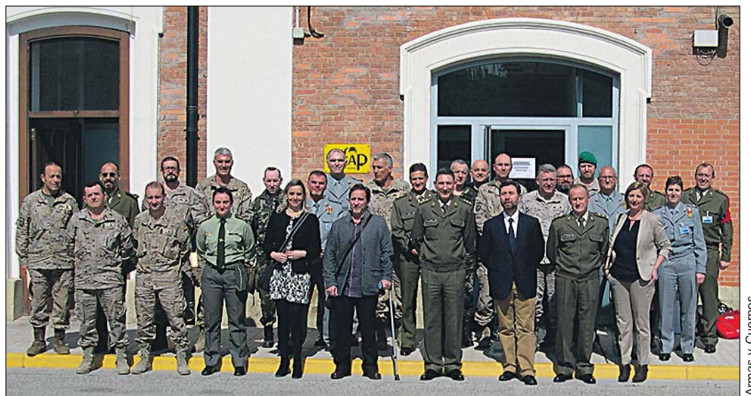
Los participantes en el taller que se celebró en la AGM entre el 17 y el 20 de marzo.

Empatía. Es una de las habilidades más importante en la inteligencia emocional. No es solo ponerse en el lugar del otro, la empatía significa sentir lo que la otra persona siente, por qué tiene determinados comportamientos. Se ha definido como la habilidad básica para el trato interpersonal con la que somos capaces de "leer emocionalmente" a las personas y saber interpretar sus sentimientos.