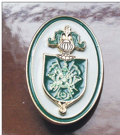
Armas y Cyuerpos