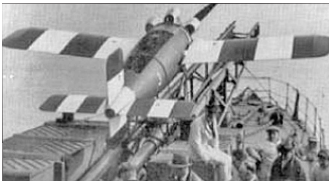
Las guerras mundiales propiciaron un desarrollo muy importante de esta tecnología.

Al tiempo, Alemania revisaba y proponía su propio concepto de "Torpedo Aéreo", y lo materializaba en sus archiconocidas bombas volantes V-1 que caían sobre Londres y la costa sudeste de Inglaterra procedentes de sus rampas de lanzamiento instaladas en los Países Bajos. Las bombas V-1 constituyeron en realidad el primer misil de crucero, propulsadas por un pulsorreactor y guiadas mediante un bastante rudimentario sistema barométrico para mantenimiento de la altura y la velocidad junto con un giróscopo direccional y una brújula magnética para el mantenimiento del rumbo. Un anemómetro se encargaba de determinar la distancia recorrida y el momento en el que el arma debía iniciar la fase terminal hacia su objetivo en función del número de ciclos completados por su mecanismo. La V-1 fue un arma muy imprecisa debido a su precario sistema de guiado, aunque causó gran impacto en el enemigo gracias a su capacidad para transportar