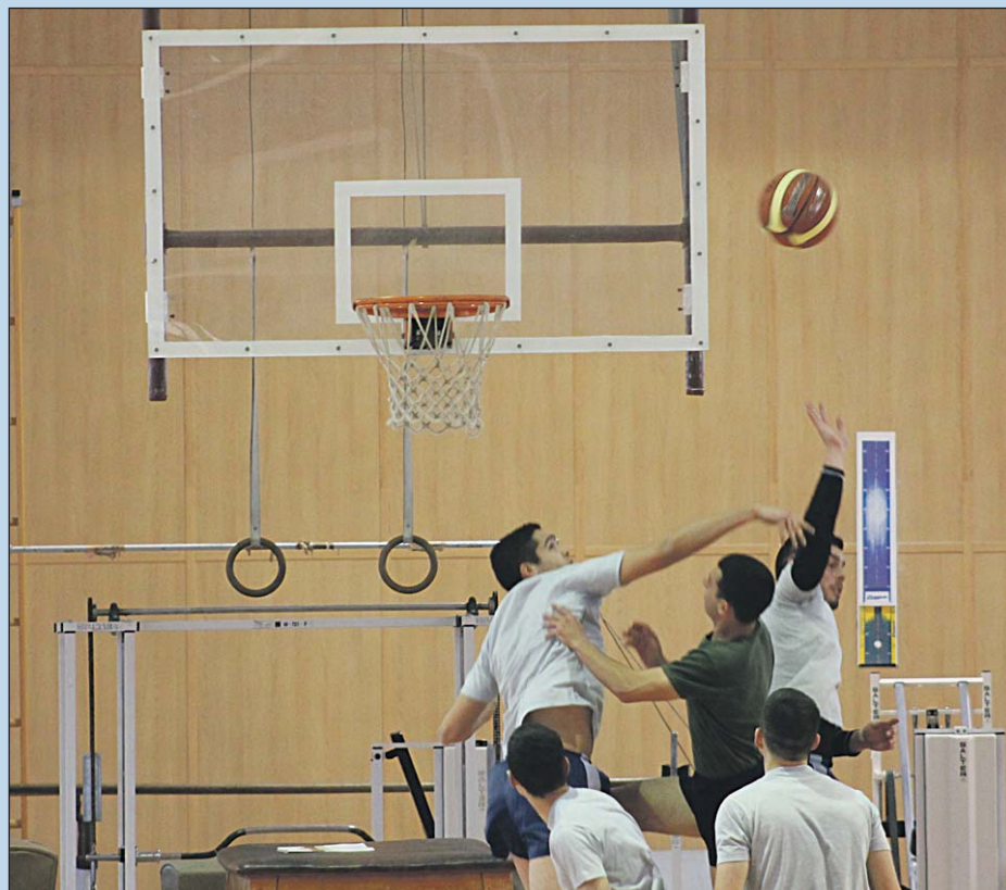
Los entrenamientos son básicos para afrontar con posibilidades los partidos.

El CC. Miguel Orgillés Mañas pertenece a la 23 Compañía