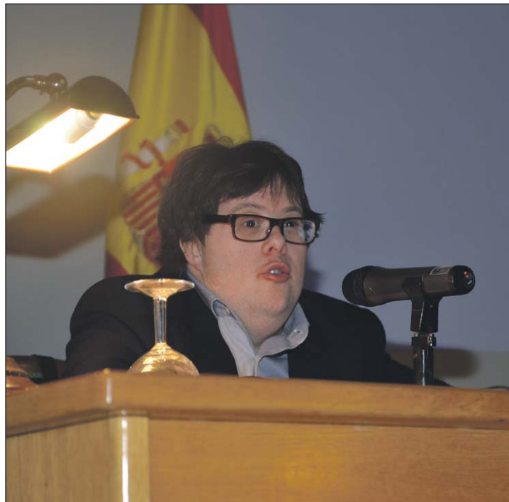
Pablo Pineda también respondió a las preguntas de los cadetes.

A pesar de su magnífica predisposición a la enseñanza, ya que preguntaba en clase y se interesaba, "Descolocando" a los profesores, estos no creían en él. Decían que no podría aprender, que no sabían cómo iban a enseñarle, que no iba a aprender nunca. Él luchó contra esto desde el principio, apoyado en su propia autoestima y el repudio a la compasión. Sencillamente quería demostrar