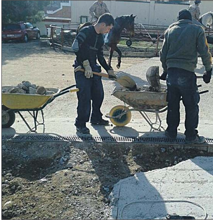
Alumnos que participan en el módulo de Albañilería.

Durante los seis primeros meses estos alumnos reciben una formación ocupacional en