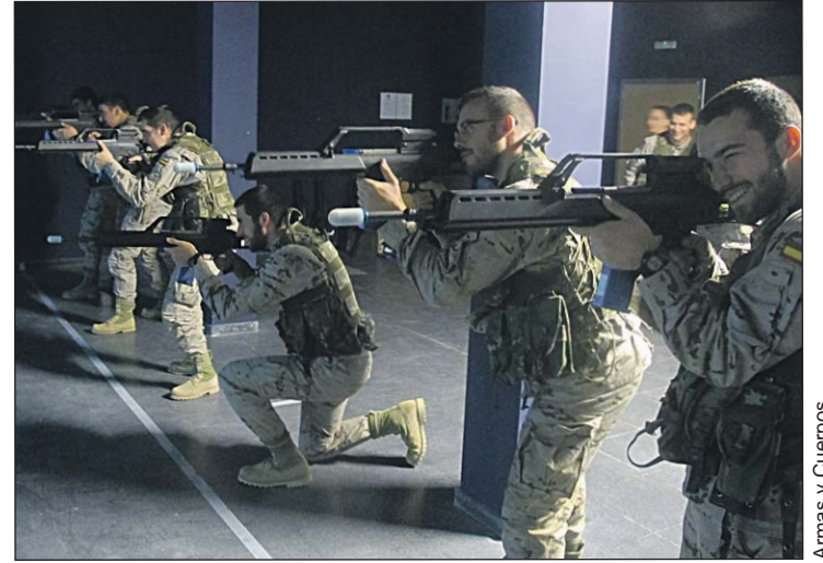
El tiro es una de las actividades que desarrollan los alumnos.

Cabe la posibilidad que se prorrogue en un año más la continuidad de esta Escuela Taller, pero dependerá de la concesión de la subvención por parte del Servicio Público de Empleo Estatal, que es el que ha financiado todos los proyectos de Escuelas Taller en la AGM.