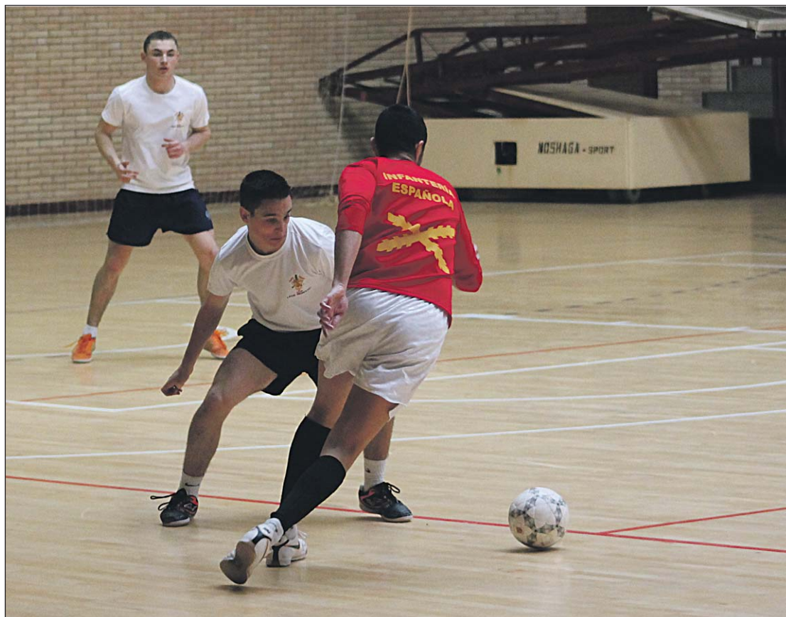
El equipo de la AGM ha adquirido madurez y, sobre todo, mucha soltura en el juego.

El equipo de la Academia General Militar de Fútbol Sala disputó cuatro partidos en la primera fase, tras la cual se han obtenido muy buenas sensaciones. Tras una actuación en la anterior campaña marcada por las derrotas y un juego irregular del equipo, este año se ha conseguido mejorar bastante. Este cambio se ha producido sobre todo gracias a un cambio en la estrategia del equipo y en la dinámica de los entrenamientos. Esto ha provocado que el equipo tuviera un juego mucho más sólido y definido, viéndose los efectos de ello en los resulta-