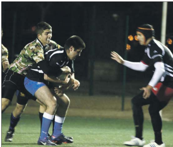
Respeto y sacrificio son dos de los valores de este deporte.

Desde que empezó el curso se han disputado varios partidos amistosos, tanto contra la Universidad San Jorge (ZGZ) como contra varias facultades de la Universidad de Zaragoza (Veterinaria y Económicas). Además, el equipo masculino participa por cuarto año consecutivo en el Trofeo Rector de la UNIZAR, habiendo pasado la fase de grupos invicto. Pero no