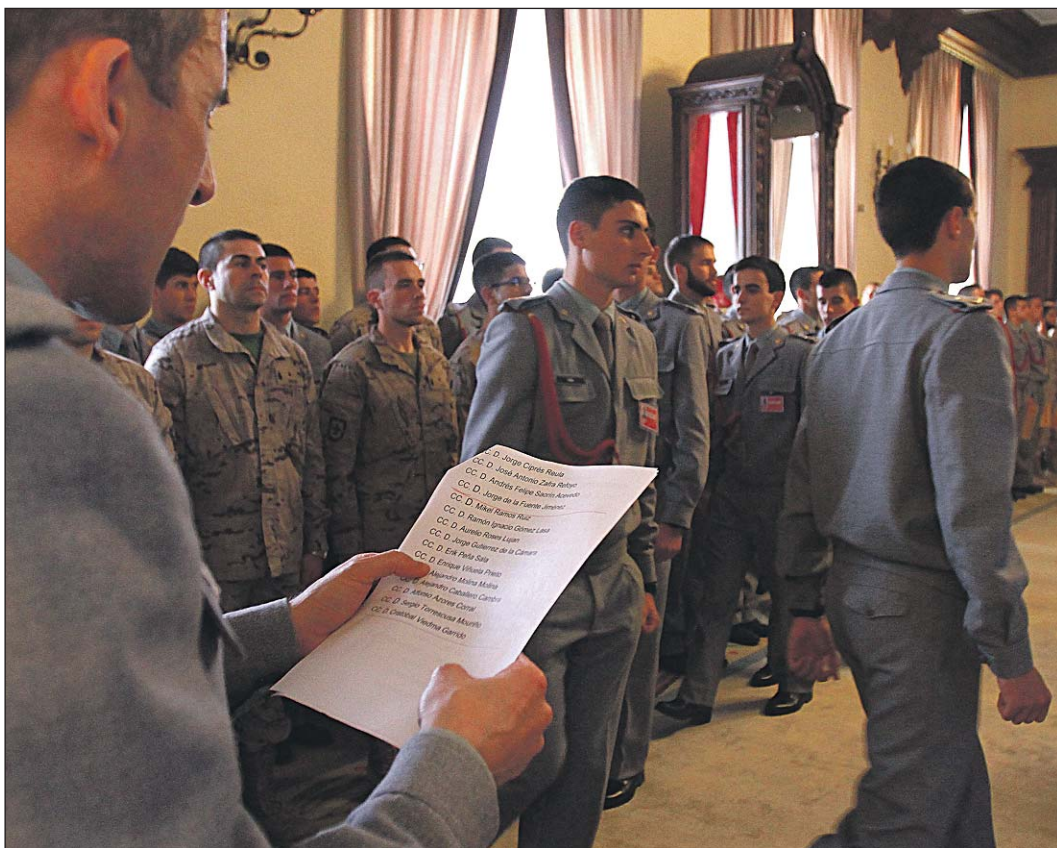
La Sala de Banderas acogió la entrega de los reconocimientos.