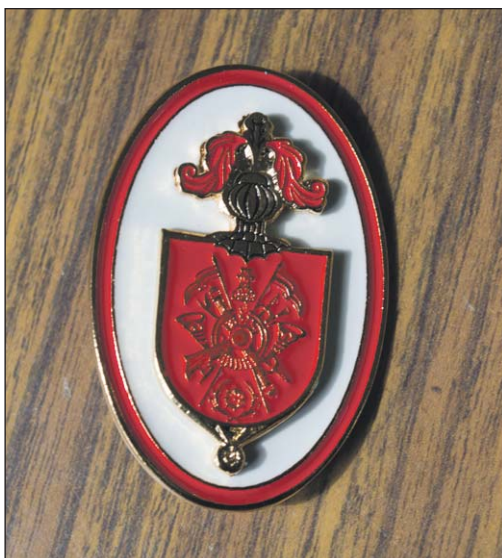
Armas y Cyuerpos