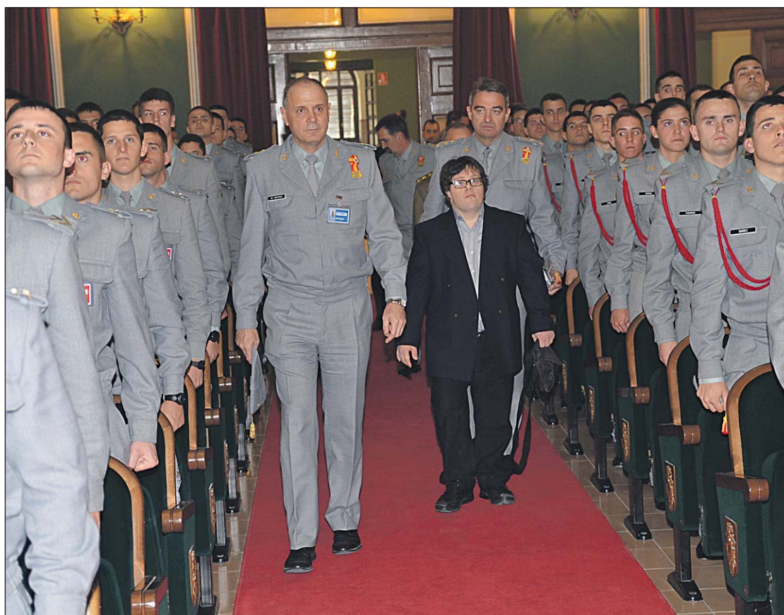
Pablo Pineda, entrando en el salón de actos junto al General De Gregorio y el Coronel Escalona.

Superados los nervios iniciales, el relato de Pablo fue creciendo alrededor de mensajes positivos: “Confiaba en que podía hacer una película y la hice (ganó la Concha de Plata en el Festival de San Sebastián por ‘Yo también’), pero me pudo más el hecho de querer transmitir ese mensaje a la sociedad que el de ser actor”. Y a partir de ahí insistió en lo importante que es no tirar nunca la toalla “por muchas zancadillas que te pongan en la vida”; saber organizar todo el aprendizaje “porque la sociedad que os va a recibir es muy competitiva”; ser siempre “un poco inconformistas, tratando de mejorar las cosas, aprendiendo de la gente que os rodea e interactuando con ella” y tener muy claro que “la suerte