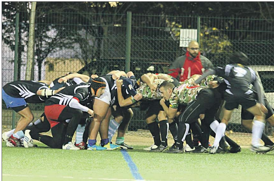
El equipo de rugby de la AGM está demostrando un gran nivel en todos los torneos.

Leyendo estas líneas cualquiera podría pensar que el rugby debería ser considerado un deporte militar más. Y ese es uno de los objetivos a largo plazo de este equipo: acercar el rugby al Ejército y el Ejército al rugby, buscando fomentar su