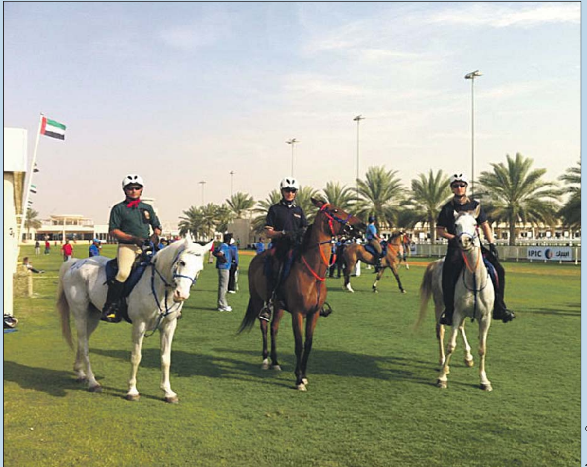
Los integrantes del equipo español obtuvieron una meritoria cuarta plaza en la clasificación.