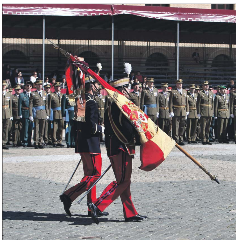
Los integrantes de la XLVIII Promoción regresaron a la Academia General Militar donde renovaron el juramento a la Bandera.

La Academia General Militar acogió el 15 de marzo a los integrantes de la XLVIII Promoción y oficiales del curso 88-89 del Cuerpo de Ingenieros Politécnicos y Cuerpos Comunes, que 25 años después volvieron para renovar con ilusión su compromiso con la patria. Junto a ellos compartieron escenario en el Patio de Armas los Caballeros y Damas Cadetes de la LXXIII Promoción, que hace apenas unos meses asumían también su compromiso de servicio en la ceremonia más importante en la vida de un militar.