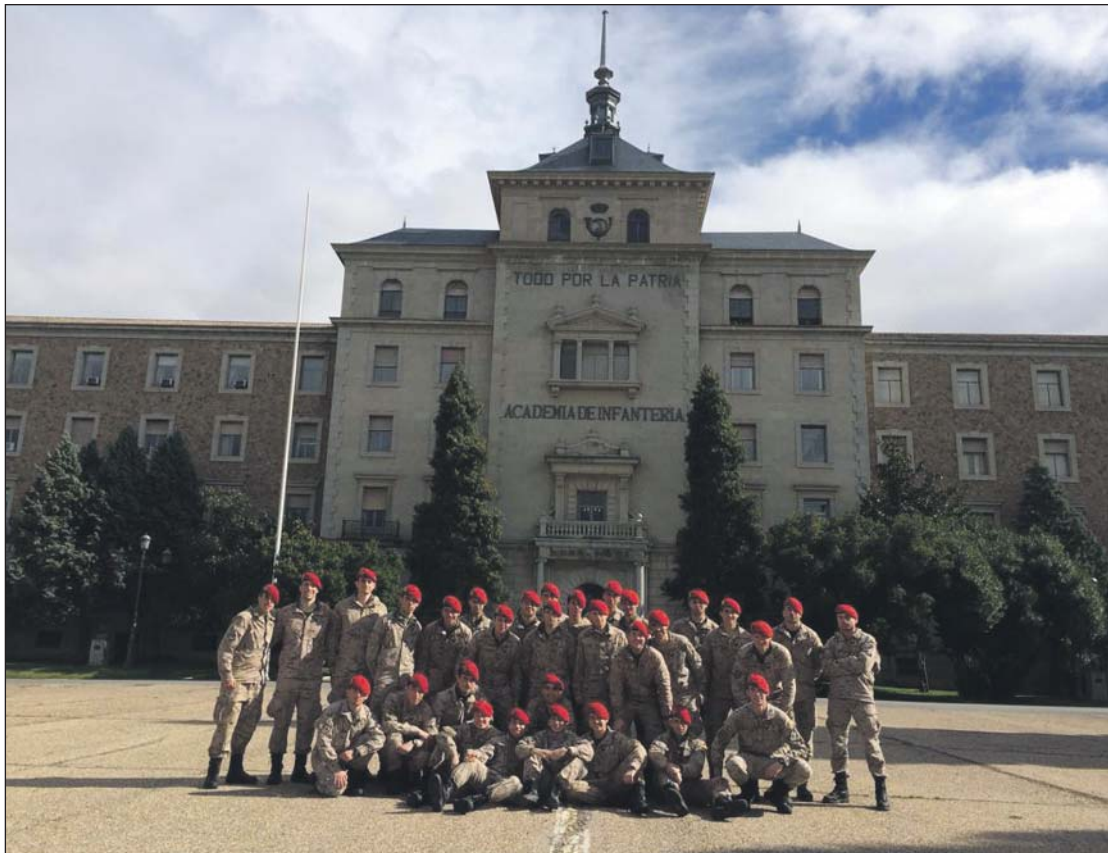
En la Academia de Toledo los cadetes han coincidido con Tenientes de la LXVIII Promoción.

Los explosivos, característicos del Arma de Ingenieros, nos hicieron llevar a la práctica lo ya aprendido en las aulas. Comenzamos desde lo más básico y fuimos progresando, pasando desde el quemado de la mecha lenta hasta el explosionado de un explosivo P-1000. También empleamos cordón detonante anudándolo al explosivo para transmitir la explosión. Empleamos el detonador completo (DECO), para iniciar el encendido. Una vez aprendimos lo básico, pasamos a experimentar y a poner en práctica conceptos más complejos.