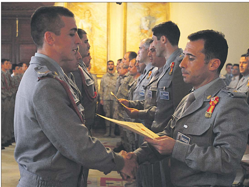
Profesores de la AGM entregaron los distintivos a los cadetes.