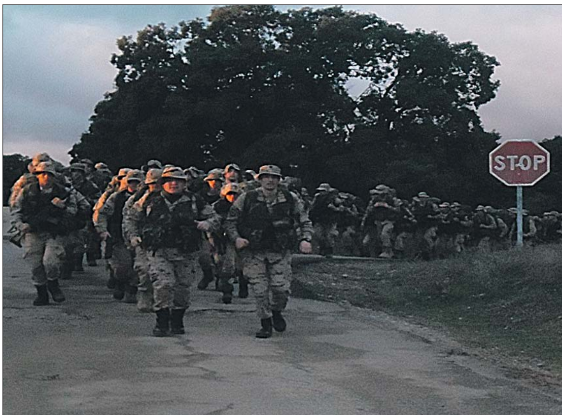
Regreso a paso ligero de la 23 Cía., encabezada por el TCol. García Lodeiro y su Cte. Ferrández.

Aunque como bien sabe todo cadete, por la más que repetida cantinela de los mandos, las maniobras acaban cuando el material está listo para su uso de nuevo. Así que una vez en la AGM, entre todos, dejamos todo como nuevo. Nos pusimos el uniforme gris, y regresamos a nuestra realidad, que se verá paralizada en junio con las maniobras en Jaca.