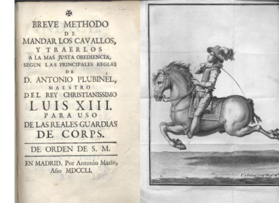
A. Plubinel. Biblioteca Central Militar (Madrid)