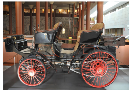
Peugeot Faeton. Museo del Ejército (Toledo)

Este abundante legado se encuentra distribuido por la geografía española en museos de distintos tipos, salas históricas de las Unidades militares y sedes institucionales.