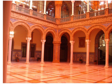
Cuartel General de la Fuerza Terrestre (Sevilla)

También se incluye fortalezas de distinto tipo que en su época fueron baluartes que posibilitaron la integridad de nuestro territorios.