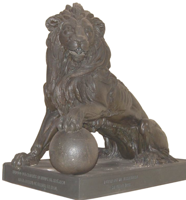
Yeso original para fundición de los leones del Congreso de los Diputados Autor Ponciano Ponzano 1871 Cuartel General de la Fuerza Terrestre (Sevilla)