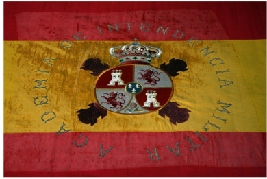
Primera Bandera de la Academia de Intendencia (Ávila)

A lo largo de los siglos el Ejército ha venido acumulando bienes de las distintas categorías que integran el Patrimonio Histórico Español: “Inmuebles y objetos muebles de interés artístico, histórico, paleontológico, científico o técnico. También forman parte del mismo patrimonio documental y bibliográfico, los yacimientos y zonas arqueológicas, así como los sitios naturales, jardines y parques, que tengan valor artístico histórico o antropológico” (Ley 16/85 de Patrimonio Histórico Español art 1,2).