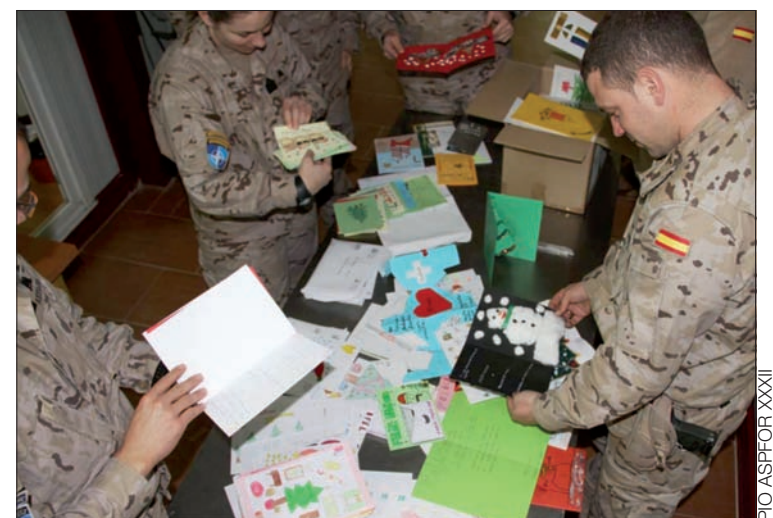
Los militares españoles han recibido miles de tarjetas navideñas

Además, el día de Navidad, el presidente de Mensajeros de la Paz, padre Ángel, visitó la base “Miguel de Cervantes” y compartió la jornada con los militares.