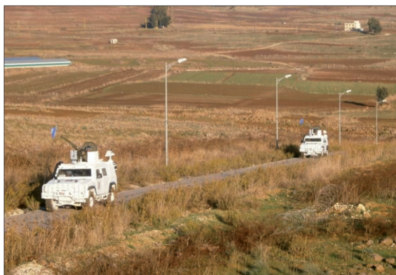
Una pareja de vehículos Lince pintados de blanco, patrullando

Por el momento, en las patrullas se combina la presencia de los Lince con la de los veteranos Blindados Medio Ruedas (BMR), que llevan prestando servicio en la zona de responsabilidad española más de seis años. La intención es que el nuevo vehículo gane terreno de forma progresiva y escalonada hasta sustituir casi por completo al BMR.