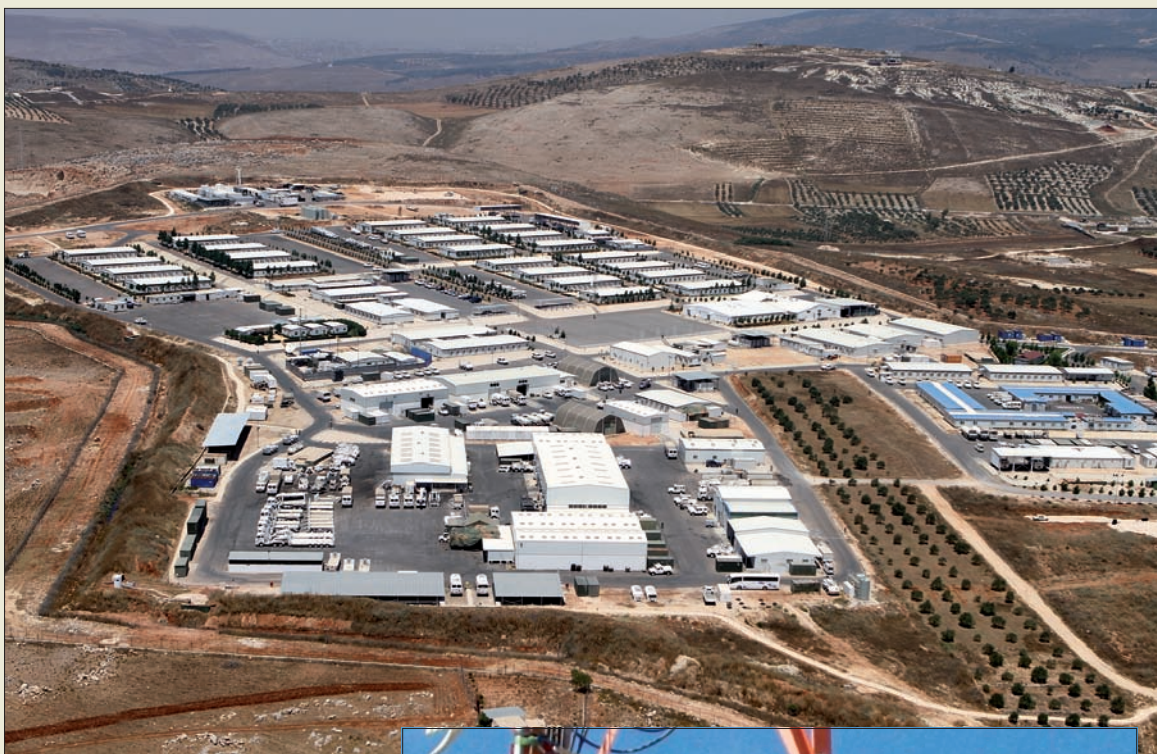
La base “Miguel de Cervantes” (arriba) ha modernizado sus transmisiones. Trabajos de montaje en altura de los nuevos radioenlaces (abajo)

De la supervisión del sistema se encarga el personal de la Unidad de Transmisiones del con-