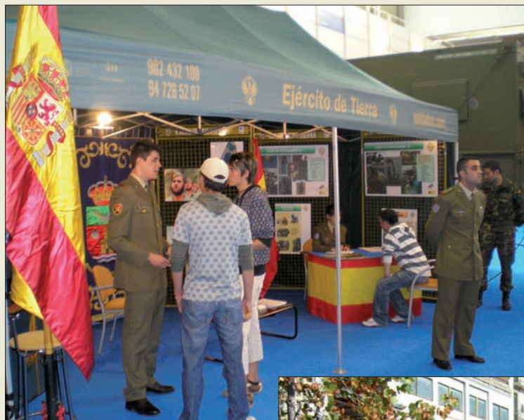
Los equipos de captación vienen participando en ferias y exposiciones (arriba), y sus unidades móviles recorren toda España (abajo)

Por estos motivos, la estructura de la captación en el Ejército de Tierra ha cambiado. Lo ha hecho de la mano de la Directiva 04/12 sobre Captación en el Ejército de Tierra y la Instrucción Técnica 16/12 sobre Normas y Procedimientos de Captación en el Ejército.