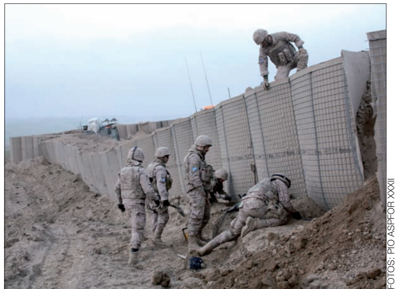
Trabajos de desmantelamiento de la última base de patrullas

Antes del relevo quiso despedirse del contingente español que compone la Fuerza Española en Afganistán (ASPFOR) XXXII —integrada mayoritariamente por personal de la Brigada de Infantería Ligera “Galicia” VII—, y el 9 de