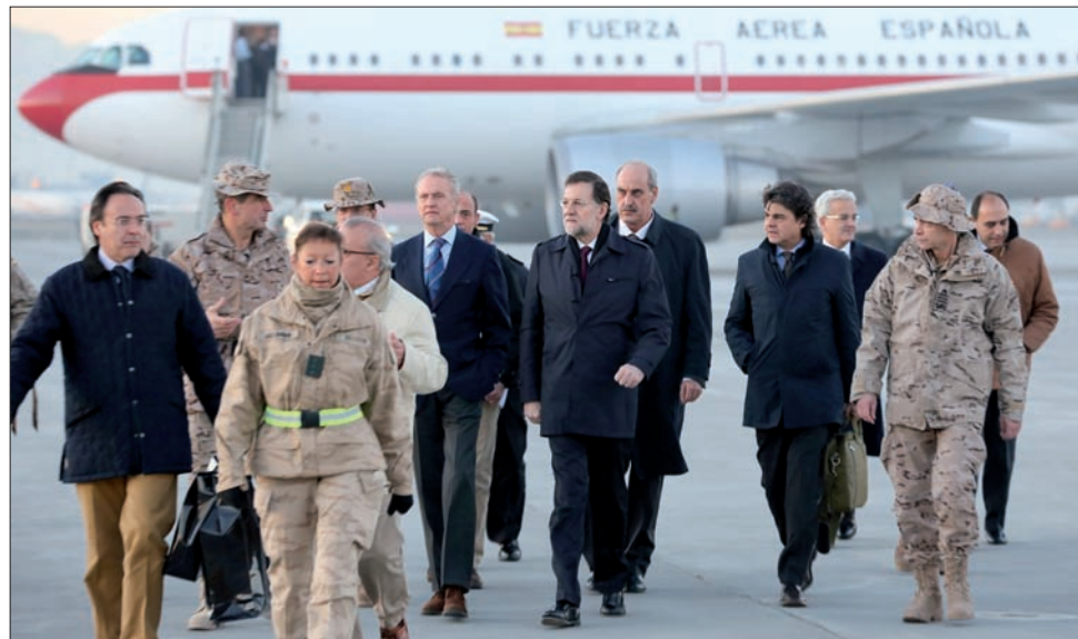
El presidente del Gobierno y el ministro de Defensa, a su llegada a Afganistán