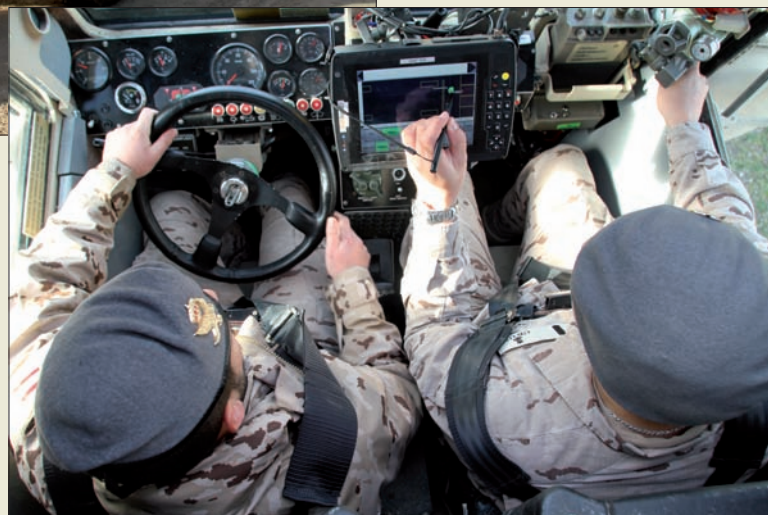
El modelo español cuenta con dos tripulantes: conductor y operador

mulados del que dispone la base, donde se habían ocultado un plato de presión, un proyectil de