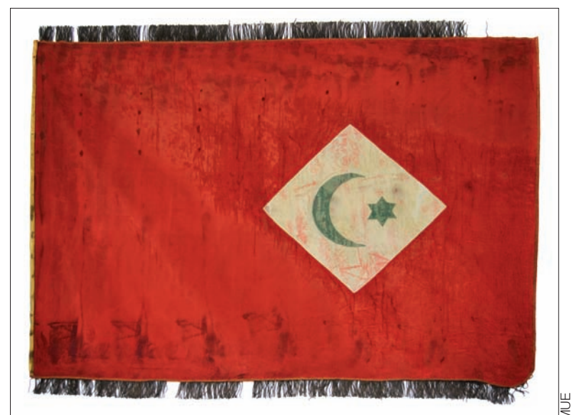
Bandera de Abd el-Krim, líder de los rebeldes rifeños

diferentes velocidades de descenso, como parte de la instrucción de lanzamientos de cargas que realiza regularmente el Mando Aéreo de Combate del Ejército del Aire. La BRIPAC ha colaborado con su Unidad de Lanzamiento de Cargas en la preparación de las mismas, una capacidad que ha recuperado su Grupo Logístico tras las últimas adaptaciones orgánicas por las que se ha reorganizado el Grupo de Apoyo a la Proyección.