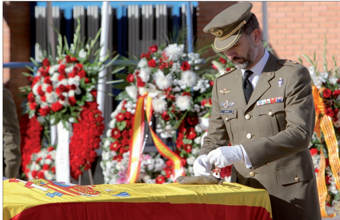
Don Felipe impuso al sargento, a título póstumo, la Cruz del Mérito Militar con distintivo rojo