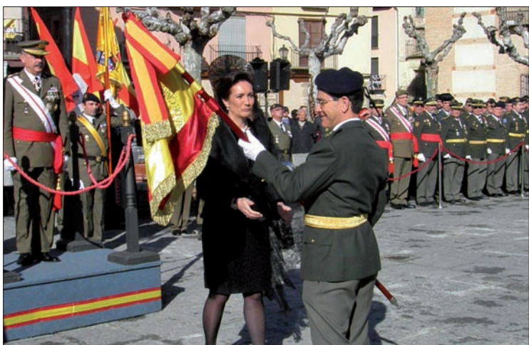
La madrina hace entrega del Estandarte al jefe de la Agrupación