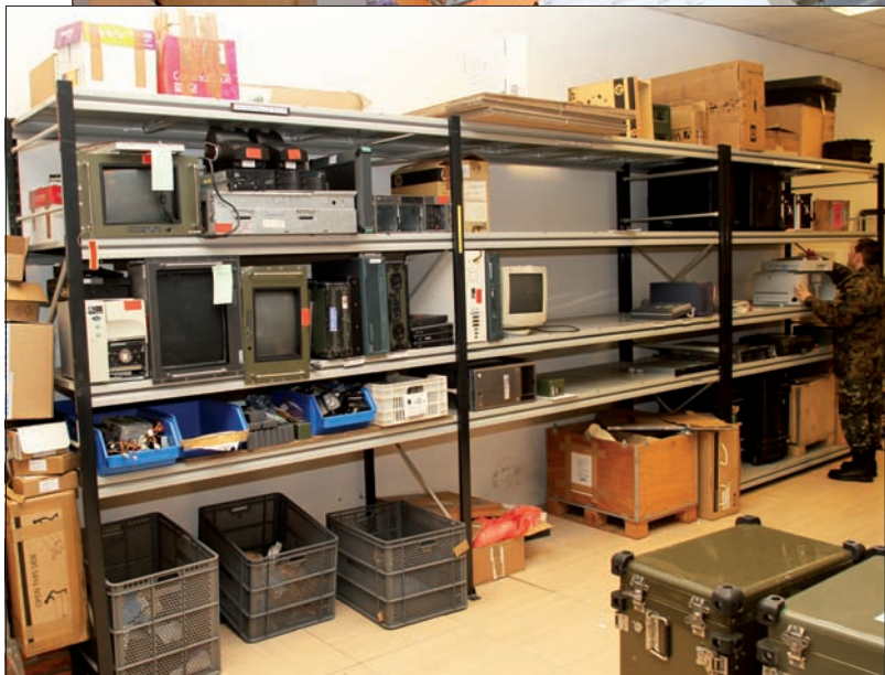
El sargento Ruiz comprueba la conexión del lector portátil del SSRL con el ordenador (arriba). Material obsoleto, revisado y pendiente, en los talleres (centro); sistema de alimentación ininterrumpida en reparación (abajo)