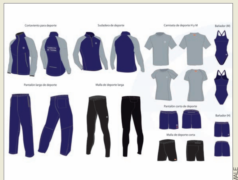
Las prendas combinan los tejidos técnicos con un diseño actual

Las camisetas de deporte, de color gris, tienen dos patrones: uno para hombre, recto, y otro para mujer, con un corte más ceñido. Las hay de dos tipos: la actual, en poliéster hidrófilo, y la nueva, en tejido técnico antibac-