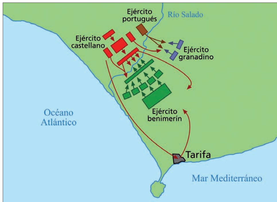
Despliegue de las fuerzas que participaron en la batalla del Salado

Uthman, a retirarse del campo de batalla, los portugueses hicieron lo propio con el emir granadino, Yusuf I. Tras varias horas de combate, la victoria cristiana era total. El ejército vencedor regresó a Sevilla y, como narra la Crónica de Alfonso Onceno en su capítulo CCLVI, los desta ciubdat rescibieronlos con muy grand placer, et hicieron muchas alegrías .