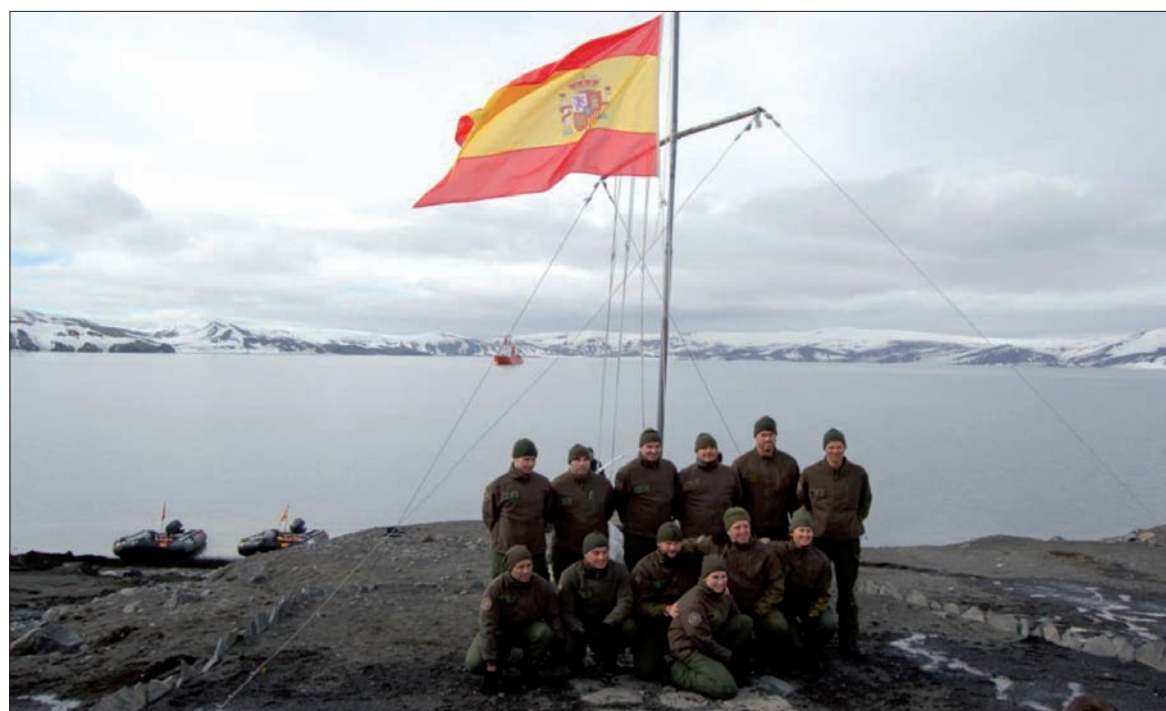
Los 12 componentes de la XXVI Campaña Antártica, en la base "Gabriel de Castilla"

Durante la jornada siguiente, el 24 de diciembre, el equipo continuó con la descarga de contenedores y trabajó en el establecimiento de las telecomunicacio-