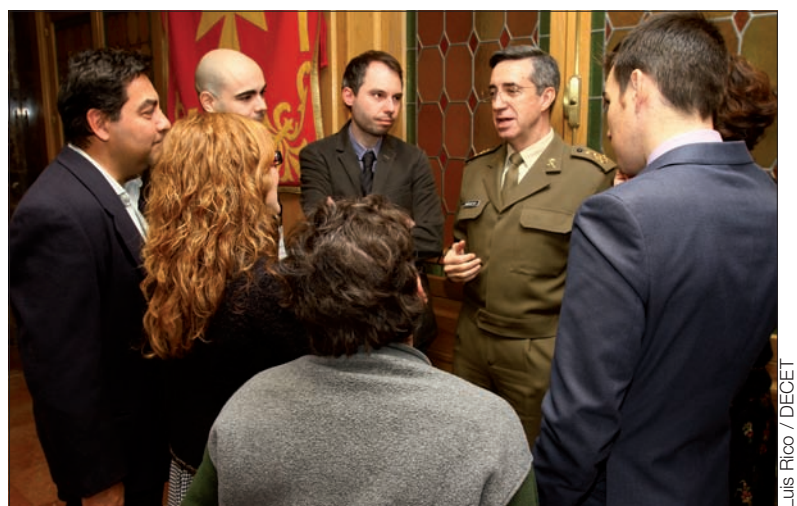
El JEME pudo conversar de forma distendida con los asistentes

En su primera celebración de esta festividad desde que ocupa el cargo, el JEME aprovechó para agradecer a estos profesionales su labor y se mostró consciente del reto que supone para ellos la complicación que entraña informar de una materia como el Ejército, que tiene su propio lenguaje y estructura. También habló sobre el futuro: «tenemos que empezar a dibujar el Ejército para dentro