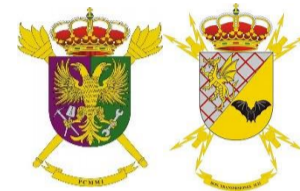
PCMMI CECOM T-1114