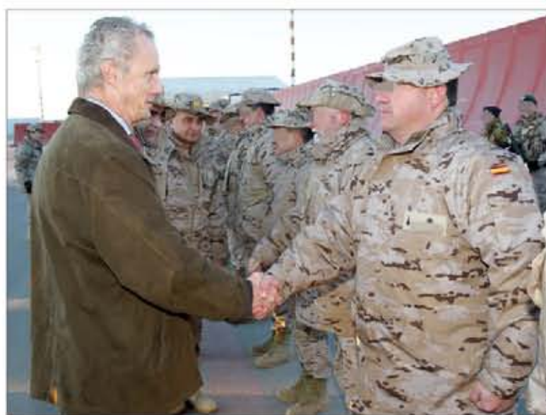
Pedro Morenés saludó al contingente español

Al día siguiente, Pedro Morenés visitó al contingente español desplegado en el Líbano. Durante su alocución en la base «Miguel de Cervantes» de Marjayoun, afirmó que el trabajo de los militares españoles es fundamental para la proyección exterior de nuestro país. También señaló que las misiones internacionales son una forma de construir una España con futuro y en el sitio que le co-