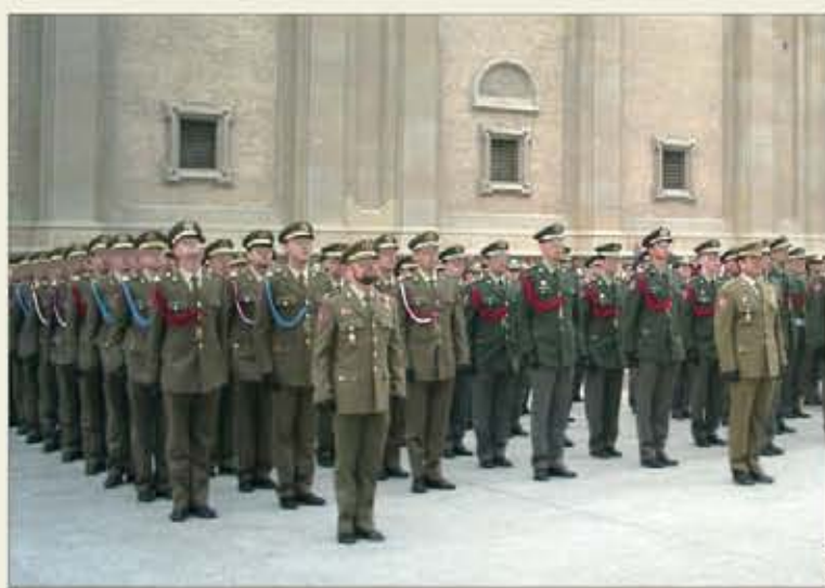
Los cambios afectan a los militares de complemento de la Ley 17/1999

En ella se detallan los destinos de la estructura orgánica del Ejército de Tierra y del Ministerio de Defensa en los que hay que cumplir 5 o 6 años —dependiendo de si los militares de complemento están adscritos a los Cuerpos Ge-