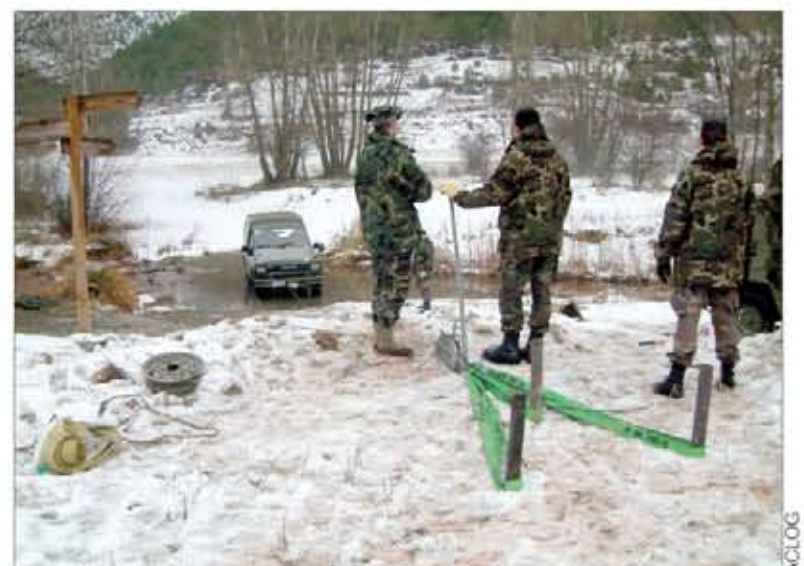
Prácticas de recuperación de un vehículo

Los profesores de este Centro son los que imparten el curso para los directores de escuelas de conductores (oficiales y suboficiales) y el de monitores para tropa.