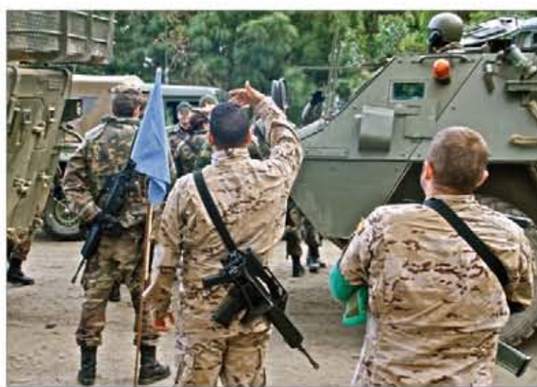
Una patrulla se interpone entre los soldados israelíes y libaneses

En la estación 3, otro grupo de civiles, hartos del paso de blindados por su pueblo, habían cortado el camino colocando obstáculos. En esta ocasión, el teniente