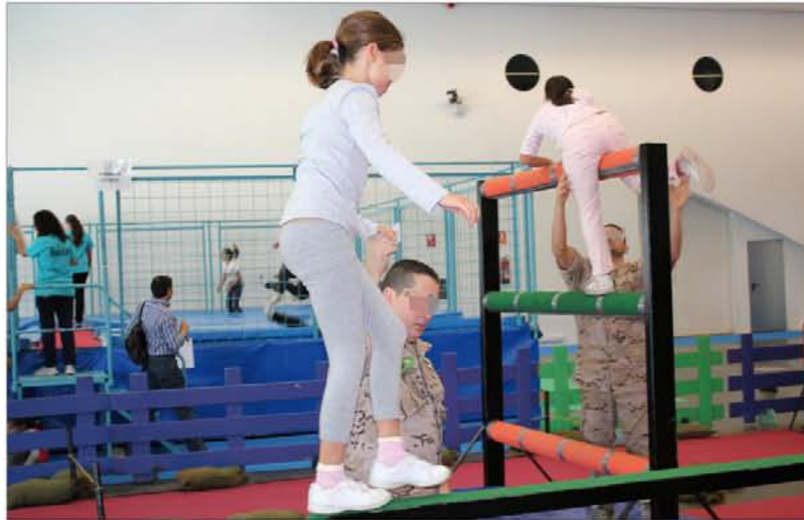
Los niños disfrutaron de la pista de combate portátil instalada en el "Parque Infantil y Juvenil de Tenerife"

En Pontevedra, del 27 al 29 de diciembre, personal de la Brigada de Infantería Ligera "Galicia"