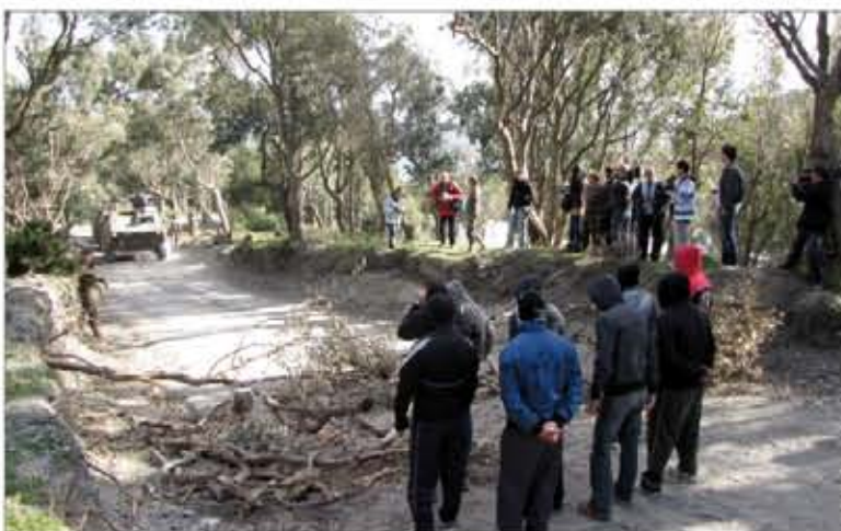
Una sección detiene su avance al encontrarse cortado el camino

Las unidades dependientes de la Comandancia General de Ceuta forman el grueso de la XVI rotación española en el Líbano, que desplegará a principios del mes de febrero. Para completar su preparación, participaron en el ejercicio "Aleo", donde se certificó al Cuartel General y la Plana Mayor del Grupo Táctico y se validaron varias secciones. Pág. 11