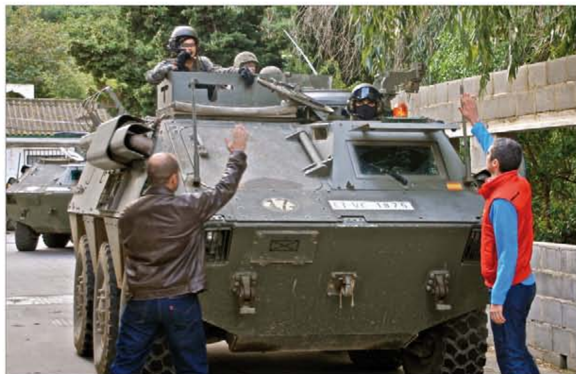
Dos civiles dan el alto a una patrulla española mientras atraviesa una población

A diferencia de sus predecesores, la XVI rotación no tiene equivalencia con una Brigada en territorio nacional. La mayoría de sus integrantes proceden de unidades de la Comandancia General de Ceuta