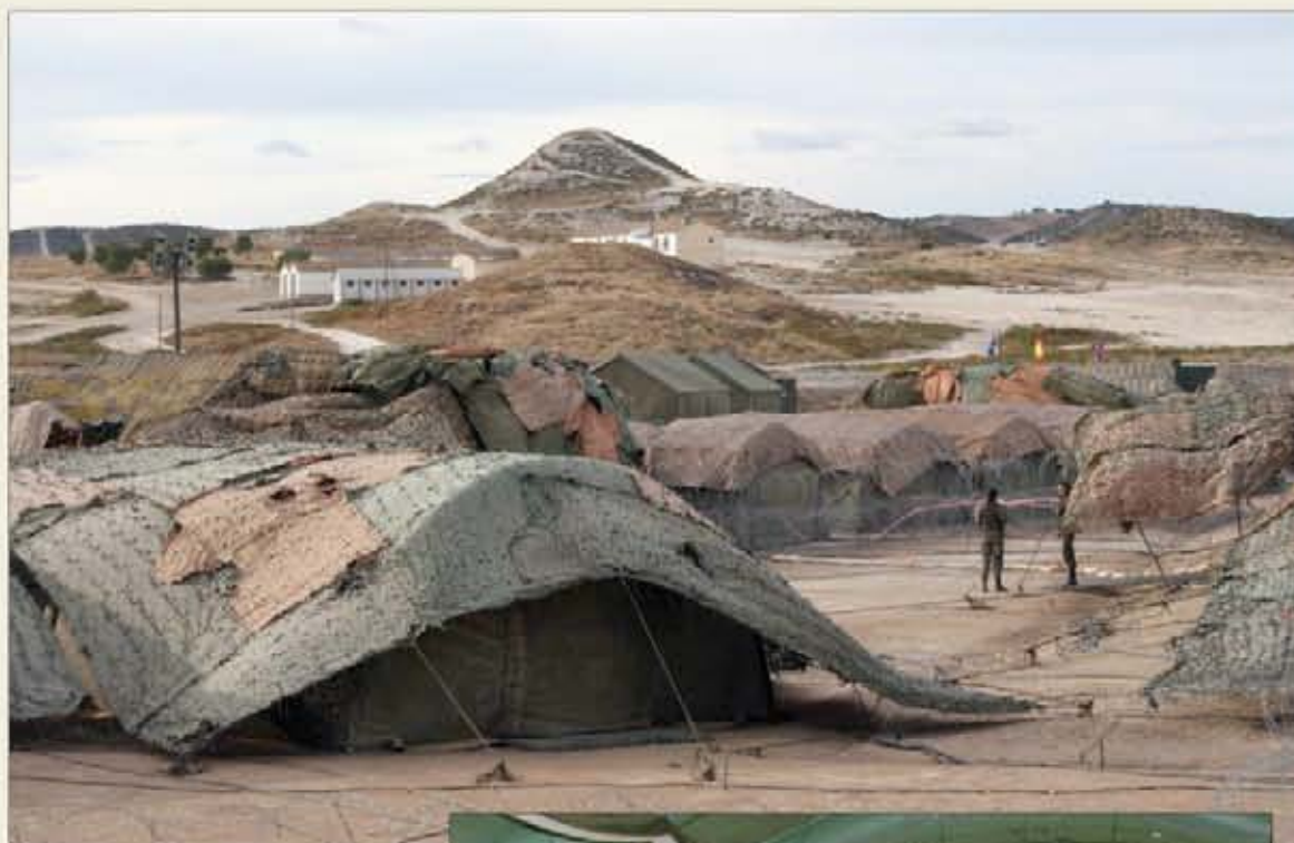
En mayo de 2002 superó la Capacidad Operativa Inicial y seis meses después obtuvo la Capacidad Operativa Plena

En diciembre de 2008 se desarrolló un nuevo concepto orgánico y de los cometidos de los elementos que lo componían. De este modo, se establece un Estado Mayor Nacional y un Estado Mayor Internacional. El primero, ubicado en Valencia, tiene como cometidos principales ser la base para la constitución de un cuartel general de división y llevar a cabo el planeamiento operativo específico nacional. El Estado Mayor Internacional sirve como base para constituir el cuartel general de cuerpo de ejército que requiera la estructura operativa de las Fuerzas Armadas, con su personal na-