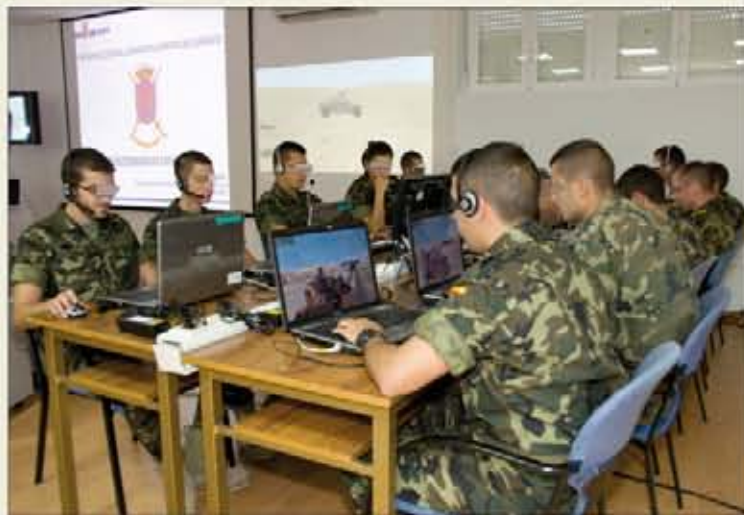
El VBS2, en un ejercicio de interoperabilidad de simuladores

El nuevo simulador —basado en realidad en un juego comer-