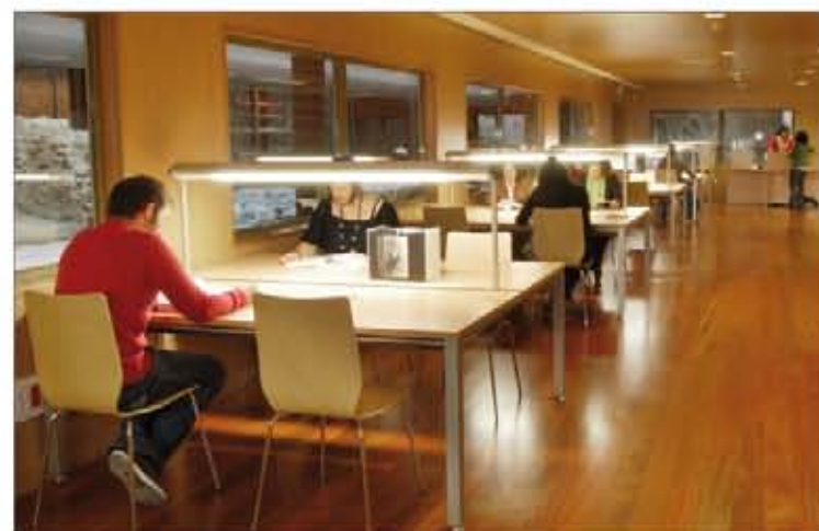
Los documentos solicitados podrán ser consultados en sala

También la Fuerza Terrestre (Sevilla), el Mando de Canarias, y las Comandancias Generales de Ceuta y Melilla celebraron encuentros similares con su Prensa local.