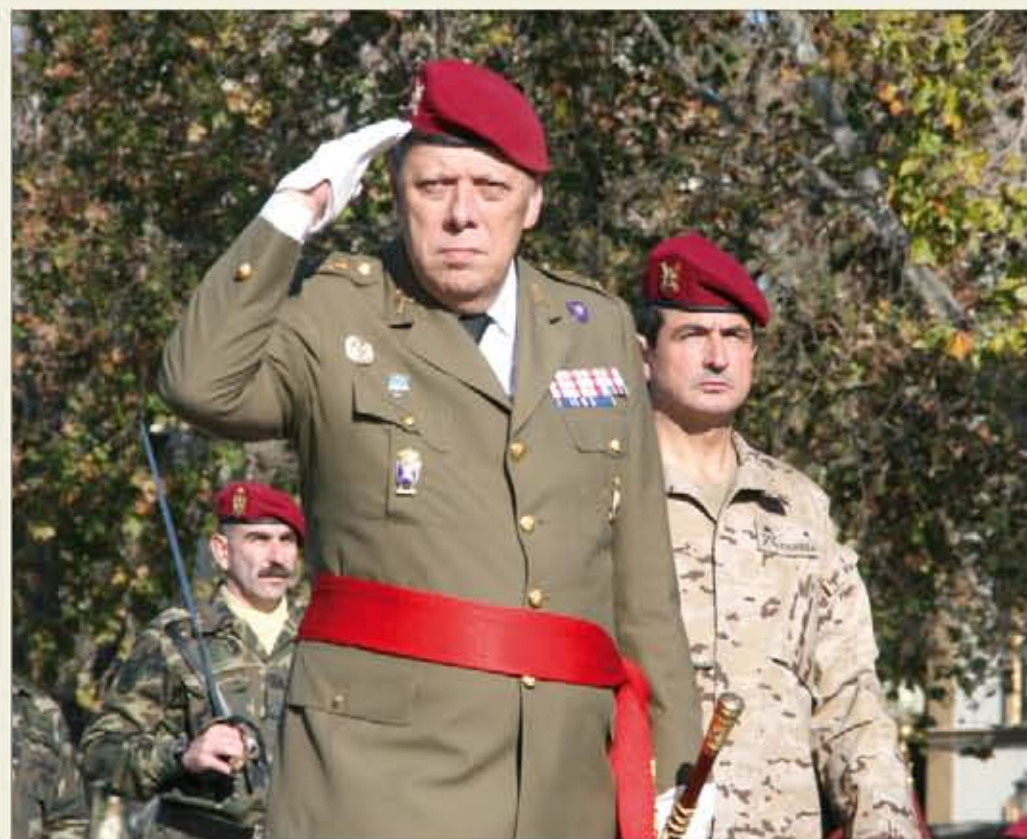
El teniente general Comas y el general Cabeza en el acto de despedida del 10 de enero

Durante el segundo semestre de 2005, al HQ NRDC-SP le correspondió, por turno, participar como Mando Componente Terrestre de la NRF 5. El 8 de octubre de ese año, un devastador terremoto asoló Pakistán y la OTAN activó la NRF en misión de ayuda humanitaria. Por primera vez, fuerzas terrestres de la Alianza eran lideradas por España en una misión, siendo también el primer y único despliegue real de una NRF hasta ahora.