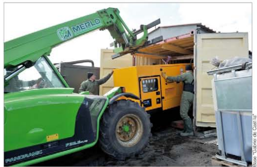
Labores de descarga de los materiales y equipos en la playa

Tanto es así que los dos nuevos grupos electrógenos de 150 kW —más sofisticados (por ejemplo, a través de Internet, se pue-