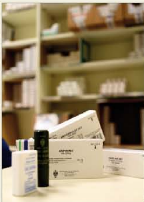
Medicamentos en una farmacia militar

La Resolución Comunicada 02/2011 recoge también, entre otras