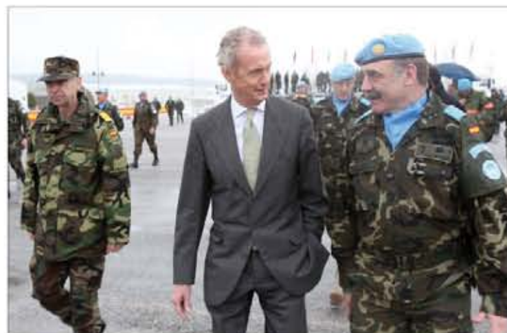
El JEMAD, el ministro y el jefe del contingente español en el Líbano

Las unidades dependientes de la Comandancia General de Ceuta forman el grueso de la XVI rotación española en el Líbano, que desplegará a principios del mes de febrero. Para completar su preparación, participaron en el ejercicio "Aleo", donde se certificó al Cuartel General y la Plana Mayor del Grupo Táctico y se validaron varias secciones. Pág. 11