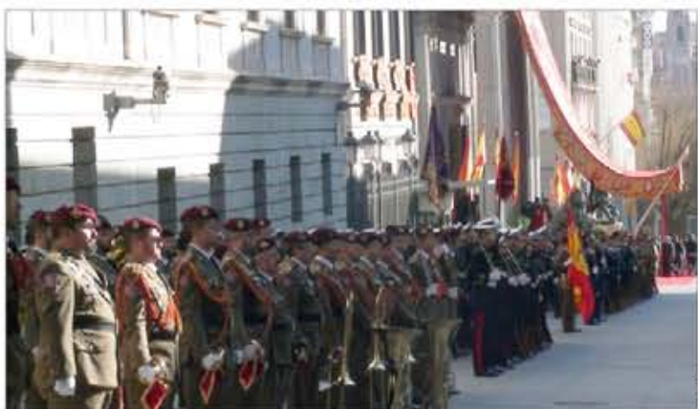
Participaron compañías de los Ejércitos de Tierra y del Aire, y la Armada

Los ejemplares más antiguos conservados en esta Biblioteca datan del siglo XVI, y entre ellos destacan los epitomes de Giovanni Antonelli (ingeniero militar al servicio de Felipe II), de 1560.