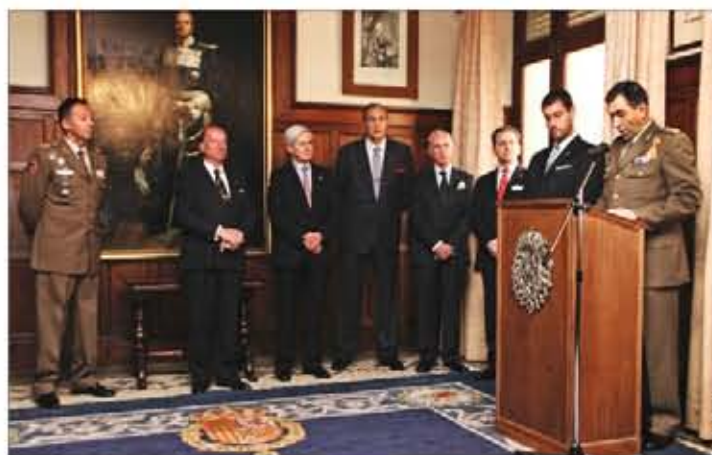
El galardonado (derecha) explicó su investigación