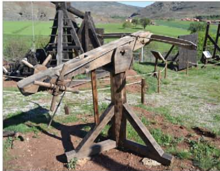
La ballesta de torno fue ampliamente utilizada durante la Edad Media

La poliorcética, el arte de atacar y defender las plazas fuertes, experimentó un gran impulso en el mundo griego, especialmente en la ciudad de Siracusa (Sicilia), donde se inventaron las primeras catapultas de tensión. Poco después aparecerían otro tipo de máquinas, que aplicaban la tecnología de torsión para lanzar objetos a grandes distancias.