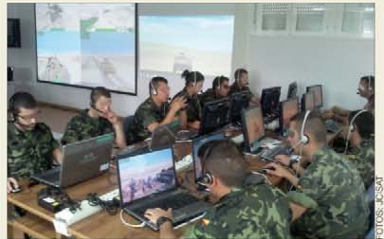
El simulador complementa el adiestramiento de unidades ligeras

En cuanto a los escenarios, este sofisticado "juego de gue-