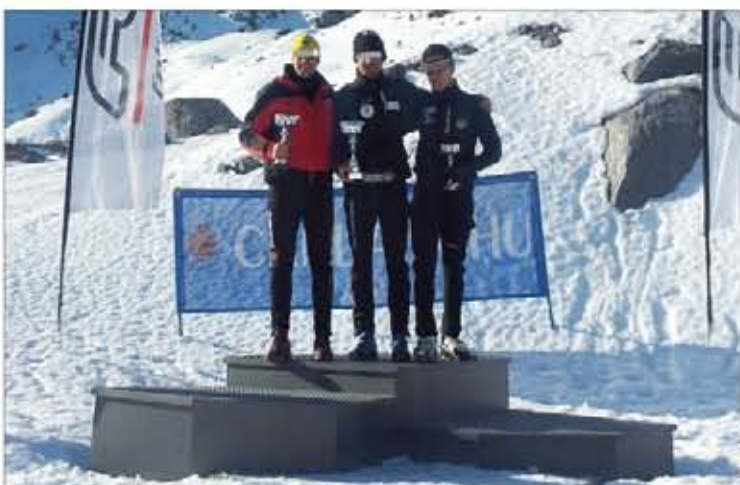
Pódium del Trofeo Candanchú, disputado en el Pirineo aragonés