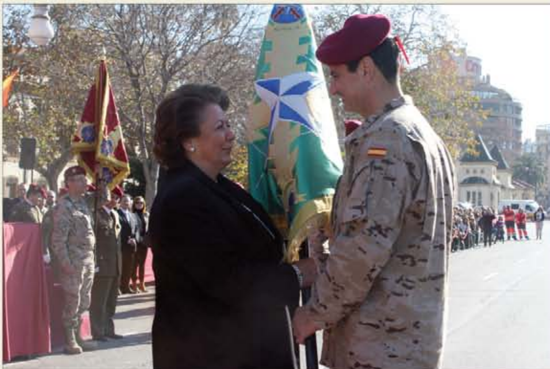
La alcaldesa de Valencia entregó el guión de combate al general Cabeza

Por primera vez en su historia, el Cuartel General Español de Despliegue Rápido de la Alianza Atlántica (HQ NRDC-SP) participa como unidad en la misión de Afganistán, contribuye con una representación importante de personal al Mando Con-