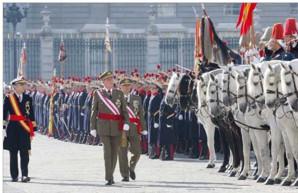
El Rey presidió la parada militar en la plaza de la Armería del Palacio Real

El ministro de Defensa, Pedro Morenés, también hizo hincapié en este aspecto durante su intervención, que comenzó con un recuer-