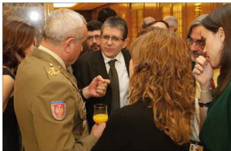
Los periodistas charlan distendidamente con el general de ejército Coll

Dentro del balance que el general de ejército Coll ofreció de 2011, destacó la importante aportación del Ejército a las misiones en el exterior, la preparación de las unidades para afrontarlas con éxito, el recuerdo a los nueve soldados fallecidos —«porque todos somos soldados; el soldado es la base de nuestro Ejército y su más preciado tesoro», puntualizó—; también ha-