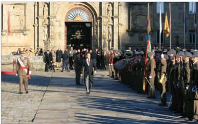
El delegado del Rey pasa revista a la formación