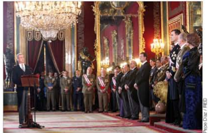
El nuevo ministro de Defensa vivió su primera Pascua Militar

El discurso del Rey, en el que incluyó su felicitación a las Fuerzas Armadas, cerró el acto central de la Pascua Militar que se celebra cada 6 de enero en el Palacio Real, en Madrid.