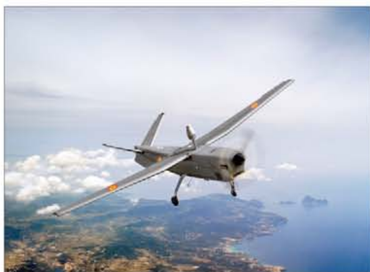
Prototipo del modelo ATLANTE en el que se está trabajando

Las perspectivas de futuro en el terreno de los UAS están puestas en el programa ATLANTE (Avión Táctico de Largo Alcance No Tripulado Español), que está siendo desarrollado por la industria nacional (EADS-CASA)