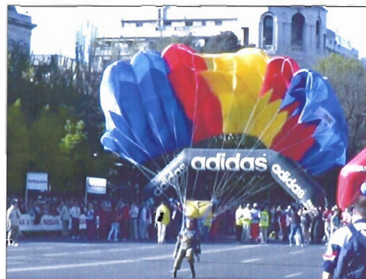
Tras el salto paracaidista dio comienzo la carrera popular

Es ya una tradición que los miembros de la Brigada participen en la