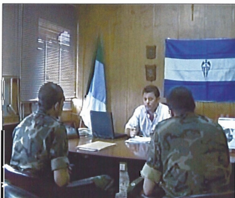
Transcurso de la entrevista con el jefe de la Policía de un país ficticio

En este marco de actuación, durante el ejercicio se pusieron en práctica técnicas de entrevistas, de enlaces de Inteligencia, reconocimientos móviles, vigilancias y contravigilancias, interrogatorios, operaciones de fuentes de información, realiza-