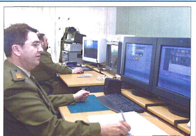
La Subdirección cuenta con equipos de edición y vídeo