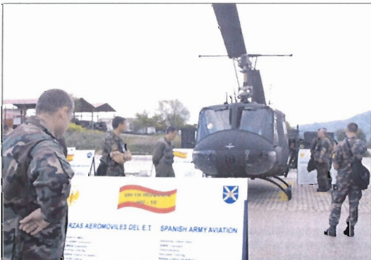
En las FAMET, los delegados vieron los distintos helicópteros del Ejército