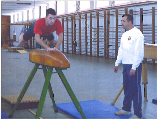
Los alumnos compaginan la preparación física con la cultural, igualmente importantes a la hora de realizar las pruebas de acceso

Cada día, él y sus compañeros se enfrentan a asignaturas como matemáticas, historia o inglés. Esta última materia es una de las que más puntúa en las pruebas de acceso, por lo que su preparación es importante para los alumnos. «El inicio del curso es especialmente difícil porque hay mucha diversidad en cuanto al nivel de conocimiento del idioma,