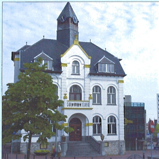
El Ayuntamiento de Brunssum es uno de los edificios más representativos

Por su parte, Brunssum es una vieja población que pasó de ser una tranquila parroquia a un municipio orientado al plano internacional. La industria minera impulsó este crecimiento, a mediados del siglo XX, y también influyó en él la ubicación del Cuartel General Regional (RHQ) de las Fuerzas Aliadas del Norte de Europa (AFNORTH). Esta ciudad es muy conocida por tener un área amplia, ideal para hacer deporte, en la que predomina el bosque. Al igual que en el resto del país, se hablan el holandés —hay distintos dialectos— el alemán, el francés y el inglés.