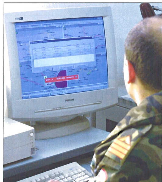
Un sistema informático permite tener controlados y localizados los trenes

Para el embarque del material militar se desplaza hasta la estación de salida un Oficial de Embarque, que es quien asesora a la unidad transportada de todo lo referente a la carga, amarres, comodidad de los viajeros y sirve de enlace entre ésta y RENFE.