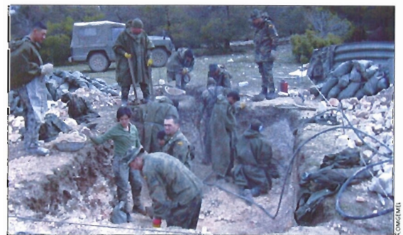
Los Zapadores construyeron refugios de entidad pelotón

En el "Doble Llave-04" se trataba de obtener Inteligencia Humana, que, según la Doctrina para el Empleo de las Fuerzas Terrestres, es aquella que se deriva de la información obtenida y facilitada por fuentes humanas.