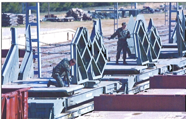
El muelle testero TRANSFER permite embarcar el material militar en la plataforma

Asimismo, hay que destacar el puente para ferrocarril MAN SE —conjunto de piezas atornillables que permiten numerosas posibilidades de montaje dependiendo del obstáculo que se quiera salvar—, y el muelle testero TRANSFER. Este último consiste en una rampa que se lanza desde una plataforma y que se pliega sobre la vía, permitiendo el embarque y desembarque de vehículos de ruedas o cadenas en cualquier lugar de la vía. Este material está homologado por la OTAN.