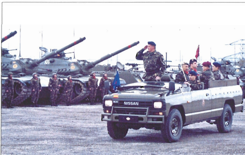
Don Juan Carlos pasó revista al Batallón de Infantería de Carros de Combate "Flandes"

La Brigada "San Marcial" presentó sus carros M-60