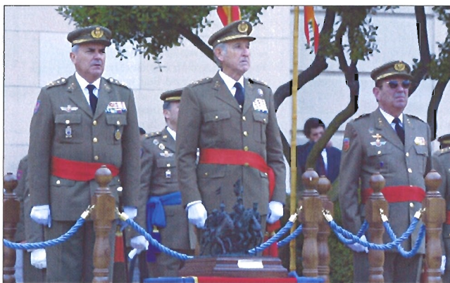
El JEME y el teniente general distinguido con el premio de Caballería (situado delante)

mer lugar, el honor que suponía para los componentes del centro la presencia en el acto de familiares del teniente coronel Primo de Rivera, así como la del teniente general Esteban, galardonado con el premio en la primera edición. Continuó su discurso recordando la gesta realizada por el Regimiento de Cazadores "Alcántara" durante la retirada de Annual, en julio de 1921, y que motivó la