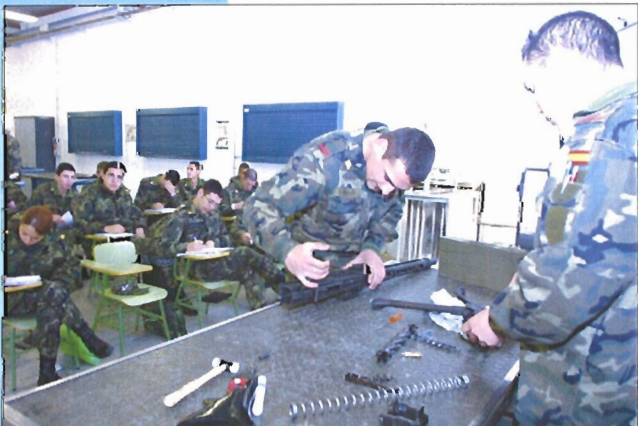
Uno de los cursos de mantenimiento es el de Armamento y Material

Es el centro docente más joven de las Fuerzas Armadas y se encarga de todas las enseñanzas de formación y perfeccionamiento relacionadas con los Especialistas y la Logística. En