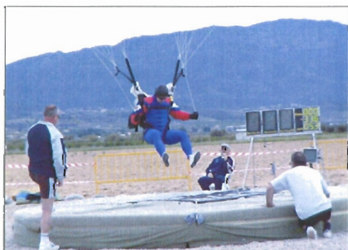
La prueba de precisión es una de las más difíciles de los campeonatos