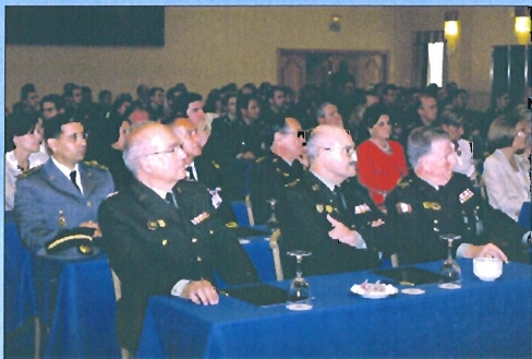
Las VII Jornadas de Farmacia Militar congregaron a 150 farmacéuticos