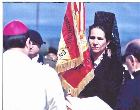
La Infanta expresó su compromiso con el Regimiento