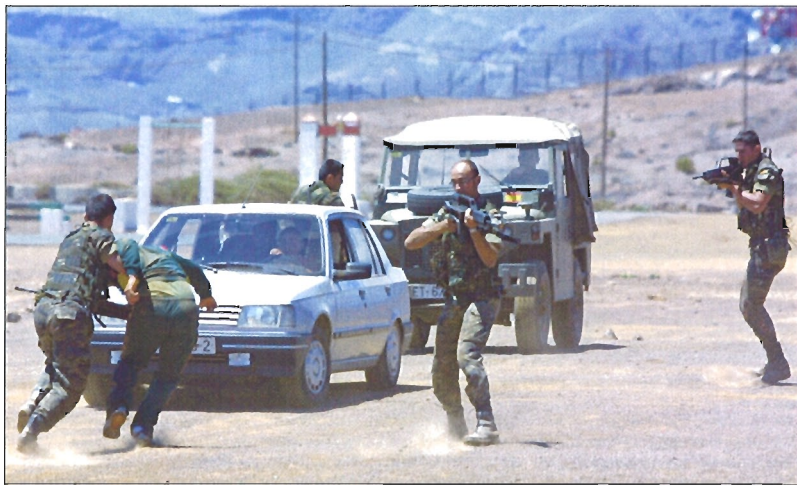
En una de las exhibiciones se mostró cómo reaccionar ante el ataque a una autoridad