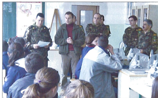
Con el "Pupil Workshop" se trata de educar en un ambiente de tolerancia

Asimismo, la ASPFOR VII pone los medios para realizar sus propias acciones de cooperación cívico-militar. De este modo, recogió aportaciones voluntarias de sus miembros y adquirió 105 árboles para plantarlos en la Escuela Merhab-U-Din de la capital afgana.