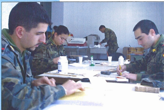
La especialidad de Cartografía e Imprenta abarca la preimpresión, la impresión y la encuadernación