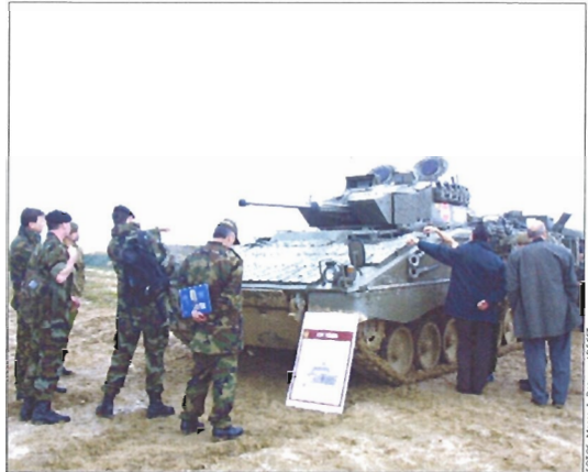
Uno de los materiales presentados fue el Pizarro de puesto de mando