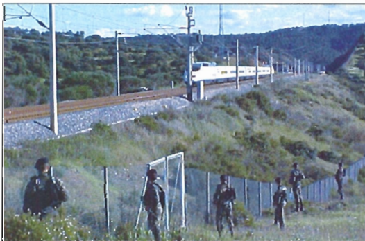
Personal militar vigila las vías del AVE en diversos trayectos

Durante las tareas de vigilancia, además de la detección de personal y de vehículos sospechosos —de lo que siempre tendrá conocimiento la Guardia Civil— el personal militar ha impedido la propagación de un incendio (se avisó a los bomberos), y un robo y una agresión a ciudadanos, poniendo a disposición de las Fuerzas y Cuerpos de Seguridad del Estado a los presuntos delincuentes.