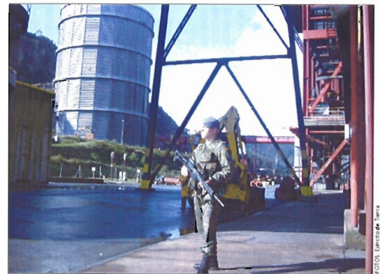
El Ejército custodia numerosos puntos de suministro de energía

Esta etapa se puso en marcha, el 2 de abril, tras la aparición de un paquete cargado de explosivos en la vía del AVE Madrid-Sevilla a su paso por la localidad toledana de