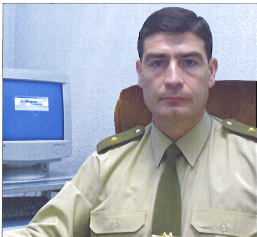
En el Ejército puede compatibilizar sus dos pasiones: la Psicología y el deporte

Asimismo, tiene claro que sus destinos dentro del Ejército han in-