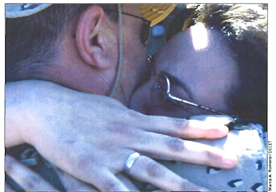
Los llantos, abrazos y besos fueron los protagonistas de la mañana

El primero en bajar las escaleras fue el general Coll y, tras él, el resto del contingente, hasta un total de 259. El JEME les dio la bienvenida y les agradeció su labor en el país árabe. El