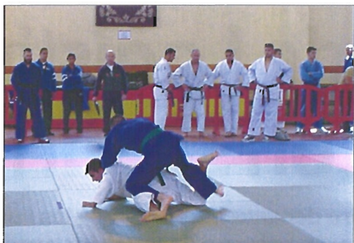
El polideportivo de la Academia de Infantería acogió la competición