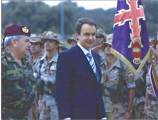
José Luis Rodríguez Zapatero pasó, por primera vez como presidente del Gobierno, revista a las tropas y felicitó a los condecorados con las Cruces del Mérito Militar

De lo vivido aquella mañana, destacaron: las 19 salvadas de la batería de honores — con obuses de 105/14 — cuando llegó el presidente del Gobierno, los discursos del ministro de Defensa y del general de la "Plus Ultra", el acto de homenaje a los caídos, con especial recuerdo a los fallecidos desde el inicio de la misión en Iraq, la foto del presidente, tras el desfile, con los mandos de unidades — hasta nivel compañía — de la BMN. Finalizado el acto, Rodríguez Zapatero dirigió a los presentes unas palabras en las que mostró su orgullo por el comportamiento de nuestras tropas.