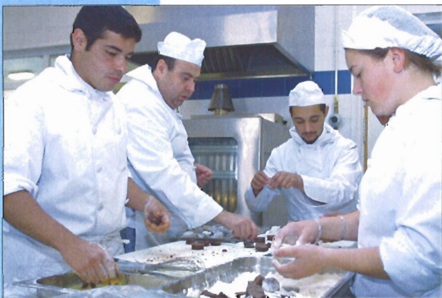
En Hostelería, los alumnos aprenden cocina, pastelería y sala (servicio en las mesas)