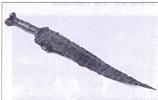
Armamento celtibérico de la necrópolis de Uxama (Osma, Soria)

El conseguir una Sanidad Militar única, como un todo, fue una de las principales conclusiones que se obtuvieron en el seno de las VII Jornadas.