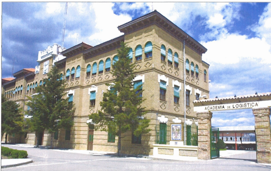
La Academia de Logística es el centro docente más joven de las Fuerzas Armadas