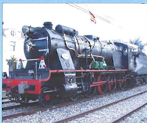
"La Vaporosa" es la locomotora de vapor más antigua de España

Actualmente, el Regimiento tiene a la mayoría de sus componentes formando parte de la Fuerza Española en Afganistán (ASPFOR) VII, que regresarán de su misión el próximo mes de mayo.