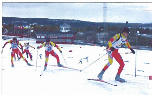
Las patrullas del Ejército se enfrentaron a equipos de 24 naciones