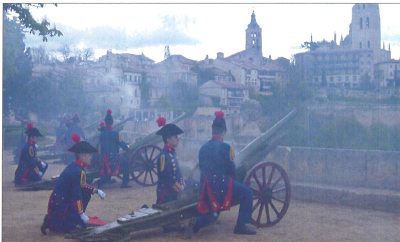
Caballeros alféreces cadetes rindieron honores ataviados con uniformes de época

La gesta del Dos de Mayo marca una de las páginas más gloriosas de la historia militar española. Corría el año 1808, cuando el pueblo de Madrid se sublevó contra las tropas francesas. La muchedumbre se dirigió al Parque de Artillería de Montecelón, que era custodiado por el capitán Daoíz, para conseguir armas con las que enfrentarse a los invasores. Hasta allí se dirigieron también el capitán Velarde y el teniente Ruíz con una compañía. El pueblo de Madrid mantuvo una intensa batalla, luchando hasta el extremo contra los franceses. Los capitanes de Artillería Velarde y Daoíz murieron heroicamente en la contienda. El primero, abatido por las armas; el segundo, atravesado por las bayonetas enemigas. Desde entonces existe una tradición artillera, denominada Lección del Dos de Mayo , que pretende rendir homenaje a estos dos capitanes artilleros.