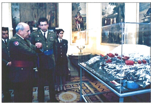
El jefe de la Campaña explica al JEME la distribución de la base

El día 21 de abril, la BMN fue sustituida por un Contingente de Apoyo al Repliegue, bajo mando del general Muñoz. Esta unidad — sobre la base de la Brigada "Rey Alfonso XIII", II de la Legión, reforzada con unidades de la Fuerza de Maniobra — está llevando a cabo misiones de reconocimiento y protección y ya ha iniciado la secuencia de repliegue.