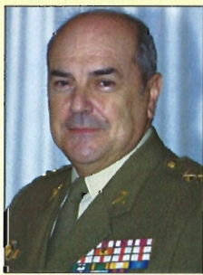
General de ejército Alejandro

Entre sus últimos destinos están la División de Planes del Estado Mayor Conjunto de la Defensa, la Escuela Superior del Ejército —donde fue nombrado Profesor Principal— y las direcciones de la Academia de In-