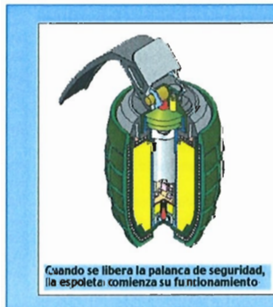
Cuando se libera la palanca de seguridad, la espoleta comienza su funcionamiento.