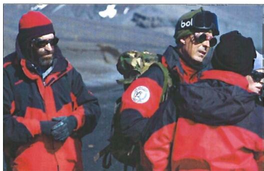
La expedición española continúa con sus proyectos científicos en la Antártida

Los investigadores desarrollan sus proyectos en el continente blanco con una dedicación absoluta. «Hay