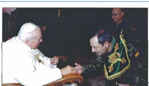
El coronel Gutiérrez entregó al Papa una reproducción de un guión de la FAR

Además, los militares han montado un campamento eventual para que los investigadores civiles puedan observar el comportamiento del pingüino barbijo durante todo el día.