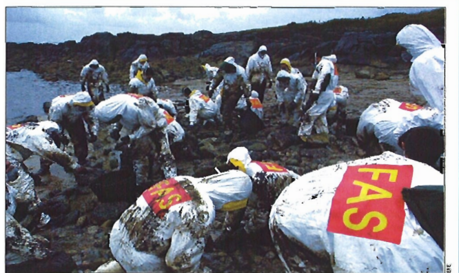
Cientos de militares desarrollan tareas de limpieza en el litoral gallego y asturiano

Asimismo, otros 220 militares — procedentes de la Brigada de Infantería Aero-transportable y de los Mandos Logísticos Regionales — colaboran en el apoyo logístico a las autoridades civiles. Siguen desplegados en la zona cuatro módulos de comedor, cuatro tiendas modulares, un aljibe y dos equipos de duchas. Además, están po-