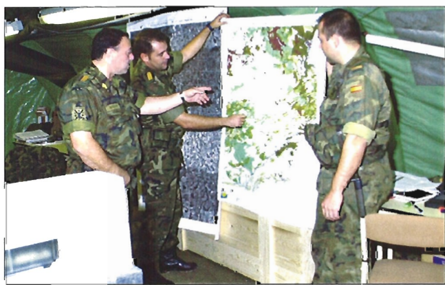
La Unidad de Apoyo Geográfico fue presentada oficialmente en el mes de noviembre

En cuanto al material con el que está dotada la UAGEO, «disponemos de buenos y modernos equipos ubicados en shelters para facilitar su transporte», afirma el comandante Cortés, quien cita algunos de ellos: escáner y multicopista en color, equipos multifunción con fax, fotocopiadora e impresora, y ordenadores de gran potencia. Además, se está a la espera de aumentar la dotación de la unidad para mejorar sus capacidades. De hecho, está previsto adquirir una potente máquina de impresión y dos cabinas —una de ellas expandible en la que se introducirán los equipos