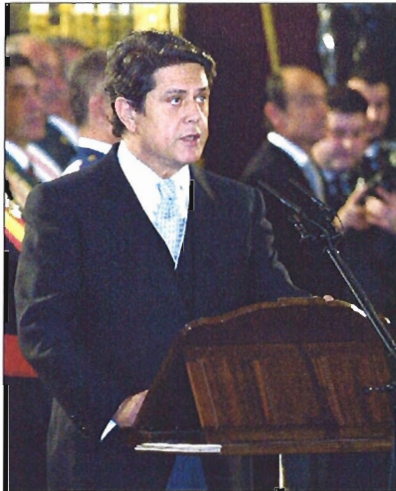
El terrorismo y la catástrofe originada por el petrolero Prestige fueron los temas centrales de los discursos pronunciados por Su Majestad el Rey y el ministro de Defensa

Tras abandonar la plaza de la Armería, los Reyes y el Príncipe Felipe se dirigieron — ya en el interior del Palacio — hacia la Saleta de Gas-