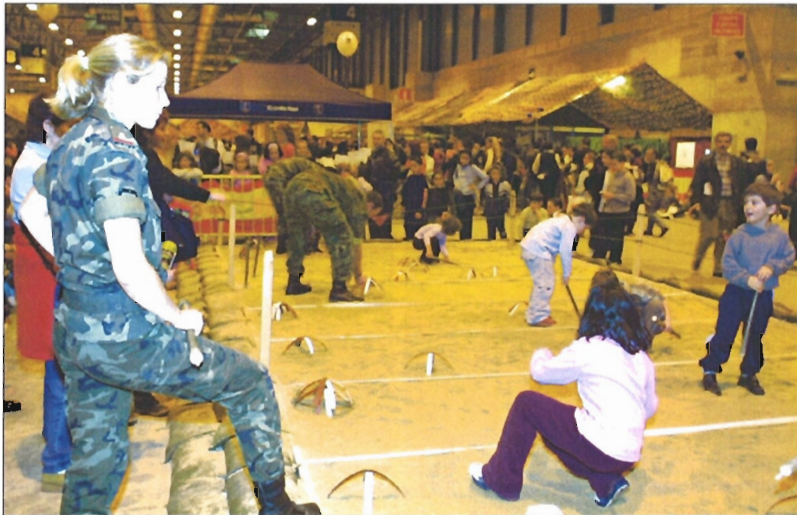
En el stand de la Academia de Ingenieros los niños buscan minas en cajones de arena

«Al menos 3.000 personas diarias» Nueve unidades han desplegado personal y material en los 2.253 metros cuadrados concedidos al Ejército de Tierra: las Brigadas Paracaidista (BRIPAC) y Acorazada (BRIAC), las Fuerzas Acomodadas del Ejército de Tierra (FAMET), la Junta Regional de Educación Física, la Academia de Ingenieros (ACING), el MATRANS, el Regimiento de Artillería Antiaérea (RAAA) nº 71, la Agrupación de Apoyo Logístico