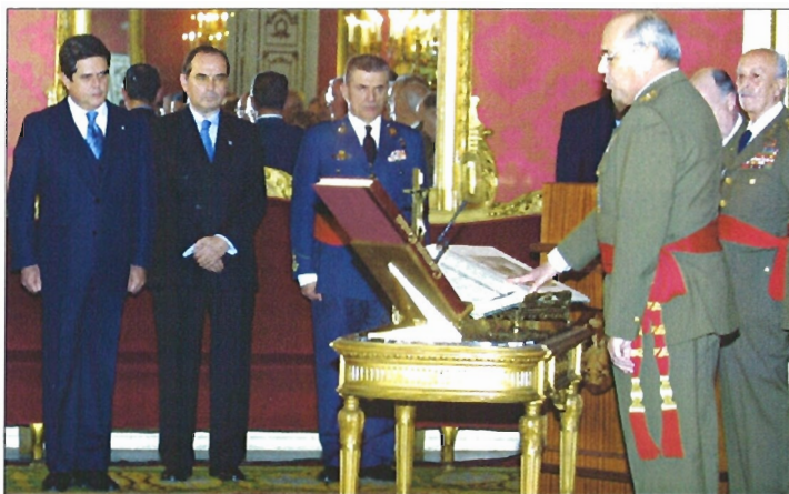
El general Alejandro ha jurado su cargo en un acto presidido por el ministro de Defensa

El general trasladó su especial agradecimiento a todos los componentes del Ejército, militares y civiles, que le han demostrado su disciplina, lealtad y entusiasmo. «Con el esfuerzo de todos hemos podido conseguir este Ejército de hoy. Un Ejército —añadió— homogéneo, verdaderamente sólido, eficaz y operativo, y que, a pesar de las carencias que aún tiene de personal y