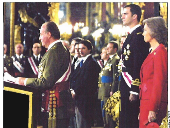
La Reina y el Príncipe de Asturias acompañaron al Rey en la celebración de la Pascua

fensa. Así, durante su alocución destacó la cooperación prestada por las Fuerzas Armadas en las costas gallegas y cantábricas, como consecuencia del hundimiento del petrolero Prestige , el azote del terrorismo nacional e internacional y el primer año de profesionalización. «Quiero resaltar —dijo— la importancia de vuestra eficaz colaboración para hacer frente a calamidades o situaciones de emergencia en todos los rincones de la geografía española, como actualmente ocurre con la catástrofe originada en la costa de Galicia». Pág. 5