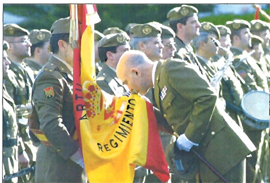
El coronel de la Cruz, jefe del RAAA nº 76, fue el último en besar la Bandera

Asimismo, el teniente general felicitó a los artilleros por el trabajo desarrollado y destacó el hecho de que la unidad en sus últimos días ha albergado a 800 personas que realizaban labores de