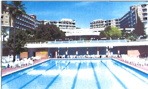
Residencia militar "Castañón de Mena", ubicada en Málaga

En cuanto al grupo 2 o (militares profesionales de tropa), continúan las ofertas de años anteriores: las residencias "Castalia", en