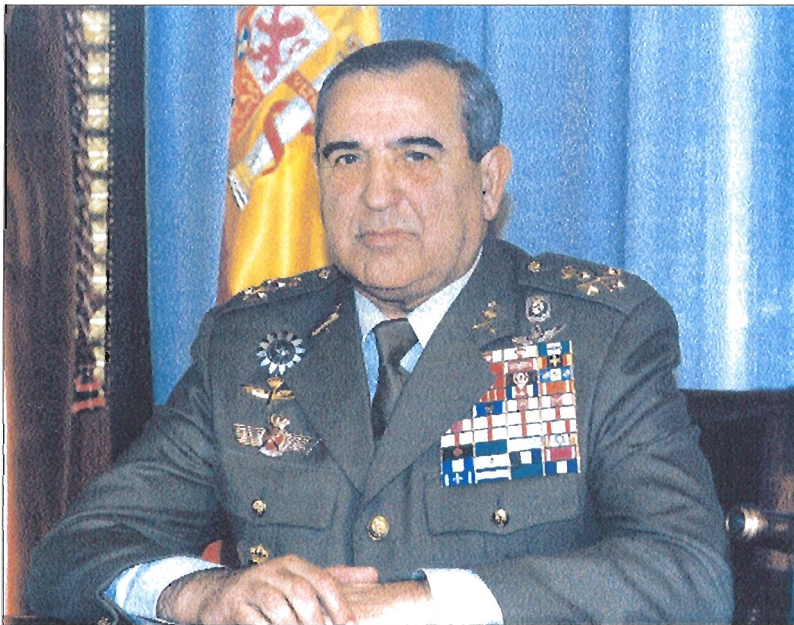
«La total profesionalización ha supuesto la mejora más importante de los últimos años para el Ejército»

La norma fundamental que se ha seguido ha sido la de sustituir la cantidad por la calidad, con el fin de mantener la capacidad de disuasión, es decir, tener un Ejército