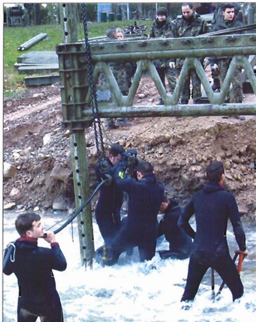
En tres días los Ingenieros montaron un puente PF-50 sobre apoyos fijos

La importancia de esta construcción es tal que sin el puente el casco antiguo se hubiera incomunicado y la actividad comercial paralizado. Además, la alcaldesa destacó que a un trabajo rápido había que añadirle la eficacia de los soldados —han tardado tan sólo tres días en montarlo—, así como la perfecta convivencia entre los militares y la población civil. «Es otra forma de dar a conocer este nuevo Ejército con el que contamos todos los españoles. Siempre impresiona ver a gente tan joven trabajando», comentó. Por su parte,