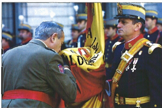
El general Pardo de Santayana selló su despedida con un beso a la Bandera

Es Piloto de Helicópteros y de Ala Fija (Estados Unidos), diplomado de Estado Mayor en España y cum laude en la Escuela de Mando y Estado Mayor de Estados Unidos. También en este país estuvo en la Escuela de Artillería de Campaña, la 1ª División Acorazada y el Centro de Artillería Antiaérea, donde hizo el curso de misiles SAM, así como en Redstone Ar-