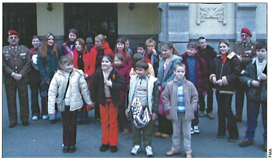
Miembros de la Fuerza de Maniobra recibieron al grupo de niños bielorrusos

Esta iniciativa nació en el año 1996, cuando un grupo de 38 niños con edades comprendidas entre 7 y 9 años, y que estaban afectados por el desastre de Chernóbil, viajaron a nuestro país. Desde entonces, las solicitudes se han multiplicado y cada año son acogidos por las mismas familias, durante dos meses en verano y uno en invierno. «Hemos conseguido que