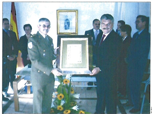
Durante el acto el alcalde reconoció el apoyo del Ejército

Los hechos de Armas en los que ha participado esta unidad a lo largo de su historia la hicieron merecedora de la Cruz Laureada de San Fernando, cuya Corbata lleva orgullosa en su Bandera.