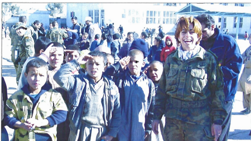
Los militares españoles devolvieron la alegría a los niños afganos

Para empezar el día se proyectaron varias películas de dibujos animados. «Había que ver sus caras y las de sus profesores, ya que por primera vez veían cine», recordó el te-