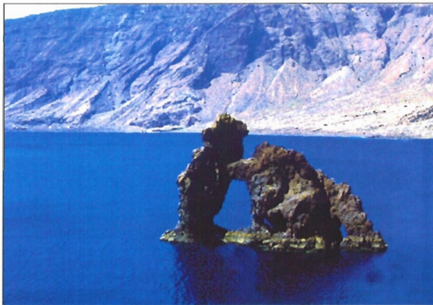
La isla de El Hierro cuenta con más de 100 kilómetros de costa

El Hierro es una isla mágica, y forman parte de sus encantos el manantial Pozo de la Salud (con grandes facultades curativas), y dentro de su fauna el lagarto gigante de Salmor, una especie protegida que constituye uno de los endemismos del archipiélago