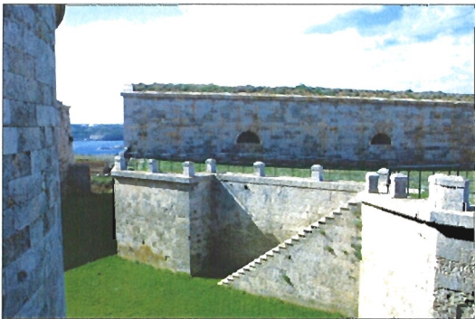
La Fortaleza de la Mola fue construida para defender el Puerto de Mahón

Otro elemento destacable en la fortaleza son los dos cañones Vickers-Armstrong de 38,1cm, el material artillero más potente que ha existido en España. Están situados en el borde superior del acantilado de la Mo-