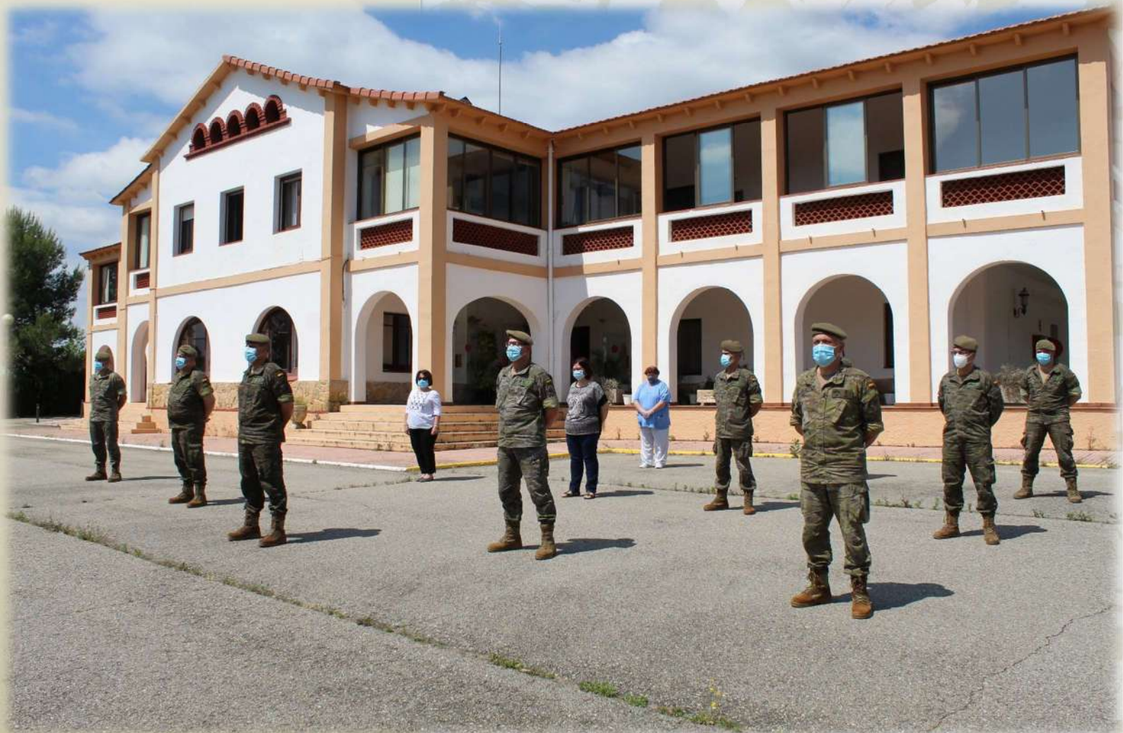
Instantánea que refleja el minuto de silencio guardado en el Edificio de Plana Mayor de Dirección.

Desde la Academia queremos transmitir todo nuestro respeto y más sentido cariño y pésame a cuantos han perdido a familiares y seres queridos.