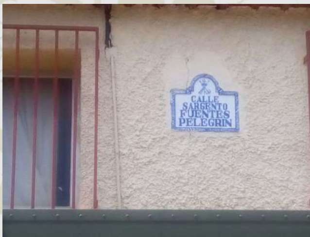
Monolito de homenaje a los caídos del GL II y placa de la calle del sargento Fuentes Pelegrín