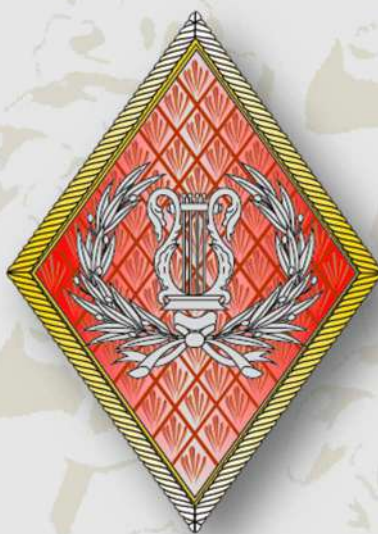
Rombo del Cuerpo de Música Militar

Con la ley 17/1989, el Cuerpo de Músicas Militares del Ejército se integró en la Escala Básica del Cuerpo de Músicas Militares de los Cuerpos Comunes, junto a los de la Armada y el Ejército del Aire, en donde se encuentran en la actualidad.