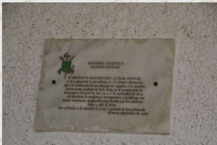
Placa de homenaje al suboficial Munar

En septiembre de 2006 se da nombre al edificio de la PLMM del GL II y se coloca una placa de homenaje al “Suboficial Munar Munar”