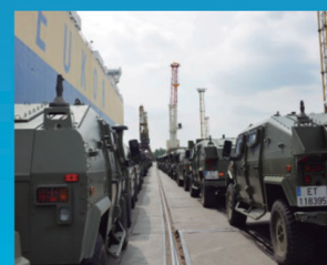
VJTF/eNRF Stand-by Brilliant Jump 16