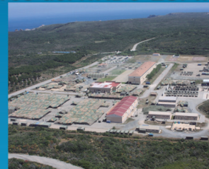
Certificación JTF(L) HQ Trident Jaguar 14