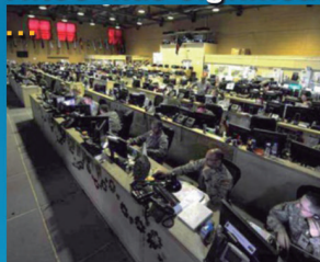
ISAF Joint Command (Afghanistan), 2012