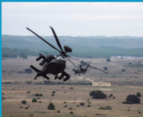
Certificación eNRF/LCC Trident Juncture 15