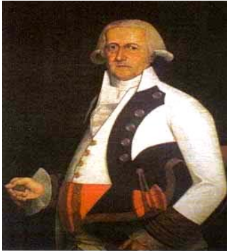
General Gutiérrez (Museo Histórico Militar)