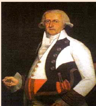
General Gutiérrez (Museo Histórico Militar)