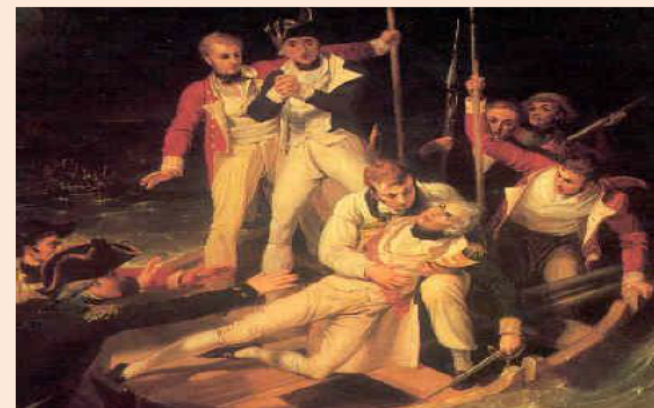
Copia de “Horacio Nelson herido” de Richard Westall (Museo Histórico Militar de Canarias – Fuerte de Almeyda)