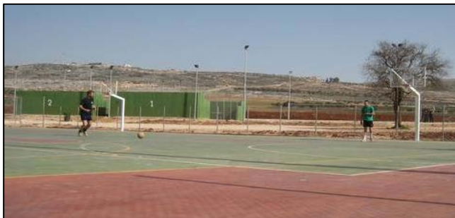
Campos de deporte en Marjayoun

Anímale a que recopilen información de periódicos para ofrecérselos a su padre/madre al regreso.