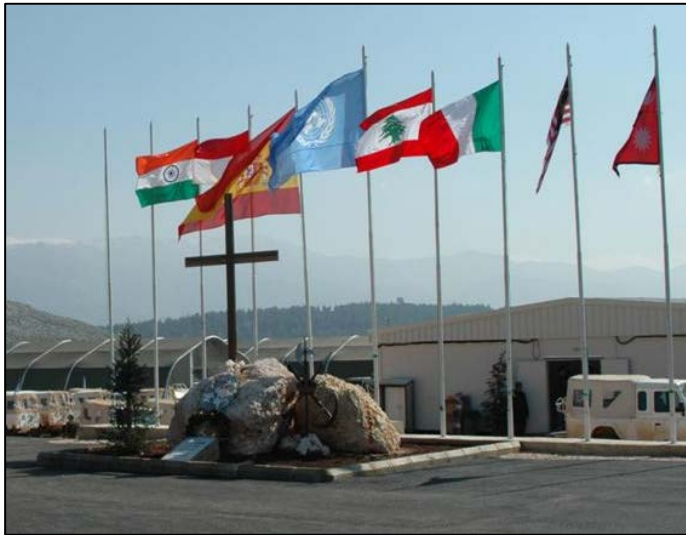
Zona principal del patio central de armas en la Base Miguel de Cervantes (UNP 7-2)

La duración de la misión está prevista que sea de seis meses, teniendo previsto el despliegue a partir del 12 de mayo y el regreso a España en la segunda quincena de noviembre.