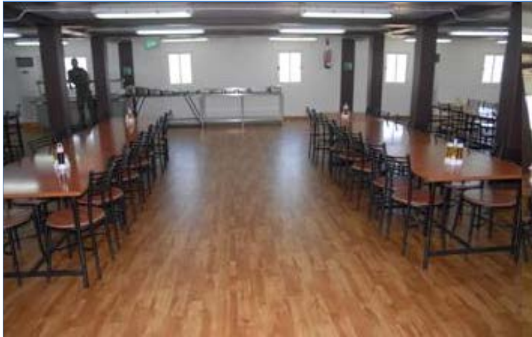
VISTA DEL COMEDOR