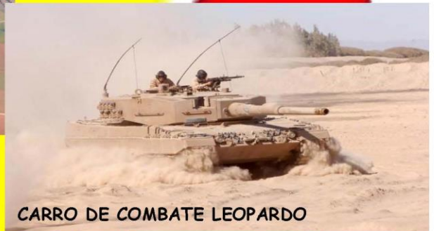
CARRO DE COMBATE LEOPARDO

EXPOSICIÓN DE MATERIALES Y EXHIBICIONES DINÁMICAS