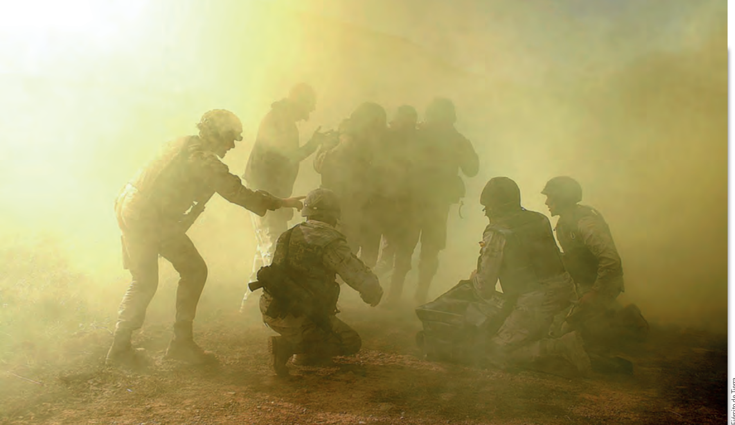
Ejército de Tierra