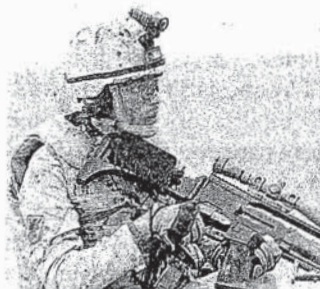
Uno de los militares que participó en las maniobras.