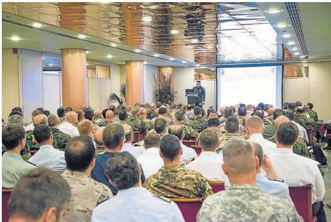
El plenario de los 170 militares de más de treinta países, ayer en el Hotel Boston. JAVIER ROJAS

La OTAN ha invitado a sus 19 miembros para intervenir en los ejercicios, como a los 10 países