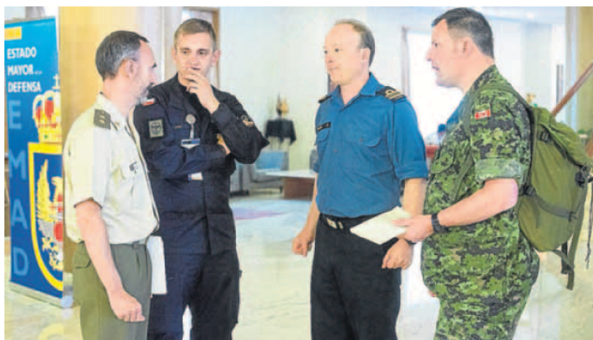
Militares de la OTAN de varios países, ayer en el Hotel Boston, en las jornadas preparativas.

Los ejercicios Trident Juncture, calificado como los más im-