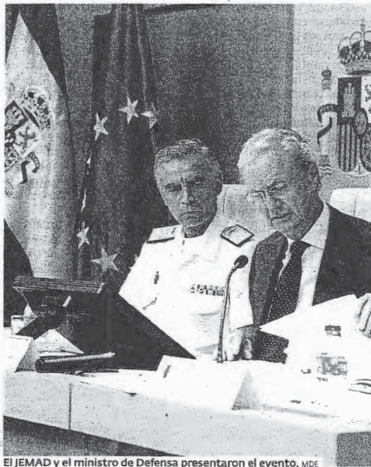
El JEMAD y el ministro de Defensa presentaron el evento. MDE

El ejercicio Trident Juncture es una demostración de fuerza de