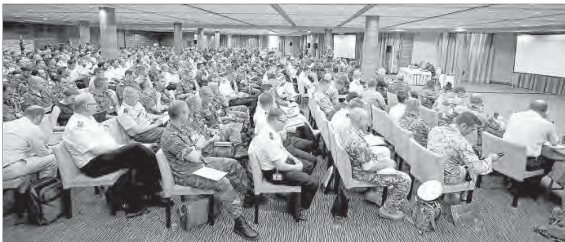
Reunión de coordinación del ejercicio «Trident Juncture 2015» ayer en Valencia.