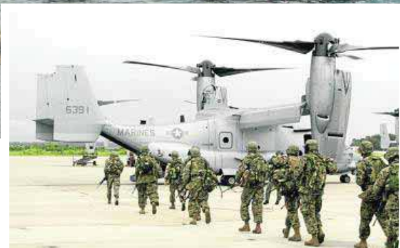
Embarque de marines de una aeronave 'Osprey'.

Dichas instalaciones recibirán, en los próximos días, a nuevos componentes de la Legión hasta completar una cifra cercana a los 200 integrantes en los que se incluyen, además de los equipos de instructores, una Unidad de Protección española.