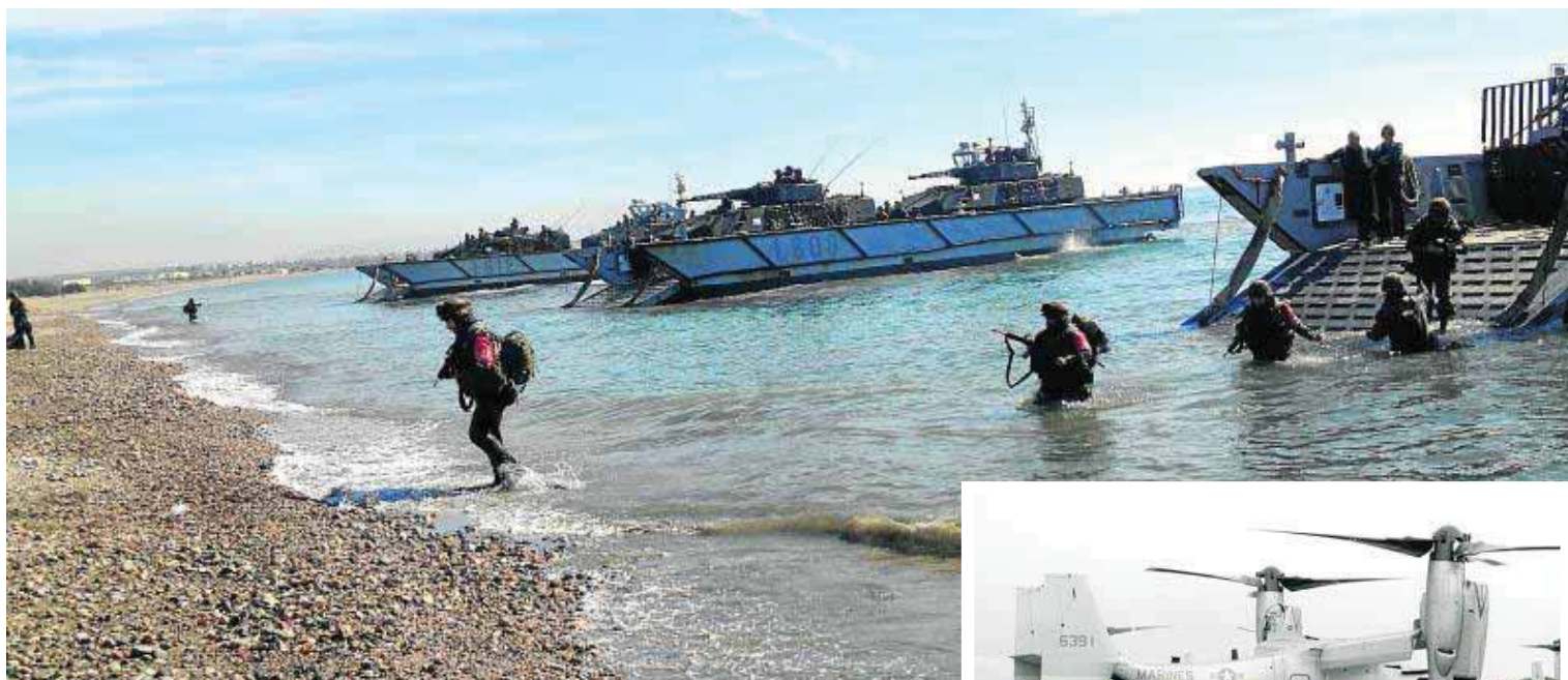
Desembarco de la Infantería de Marina española en la playa almeriense de El Perdigal.