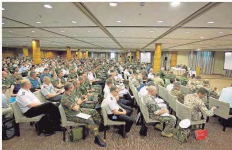
Imagen de los militares asistentes a la Conferencia Final de Coordinación del «Trident Juncture 2015»