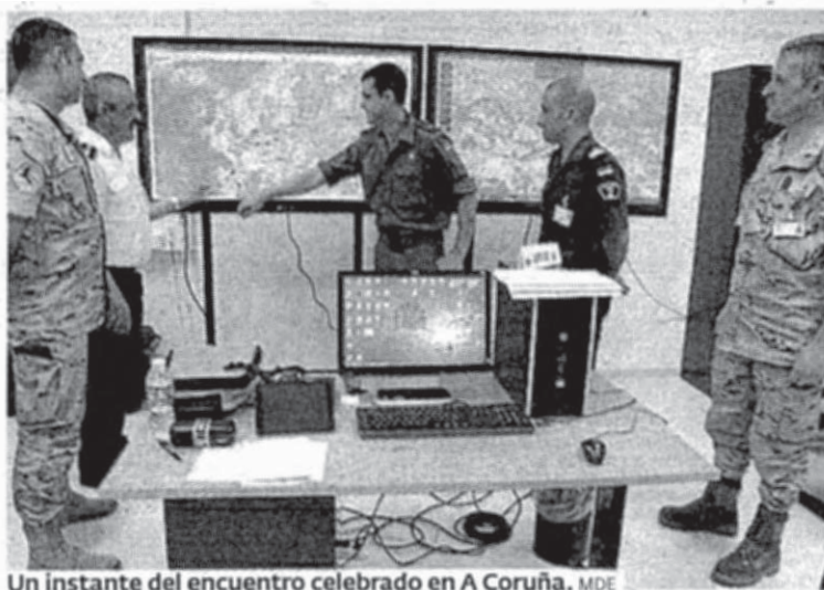
Un instante del encuentro celebrado en A Coruña. MDE