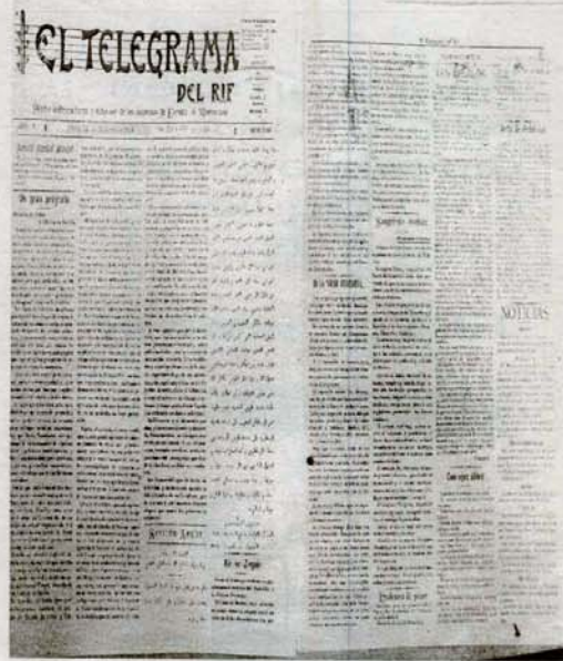
Referencia en El Telegrama del Rif de 1906

En el año actual de 2013, para señalar la finalización del Ramadán, se ha retomado esta colaboración y, a través del disparo del cañón que ayer se realizó a las 21:45 horas desde Rostrogordo se puso en conocimiento de toda la población musulmana y, por extensión, de toda la melillense que han concluido los treinta días de ayuno previstos en el Corán, a contar desde que termina el octavo mes, Shaaban".