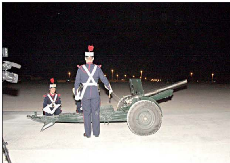
El disparo del cañón se produjo ayer a las 21,45 horas en Rostrogordo

Pero sin embargo fue posteriormente, en junio de 1918, cuando se tienen referencias