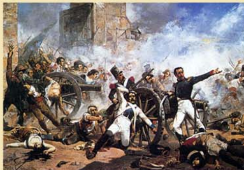
Defensa del Parque de Artillería de Monteleón. Joaquin Sorolla

La ocupación de la Península Ibérica por los Ejércitos de Napoleón daría lugar a la Guerra de la Independencia de 1808 a 1814. España fue el escenario de la primera derrota del ejército imperial francés.