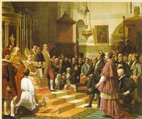
Juramento de las Cortes de Cádiz