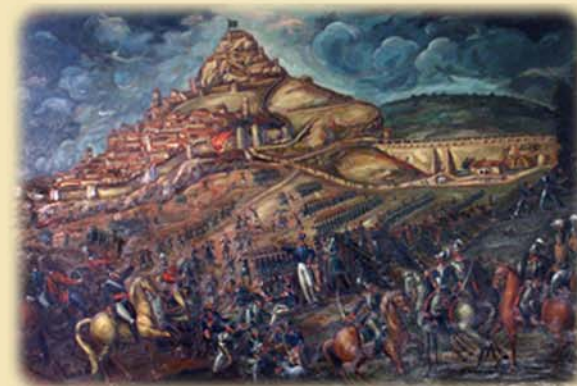
Sitio de Morella.

La derogación de la Ley Sálica por Fernando VII mediante la Pragmática Sanción, que permitía reinar a Isabel, unido al descontento por la grave situación social y económica llevaría, a lo largo del siglo, a tres guerras civiles entre españoles, las Guerras Carlistas: 1ª Guerra Carlista (1833-1839), 2ª Guerra Carlista (1845-1849) y 3ª Guerra Carlista (1872-1874). El Norte de España, aunque en la primera guerra también se extendería al centro y sur de la península, fue el escenario principal de las contiendas. Zumalacárregui, Maroto, Cabrera por parte carlista y Espartero, del lado isabelino, fueron generales destacados en estas guerras.