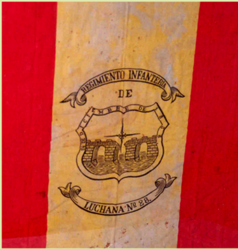
Bandera de Mochila Regimiento de Infantería Luchana nº 28