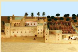
Maqueta del Palacio Real de Valencia

El Liberalismo inicia en España su andadura, y con él acabaría el Antiguo Régimen. En ese contexto histórico complejo, se fraguó la primera Constitución Española de corte liberal, sancionada por las Cortes de Cádiz en 1812, y conocida popularmente como “La Pepa” por ser el 19 de mayo el día de su aprobación.