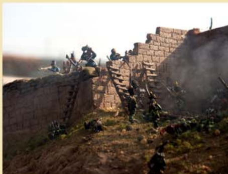
Maqueta del Castillo de Sagunto 1811

El regreso del rey Fernando VII terminó, después de disolver las Cortes, con el retorno del absolutismo.