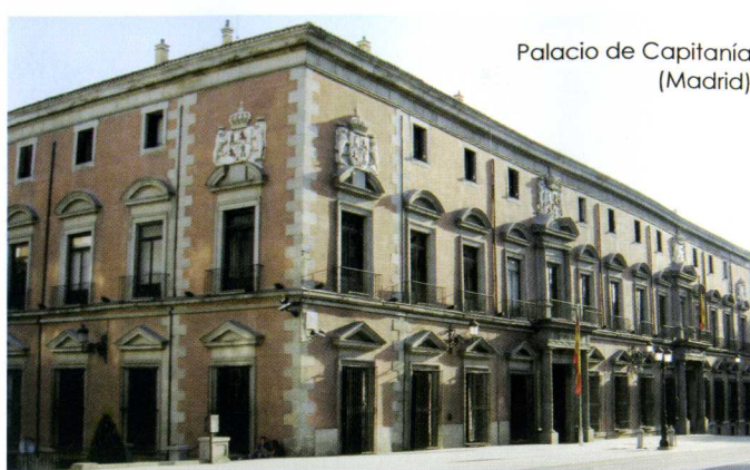
Palacio de Capitanía (Madrid)