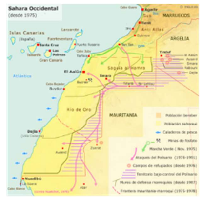
Mapa del Sahara Occidental (1975)

España mantuvo la posesión de Ifni hasta 1969.