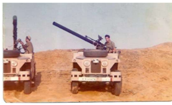
Posición Defensiva CSR en Smara (1975)

El 17 de Septiembre de 1974, el II Batallón del Regimiento al completo, emprende la marcha a la Provincia del Sahara, ocupando las posiciones en la Zona de Smara.