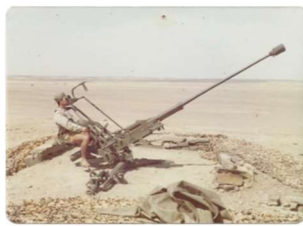
Posición Defensiva AA Oerlikon en Smara (1975)

Permanece allí hasta el día 17 de Diciembre en que se inicia el regreso. Un Destacamento de 80 hombres queda desplegado para custodiar el material y vehículos que quedan en la Zona.