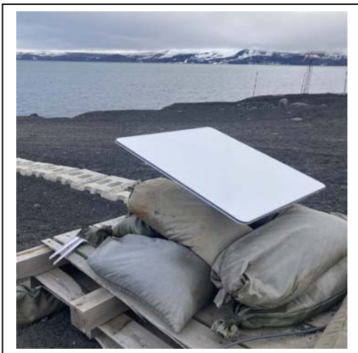
INSTALACION TERMINAL STARLINK