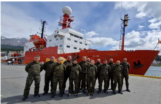
DOTACION FRENTE A BIO HESPERIDES

La travesía se inició el 27 de diciembre en torno a las 23:00 horas. Previamente, tras el embarque, se recibió