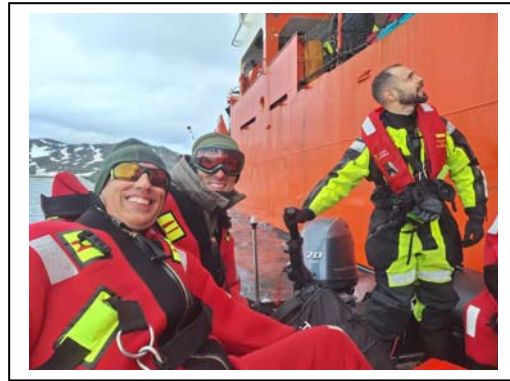
BARQUEOS DESDE EL BIO HESPERIDES