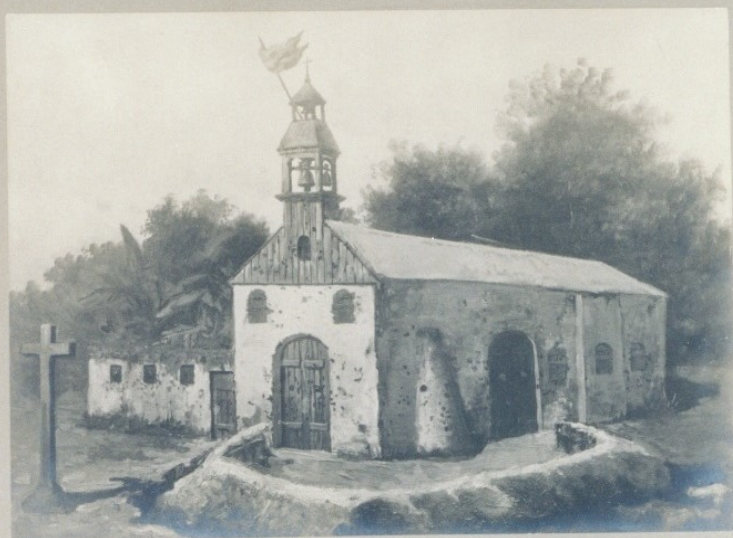
Iglesia de Baler (Filipinas) donde el destacamento sitiado estuvo defendiéndose desde el 30 de junio de 1898 al 2 de junio de 1899

Museo Histórico Militar Antonio Martín 1-3-1940