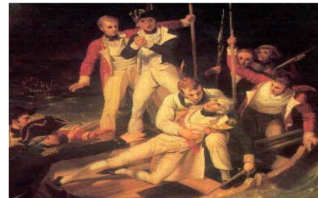
Copia de “Horacio Nelson herido” de Richard Westall (Museo Histórico Militar de Almeyda)