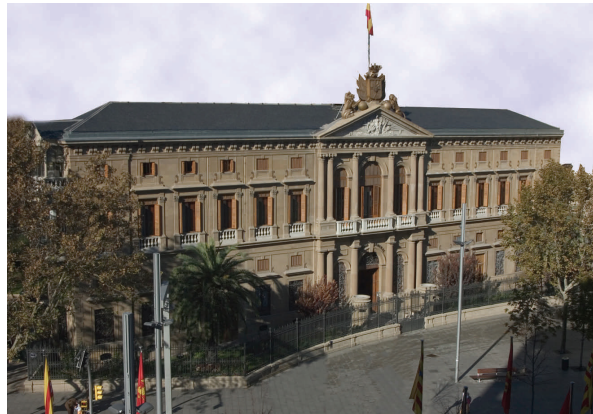
Fachada del Palacio de Capitanía General de Zaragoza

por unos días la obra del pintor catalán y que permitirá al público acercarse a un periodo de la historia muy ligado emocionalmente a la ciudad del Ebro, como es la Guerra de la Independencia, y también a la historia de alguna de las Unidades del Ejército que tienen su sede en la capital aragonesa.