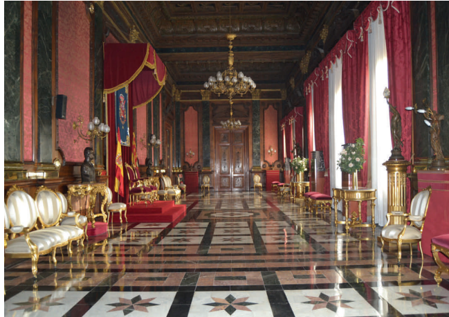
Throne Room of the Palace of Capitanía General de Zaragoza

a few days the works of this Catalan painter, so the public can experience a period of history very emotionally tied to the city of the Ebro river, such as the Peninsular War, and also the history of the Army units that are based in the capital of Aragon.