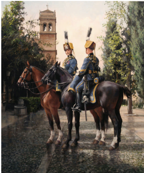
Lusitania, 1909 Ferrer-Dalmau, 2011

Con motivo del Día de la Hispanidad, y en fechas próximas a esta conmemoración, el Palacio de Capitanía General de Zaragoza abre sus puertas para acercar a la ciudadanía un edificio que es parte inherente del patrimonio arquitectónico aragonés y sede de la Comandancia Militar de Zaragoza y Teruel. En esta ocasión, su Salón del Trono acoge una atractiva muestra pictórica de uno de los artistas vivos más emblemáticos de este país.