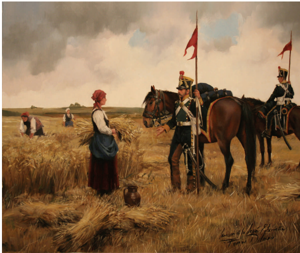
Lanceros de la legión extremeña Ferrer-Dalmau, 2010

On the occasion of Columbus Day, and on dates near this traditional commemoration, the Palace of the Capitanía General of Zaragoza opens its doors to the public to show a building that is an important part of the architectural heritage of Aragon and the site of the Military Commander of Zaragoza and Teruel. Today, the Throne Room houses an attractive art exhibition of one of the most emblematic living artists in Spain.