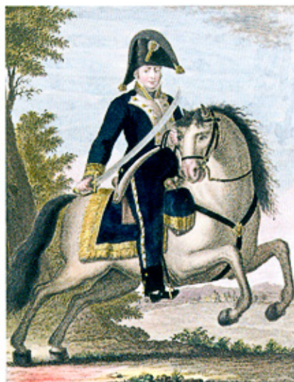
Retrato de Francisco Rovira BNE

E l nombre de Francisco Rovira (1764-1820), Doctor en Teología y Brigadier del ejército español, permanecerá por siempre ligado a uno de los episodios más sorprendentes que tuvieron lugar en tierras catalanas durante la larga lucha contra el dominio napoleónico. En efecto, la recuperación del Castillo de San Fernando de Figueras, la madrugada del 10 de abril de 1811, por medio de un golpe de mano llevado a cabo por las tropas de la División del Ampurdán, constituye una de las páginas más recordadas de la Guerra de la Independencia (1808-1814) en este territorio fronterizo, así como la posterior defensa de la fortaleza durante algo más de cuatro meses frente a un enemigo muy superior.