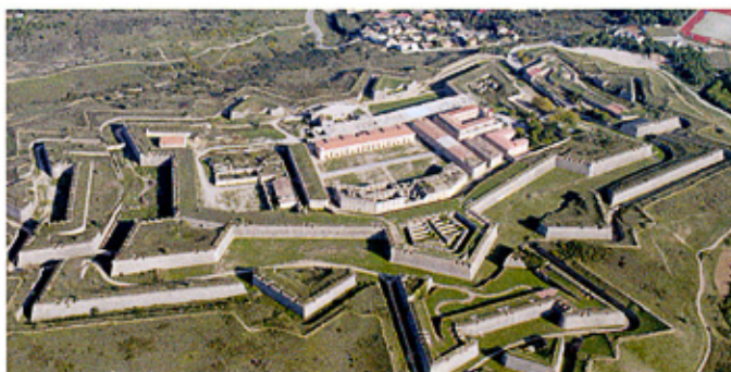
Castillo de San Fernando de Figueras (Girona)

En la muestra se exhibirán importantes fondos de distintas entidades, en especial, un cuadro del Museo del Prado que ha sido recientemente identificado como retrato del mismo Rovira.