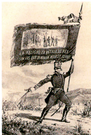
Bandera del batallón de Almogávares